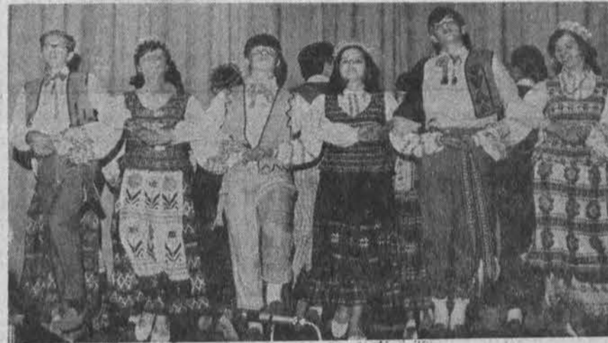
"Šoktinis" atlieka programą Clevelande.

Nedarbingu laikomas asmuo, kuris dėl fizinių ar protinių negalavimų negali atlikti pastoviai produktyvaus darbo ir numatoma, kad negalės dirbti ne mažiau kaip 12 mėnesių. Norint gauti draudimo mokėjimus, reikia pristatyti nedarbingumo įrodymus iš daktaro, ligoninės ar kitų įstaigų ir amžiaus įro-