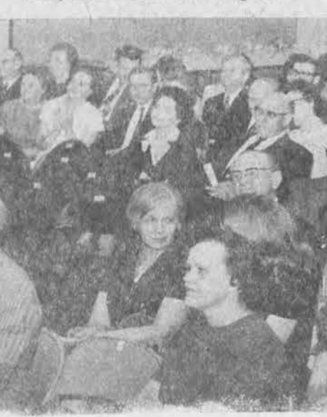
Clevelandiečiai (dalis publikos) žiūri "Antrojo kaimo"