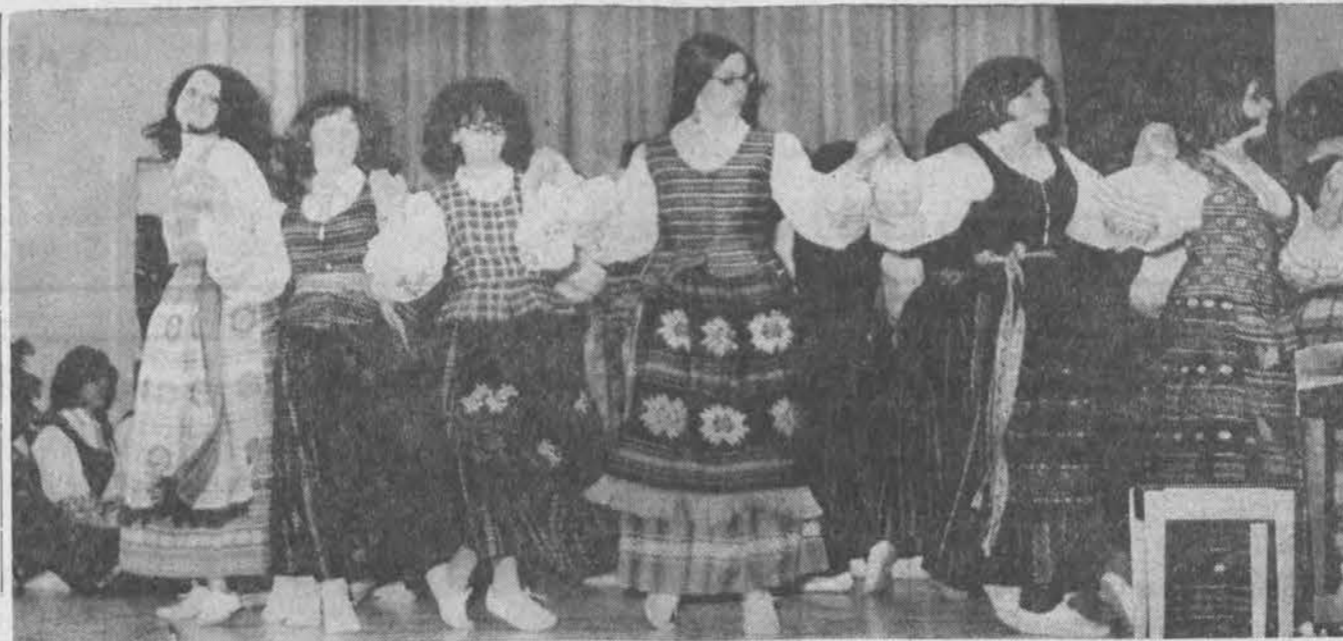
Putnamo lietuvių bendra bučio tautinių šokių grupė.

Penktąją grupę: Švedija, Norvegija, Prancūzija. Iš sužaistų iki šioliai rungtynių yra sekanti pasėkmė: Švedija — Norvegija 5:0, Prancūzija — Norvegija 0:1, Švedija — Prancūzija pirmos rungtynės įvyks spalio 15, 1969 m. O antros lapkričio 1, 1969 m. Švedijos rinktinė 1968 m. sužaidė, įskaitant ir nepirmenybių rungtynes, 8 kartus. Iš kurių 3 laimėjo, 3 sužaidė lygiomis ir 2