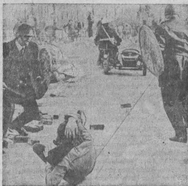
Ir Amsterdamė (Olandijoje) komunistuojantieji mėgino sukelti riaušes, bet policija demonstrantus išsklaidė.

Piao išgelbėjo Kiniją nuo pastovios tarpusavy kovos. Jo vadovaujama kariuomenė ne tik užgnaužė sukilimus eilėje sričių, bet ir palaikė tvarką. Mao ir Piao didelį nerimą kelia Sovietams.