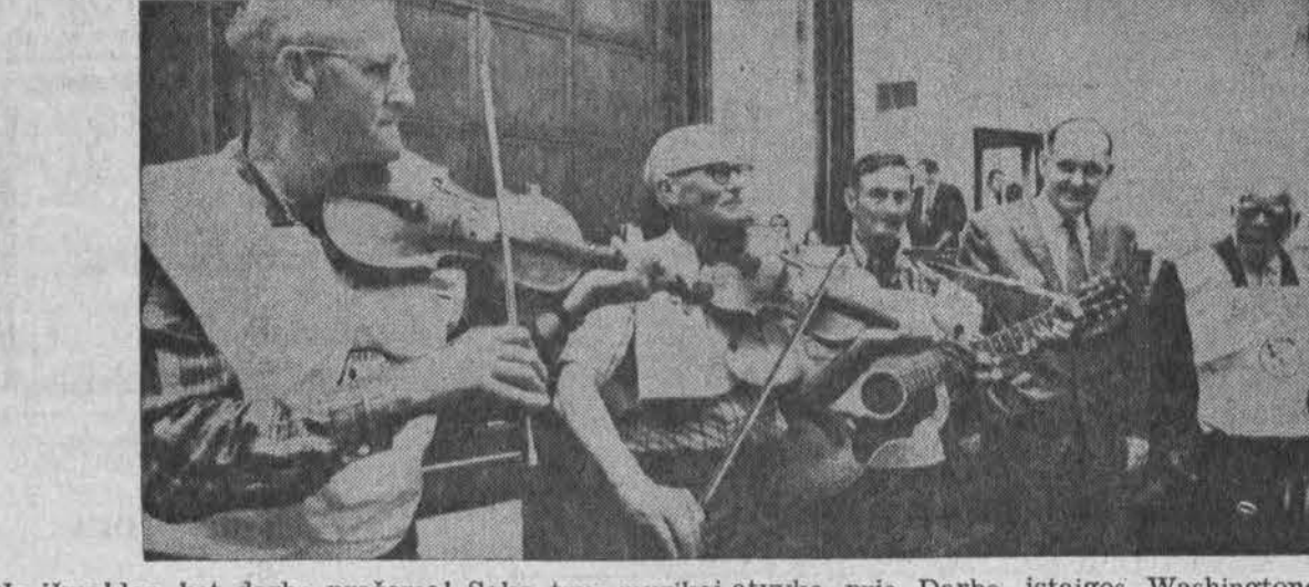
Ne išmaldos, bet darbo prašome! Sako trys muzikantai, vykę prie Darbo įstaigos Washingtono. Greta jų dešinėje stovi vienas 93 metų amžiaus buvęs darbininkas.

Planai, teoretinės sistemos ir svarstymai nieko nereiškia, jei jie nesvykdomi. Visada reikėtų žiūrėti, kad mūsų mintys, liečiančios augantį jaunimą — kar tiais labai geros! — netyčiomis kur neužkristų ir neliktų pamirštos. LB apygardos ir apylinkės turėtų kasdien jomis gyventi.