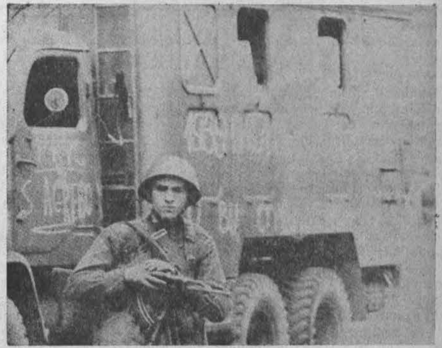
Okupacija Čekoslovakijoje tebedidėja: varžtai gyventojams neatleidžia, spaudimas didėja, vis mažiau laisvės spaudai. Čia okupanto kariai Prahoje

Brazilijos gyventojų skaičius ligi 2000 metų pakilsiąs dešimteriopai ir pasieksiąs 3.5 ml. — teigia privačiai įvykdyti tyrimai.