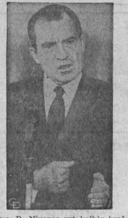
Prez. R. Nixonas ryt kalbės kraštui

Vis dėlto, nesitikima, kad savo kalboje prezidentas paskelbs