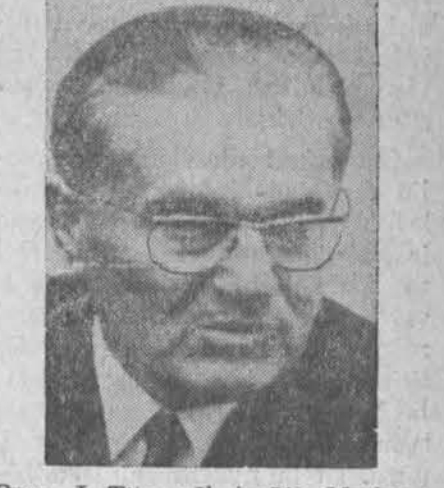
Prez. J. Tito vėl išspėjo Maskvą: mes giminsimės...

Prezidentas Tito skatino Jugoslaviją: ji privalo vis budėti, nes tai turi ryšio su bendra padėtimi pasaulyje ir dėl to, kad "mūsų kraštas yra geografinėje kryžkelėje ir jis įdomus toms didžiosioms valstybėms, kurios norėtų mūsų krašte turėti daugiau įtakos".