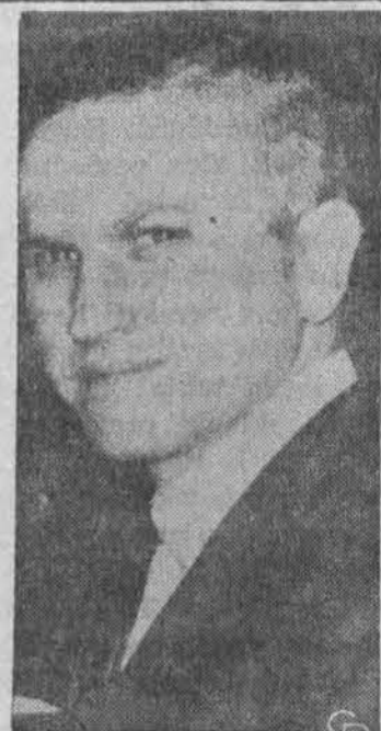
Frank Borman, žinomas astronautas, Apolo VIII, apskridusio mėnulį komandos vadas, pakėlė orbitą pereinamas į naują darbą — Erdvės studijų centrą.