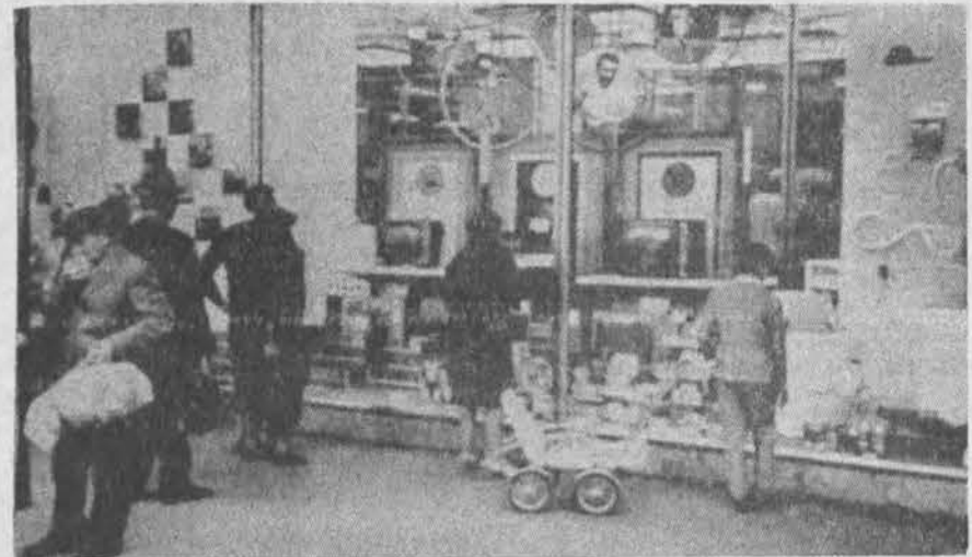
Budapešto gyventojai ties krautuvinių vitrinomis. Prekių vis tebetūrksta.

Kritikų balsas išgirstas vyriausybės sluosniuose ir, žinoma, jis vertinamas neigiamai. Vyriausybė nurodo, kad tie ūkio žinovai turėję progos savo nuomone pareikšti anksčiau, dar prieš Bonnos žygio skelbimą, bet to neįvykdė. Dabartinė gi kritika, pabrėžiama, galinti sukelti "klaidingas piniginių spekuliantų vilčių". Piniginės krizės klausimas ryškus ir parlamento sluoksniuose. Pvz., opozicijos partija — laisvieji demokratai (FDP) užvakar pareiškė numatą šį klausimą iškelti Bundestage (žemojo parlamento rūmuose) ir ta proga jie klausia: kokių priemonių busi grėbiama, siekiant atsikratyti kraštą suplaukusią valiutų ir kuriuo būdu numatyta patikrinti valiutos pastovumą ateity?