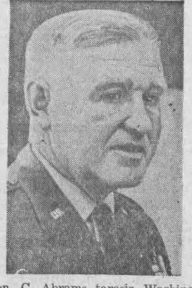
Gen. C. Abrams tarėsis Washingtono, vakar išskrido atgal į Saigoną.