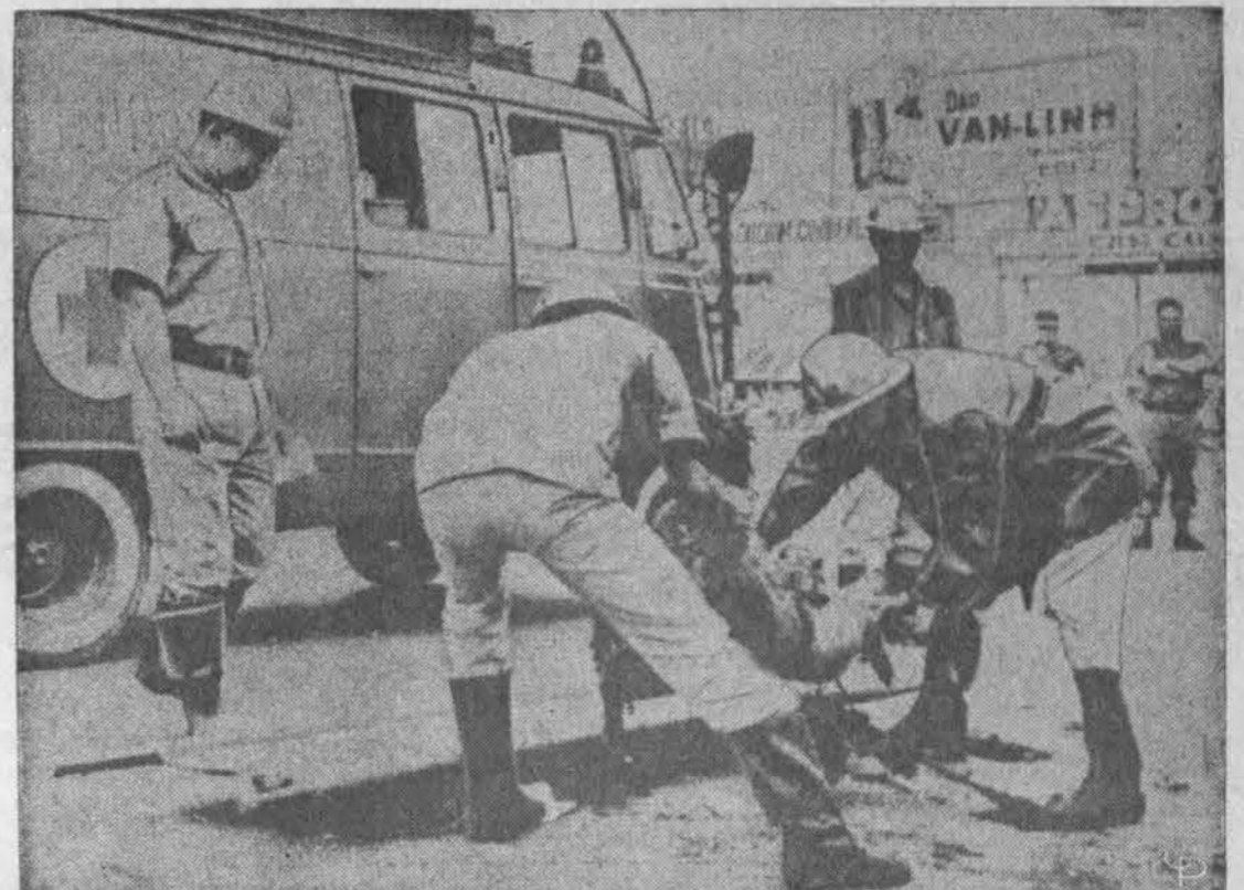
Komunistai vykdė teroro puolimus Saigone. Čia viena civiliųjų aukų — nužudytasis keliamas į auto mašiną miesto centre.

Zodis laikytinas naujos, lankstesnės krypties išraiška, palankiai vertinamas Vakaruose. Jis liks svarbiu pareiškimu ir turės įtakos pasitarimams ateity. Tačiau, paties prezidento žodžiais, jis nereikšia, jog taika — jau čia pat.