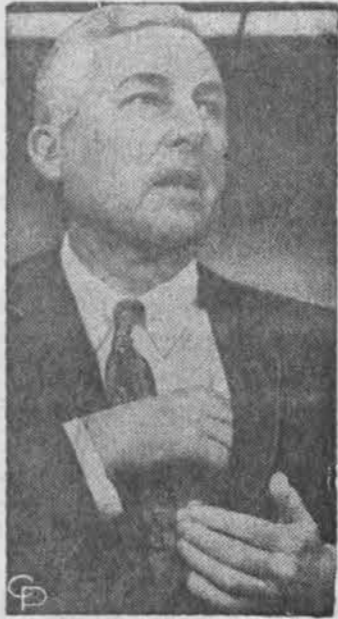
N. M. Pusey, Harvardo universiteto prezidentas, liudydamas Atst. Rūmuose, siūlė nebausti studentų maistinėse, gaunančių valdžios paramą. Ešą, tai tik sukurstytų kraštutinius studentus