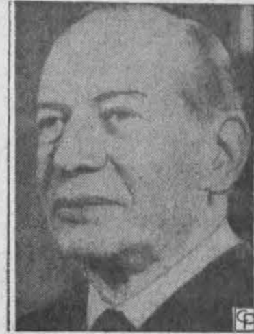
Abe Fortas, Aukšč. Teismo teisėjas, kaltinamas gavęs 20.000 dol. kyšį. Jis vakar atsistatydino

• Malajzijoje įvesta karo padėtis. Neramumai kilo, rinkimuose pralaimėjus kinams. Jiems atšaukus savo atstovus vyriausybėje, malajiečiai susidūrė su kinais.