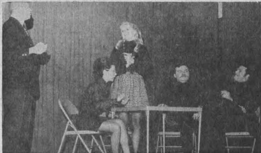
Chicagoškis "Antrasis kaimas" buvo pastebęs Clevelandą, Sv. Jurgio parapijos salėje suruoštame spektaklyje jį stebėjo daugelis clevelandiečių. Čia matome aktorius vieno vaidinimo metu.

Gegužės 5 d., Sv. Jurgio parapijos bažnyčioje, buvo metinės