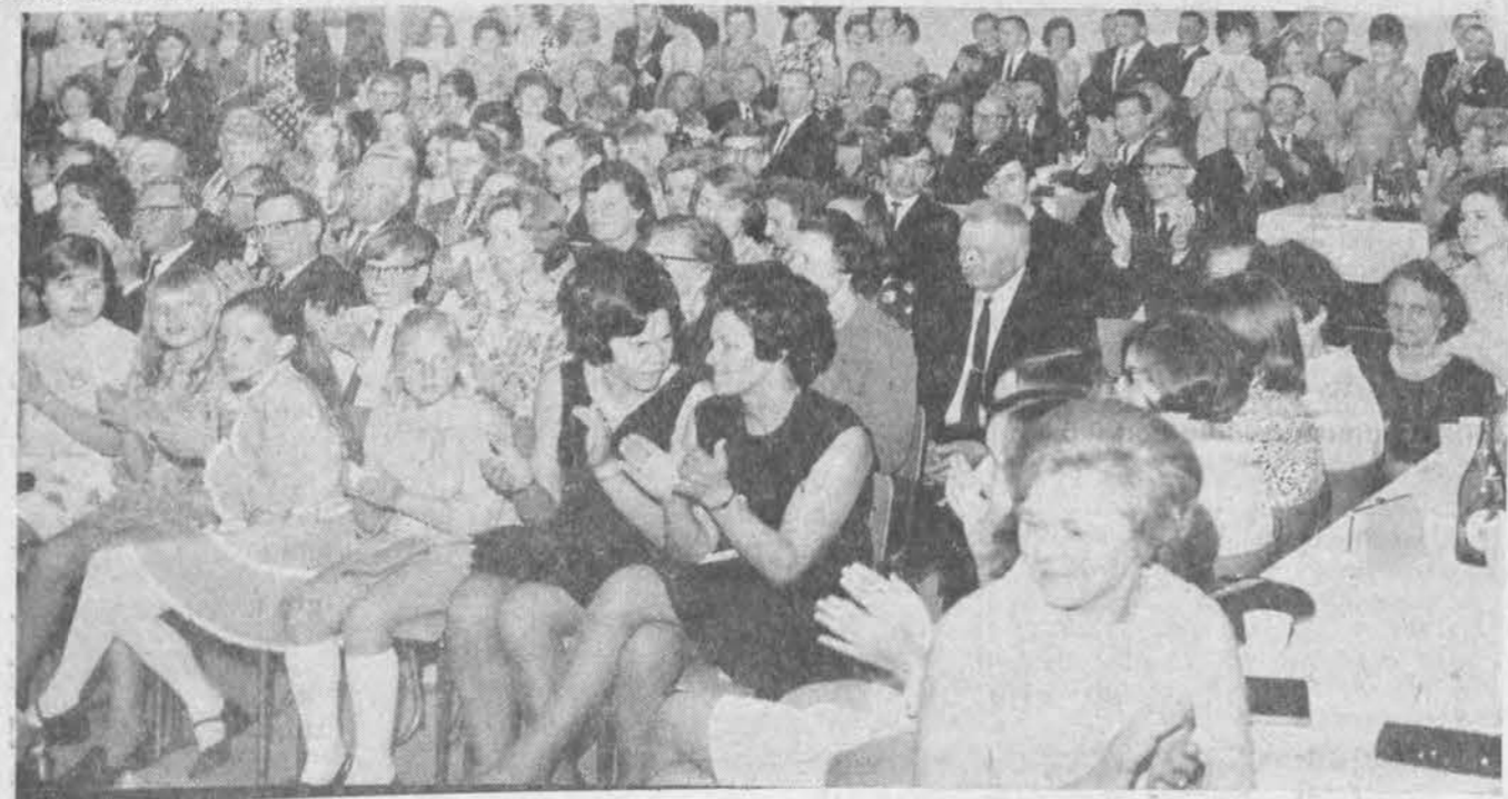
Apie 500 clevelandiečių užpildė salę literatūros vakaro metu.