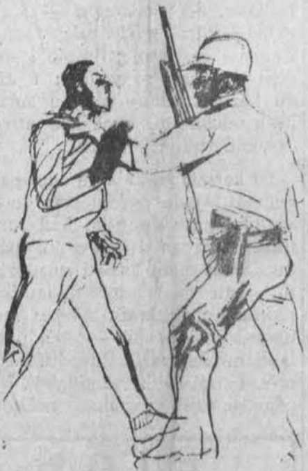
Karys ir "maištininkas" universitetuose

Tačiau visvien tenka kelti įspėjimo balsus jau vien dėl to, kad, kaip patirta, SDS vadai pasiryžę vykdyti dar radikalesnius, kraštutinius veiksmus ir ieškoti talkos "darbo klasės"