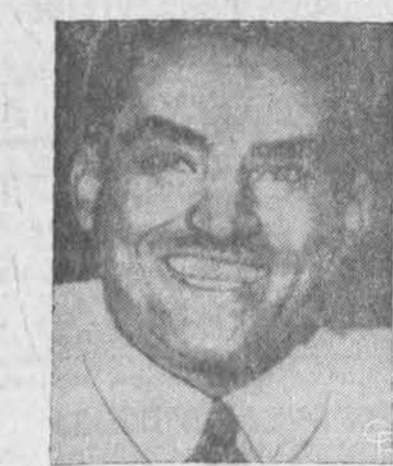
A. Avadallah, perversmui Sudane įvykus, naujasis min. pirmininkas ir užsienio reik. vadovas.

Pats Rockefeller pažymėjo, kad P. Amerikos kraštuose vykdomos studentų riaušės yra gerai organizuotos ir tie studentai gauna nurodymų ne tik iš vidaus, bet ir iš užsienio.