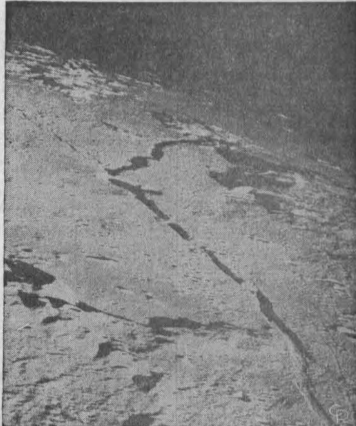
"Apollo 10" skrydžio astronautai parvėžė žemėn labai daug gerų mėnulio paviršiaus nuotraukų. Čia viena labiau vykusių. Foto nuotraukos turės daug reikšmės rengiantis šiu metų liepos m. nukelti du JAV astronautus mėnulyje.

● Sovietai požemy išsprogdi- no atominę bombą — tai patyrė Uppsalos institutas Švedijoje. Sprogimas įvyko Sibire, Semipalatinsko srityje. Prieš tai bandymas įvyko gegužės 16 d.