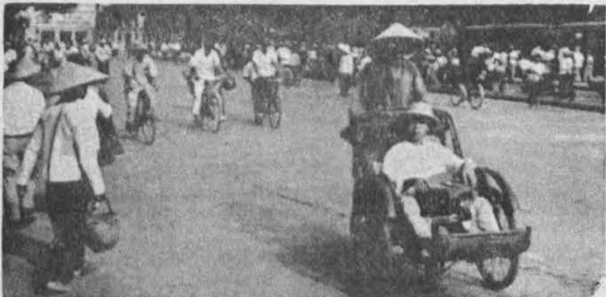
Saigono gatvėje: šalia auto mašinių, matyti daug kitokių susisiekimo priemonių