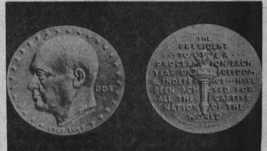
Medalis su b. prezidento D. D. Eisenhowerio atvaizdu, Pavergtųjų Tautų Komiteto nukaltas šių metų liepos m., minint 10-ją Pavergtųjų Tautų Savaitės skelbimo JAV-se sukaktį.

Keli tūkstančiai demonstrantų Sydney ir Melbourne miestuose ties JAV konsulatais suėdė Amerikos vėliavas. Įvyko susidūrimų su policija.