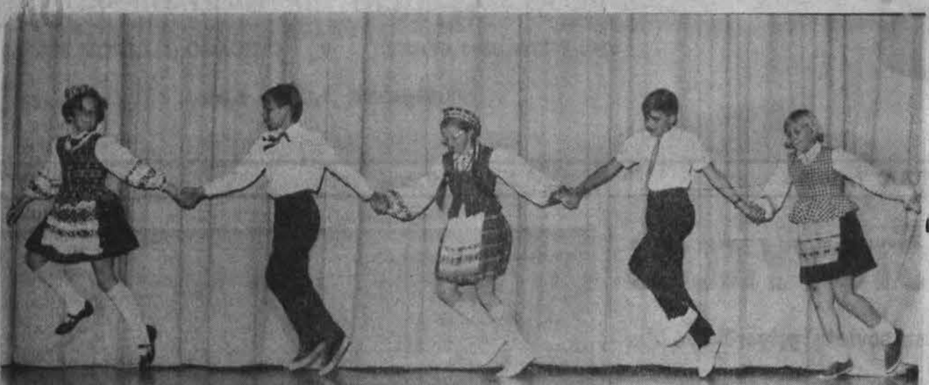
Clevelando Sv. Kazimiero Lituan. mokyklos tautinių šokių grupės "Soktinis" šokėjai mokyklos užbaigimo metu.