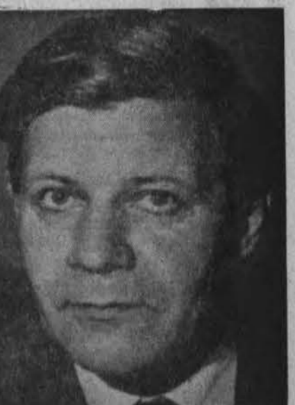
Helmut Schmidt, vienas žymiųjų socialdemokratų politikų Fed. Vokietijoje, lankosi Washingtono ir, greičiausiai, bus priimtas Balt. Rūmuose