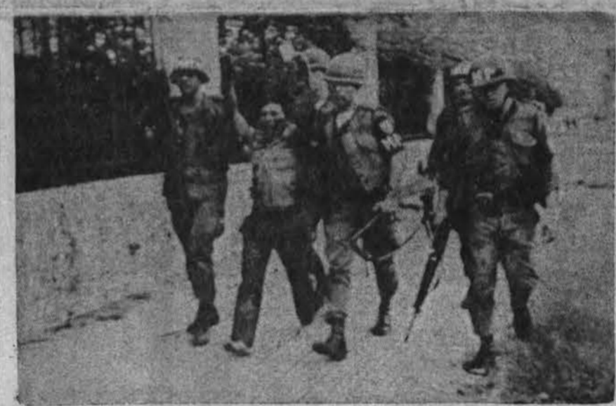
Įprastas vaizdas P. Vietname: amerikiečiai veda sugautą Vietkongo partizaną.

JAV kariniai sluoksniai Saigone greičiau linkę manyti, kad šio mėto komunistų karinė politika P. Vietname tai, greičiau, taktinis ėjimas. Po veiksmų su-