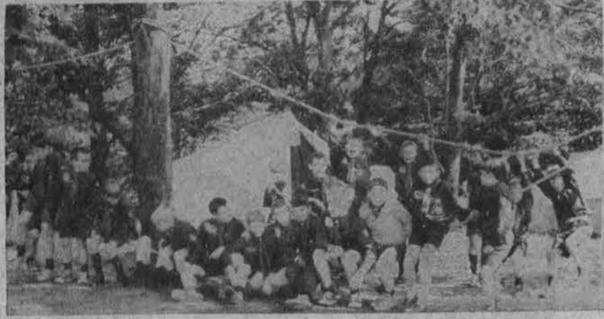
Smagu stovyklauti. Viena Chicago's jaun. skautų draugovė Rako stovyklavietėje.