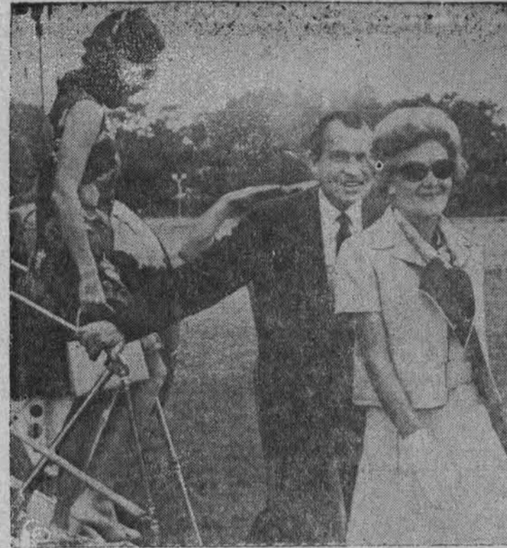
Prez. Nixon su žmona ir dukrele šventės praleido Miami, Fla. Jie čia matyti aerodrome.