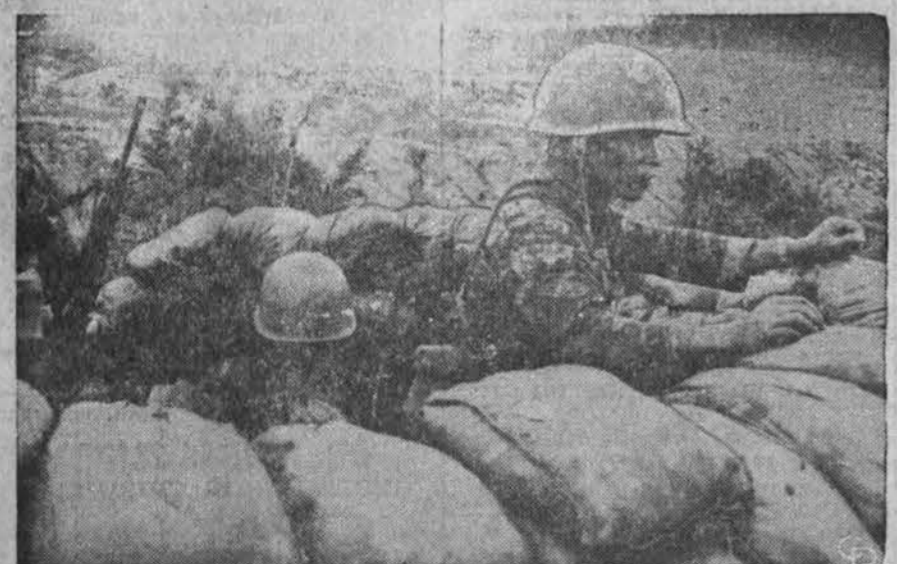
Ben Het apsuptos stovyklos gynėjai. Šiomis dienomis paskelbta: daugiau kaip 50 dienų vykdyti prieš puolimai sumažėję.