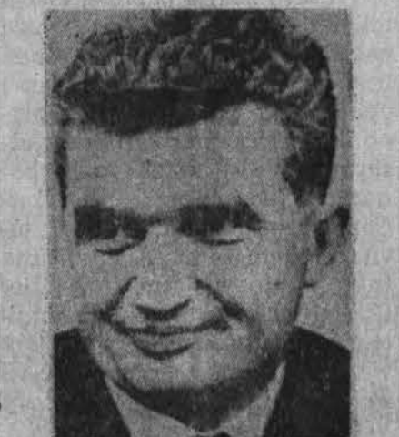
N. Ceausescu, Rumunijos prezidentas ir partijos vadovas

Dabar, kaip jau skelbta, sovietų politikai savo kelionę į Bukareštą, atrodo, bus atšau-