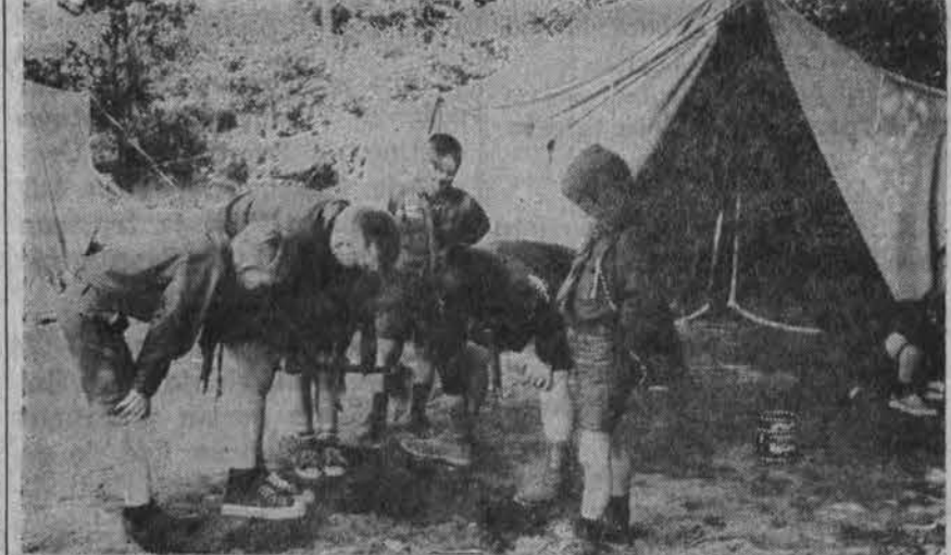
“Lituanicos” tunto viena jaun. skautų skiltis dabar vykstančioje stovykloje vieno skautiško žaidimo metu.

GYDYTOJAS IR CHIRURGAS 6449 So. Pulaski Road Val.: pirmad., antradi., penktadienį 1-4 ir 6-8 v. v., ketvirtadienį 6-8 v. vakaro. Šeštadieniais 11-1 val. popiet.