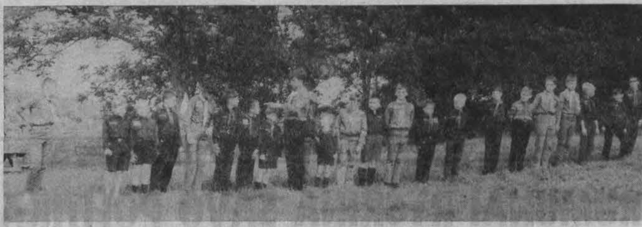
Detroito “Baltijos” tunto broliai ruošiasi vėliavos pakėlimui “Miškų brolių” stovykloje.

Stalo tenise: I v. New Yorkas, II v. Bostonas. Stalo teniso - senjorai: I v. Hartfordas, II v. Kennebunkportas, jaunučių krepšinis: I v. Bostonas, II v. New Yorkas.