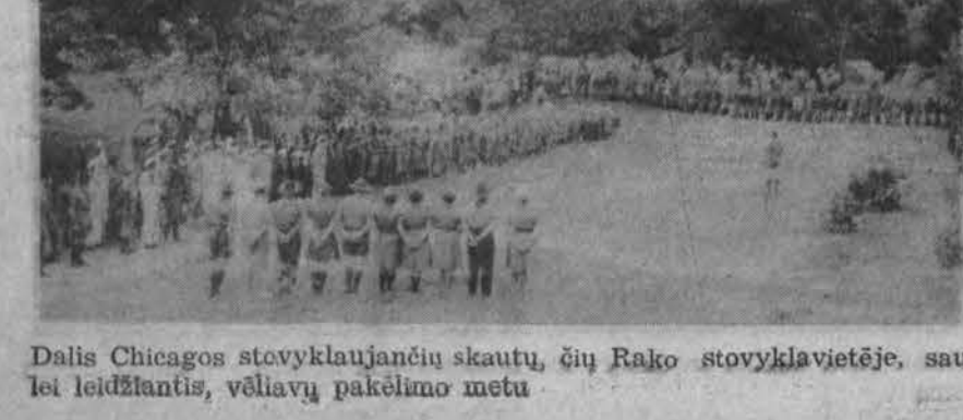
Dalis Chicago stovyklaujančių skautų, šių Rako stovyklavietėje, saulei leidžiantis, vėliavų pakėlimo metu