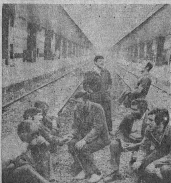
Italijoje susstrebavus geležinkelių unijai: darbininkai šnekučiuoja si Romos geležinkelio stoty.

Prezidentas G. Saragat pasitarimus su partijomis pradeda tik ketvirtadienį. Politinių sluoksnų nuomone, labai galimas dalykas, kad prezidentas kreipsis į ligšiolinį min. pirmininką M. Rumor ar kitą krikščionių dem.