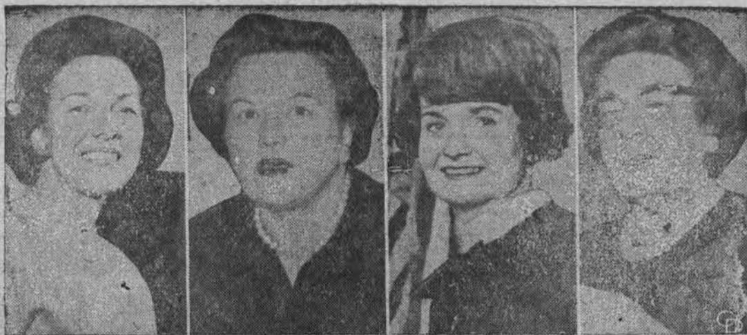
Florence Dwyer, Margaret Hecker, Catherine May, Charlotte Reid.

Šios keturios respublikonų partijos veikėjos kalbina prez. Nixoną, kad jis neišlaikęs žodžio ir permaža moterims skyrė aukštų postų. Moterys esą turėjo gauti daugiau aukštų vietų, gi iš 1.200 naujų postų jos tegavė tik tuziną.