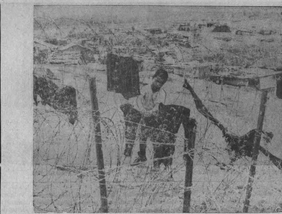
Pietų Vietname Ben Het bazėje kovos truputį aprimo, nes bazę priešas mažiau puola. Ramumu pasinaudoję vietnamietis išsiplovė skalbinius ir džiauna juos ant spygliuotos vielos užtvartų.

Pavergtųjų tautų savaitė, kurią yra paskelbęs šio krašto Prezidentas ir kuri mūsų minima liepos 13-19 dienomis, mus ypatingai įpareigoja iškelti laisvės mylinčiam pasauliui ir raudonojo kolonializmo žiaurumus. b. kv.