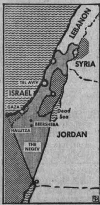
Izraelis ir aplinkinės arabų sritys

"Est. Events" paskelbė idomų faktų: vienas rusas atsidūrė Ukrainos miesto restorane ir nustebė, kai valgių sąrašas buvo atspausdintas ukrainiečių, prancūzų ir anglų kalbomis, bet... ne rusų kalba.