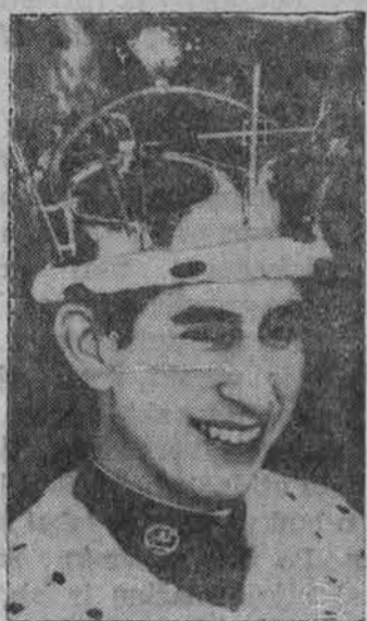
Britanijos princas Charles dēvi karūną su keliadesimt brangiųjų akmenų.