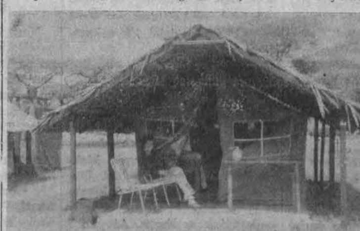
Serengiti parke viena iš palapinių stovyklos pakraštyje

Taip besišnekučiuojant prie mūsų prieina australiečių pora, tipiškai anglai. Abu aukšti, ploni, kalbos manieros išpūstos, nenatūralios. Bet tai, kas man atrodė vaidyba, jiems yra natūralu. Mane kutena juokas ir bijau pasižiūrėti į savo draugus, kad juose neišskaitytiau