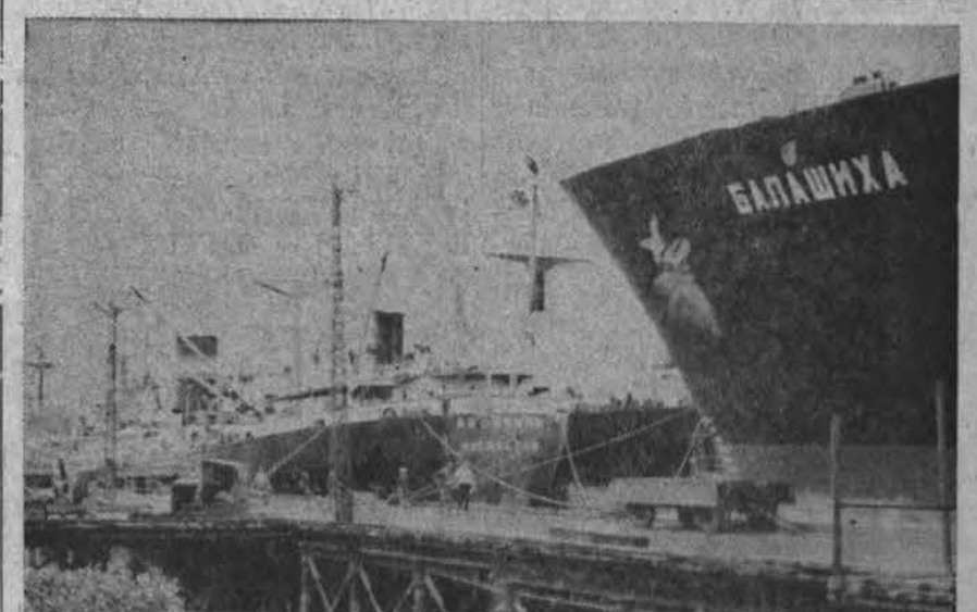
Rusai savo karine medžiaga vis labiau remia arabus — čia jų laivas Egipte

Ateity numatoma ir vėl vykdyti erdvės bandymus su beždžionėmis bei kitais gyviais.