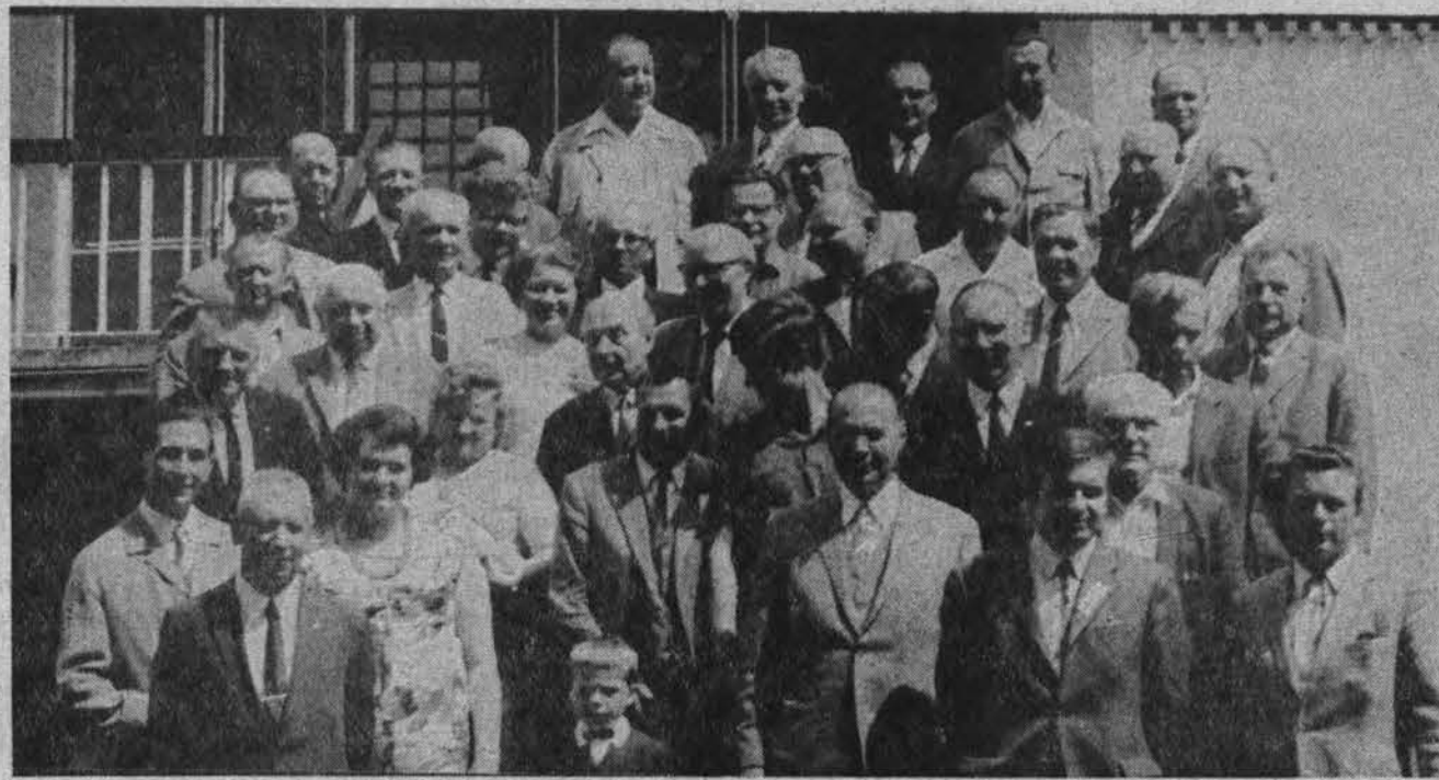
Vokietijos LB veikėjų suvažiavimo dalyviai Romuvoje.

Prisitaikydama prie V. Vokietijos federalinės santvarkos, V.ios LB valdyba yra paskyrusi savo įgaliotinius prie kiekvieno krašto vyriausybės. Įgaliotiniai buvo pakviesti dalyvauti B-nės veikloje suvažiavime ir padaryti pranešimus. Atvyko 7 kraštų atstovai.