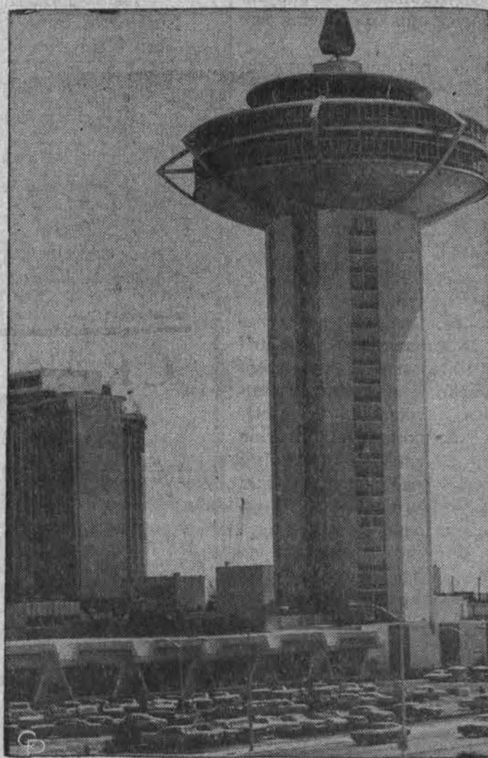
Du nauji modernūs viešbučiai pastatyti Las Vegas.