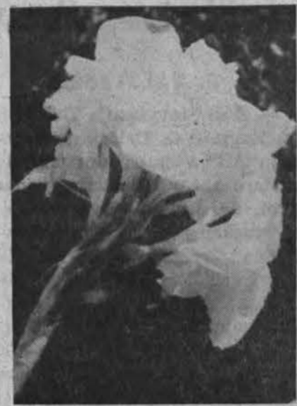
Vasaros žiedai.

— Bendruomenės Balso gegužinė Philadelphiaje ruošiamą rugsėjo 7 d. Olympia Lake, prie 130 kelio, N. J. Ją ruošia BB komitetas. (KČ.)