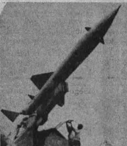
Raketa prieš raketą

Prez. Nixonas, JAV vyriausybės, aišku, taria užvakar laimėsi (tą patį, priešinga kryptimi, teigia ir pasiūlymo priešininkai...). Washingtono sluoksniai nurodo, kad pasiūlymą priėmus, netolimoje ateityje prasidėjus pasitarimams su Maskva ginklų gamybos varžymo klausimu, JAV-bės ar prezidentas galės turėti "stipresnį balsą" ir dar daugiau: reikšti rusų atžvilgiu griežtesnę laikyseną.