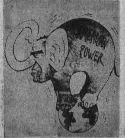
JAV — pasaulio sargyboje

Tikslas: apginti, prieš galimus priešo puolimus, keturis "Minuteman" raketų lizdus, septynias bombonešiu bazines ir pačią Washingtono sostinę.