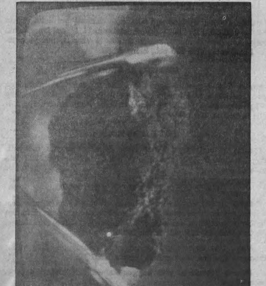
Satelitas Mariner 7 siunčia Marso nuotraukas. Matyti milžiniški krateriai.