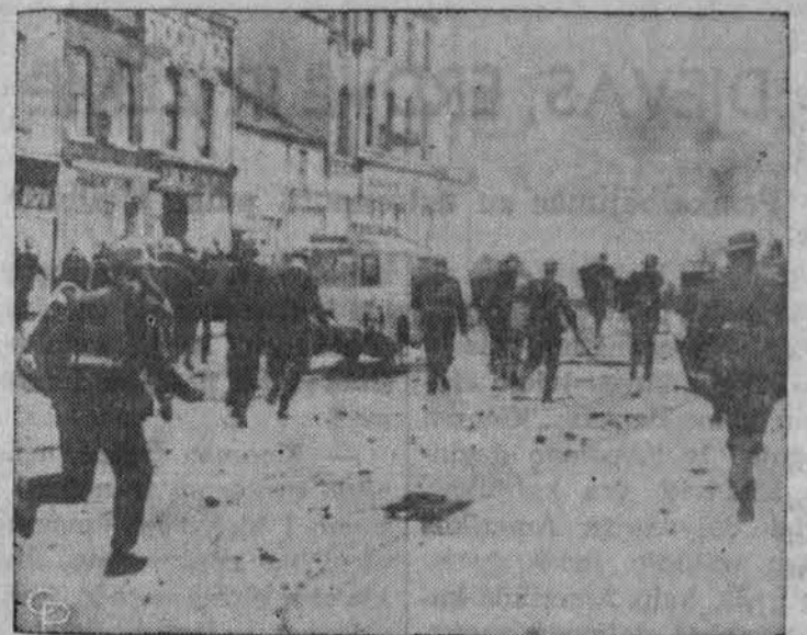
Siaurės Airijoje vėl vyksta susirėmimai tarp katalikų ir anglikonų. Suimta 55 asmenys, riaušėse sužeista 100 asmenų.

Panašų dalyku, be abejo, atsitiks ir ateityje, pavyzdžiui, kad ir neišsivysčiusiose tautose, kur nepaprastas gyventojų daugėjimas, genčių tarpusavė kovą, tolydžio krintančios žaliavų kainos ir daugelis kitu negeroviu veda į demagogiją ir nuotykių ieškojimą.