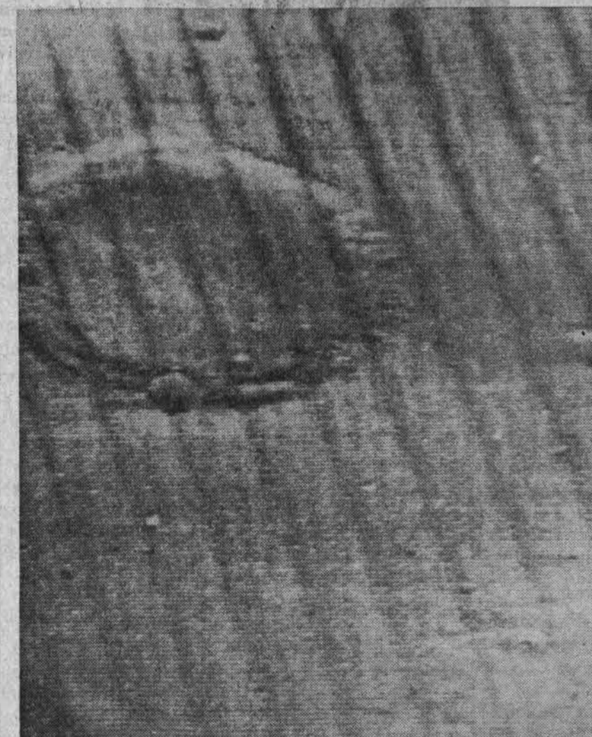
Marso nuotrauka, kurią padarė amerikiečių satelitas Mariner 6, lėkdamas 2,200 mylių nuotolio nuo Marso. Dešinėje krateris, 17 mylių skersmens. Matyti ir kiti mažesni krateriai. Eiliniam žmogui ši nuotrauka nedaug tepasako, tačiau astronomams nuotraukos atskleidžia labai daug.

Jugoslavijos federatyvinės valdžios bažnytinių reikalų komisija paskelbė pareiškimą apie Bažnyčios ir valstybės santykius. Komisijos įsitikinimu šie santykiai palaipsniui gerėja. Ta pati komisija pripažįsta, kad gerėjančių Bažnyčios ir valstybės santykių įtakoje labai sustiprėjo religinis gyvenimas visame krašte. Ypač plačiai sklinda religinė spauda. Vien Kroatijoje praėjusiais metais buvo išplatinta vienuolika milijonų egzempliorių katalikiškų laikraščių.