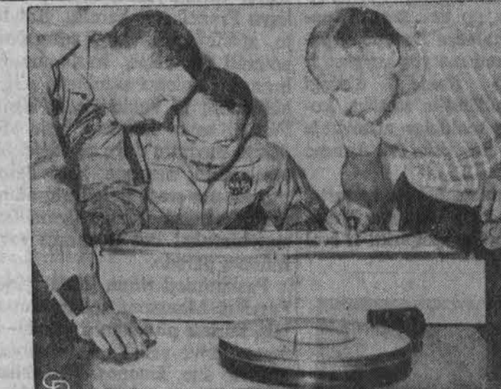
Houston, Tex., uždaryti astronautai apžiūri mėnulyje darytas nuotraukas. Iš k. į d.: Armstrong, Collins ir Aldrin.

DAUG AUKŠTŲ SVEČIŲ Popiežiaus Pauliaus VI-ojo laikymosi Ugandoje (Afrikoje) metu, Ugandos sostinėje Kampaloje buvo suvažiavę 8 valstybių prezidentai, 11 kardinolų, 120 vyskupų, 400 žurnalistų bei fotografų iš viso pasaulio ir apie milijonas tikinčiųjų.