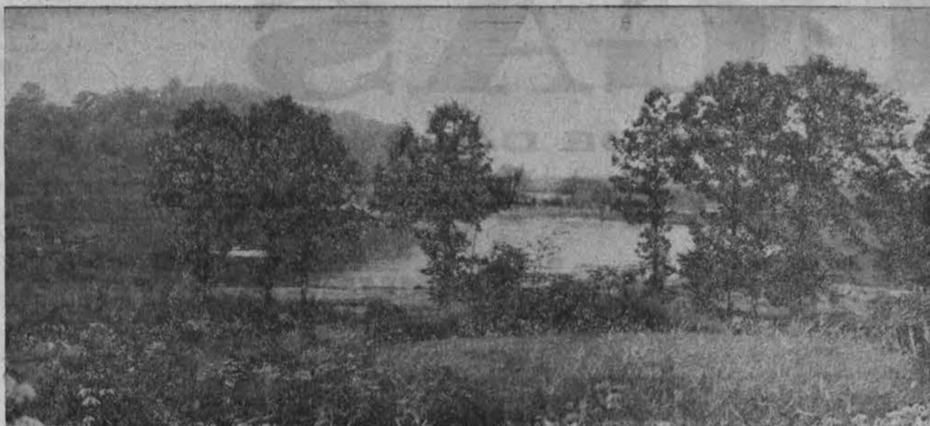
Vasara Dainavos stovykloje.

— Amerikoje 1968 m. buvo 4195 laivų nelaimės, kuriose žuvo 1,300 žmonių.