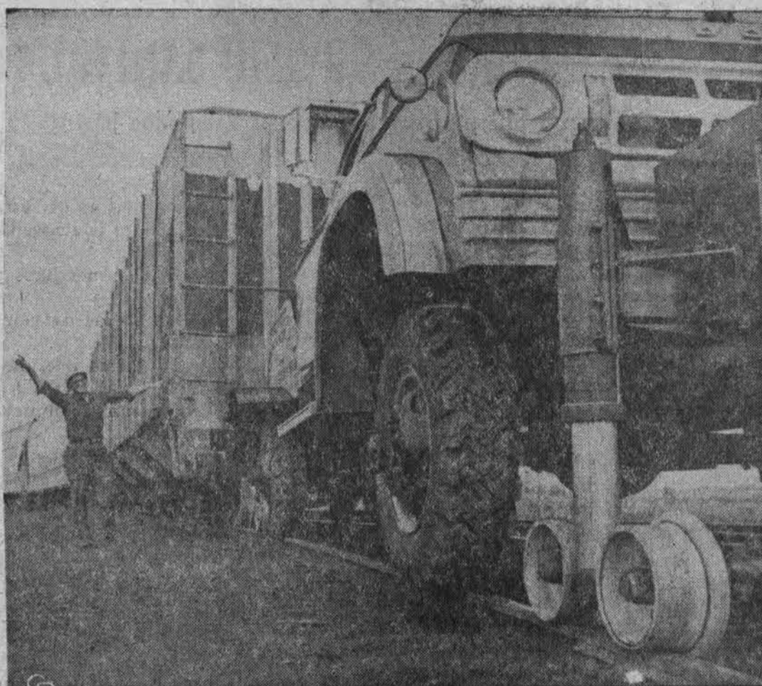
Clyde, Ohio, demonstruojamas toks sunkvežimis, kuris gali važiuoti keliais ir geležinkelio bėgiais tempti bent penketa sunkiai pakrautų vagonų.