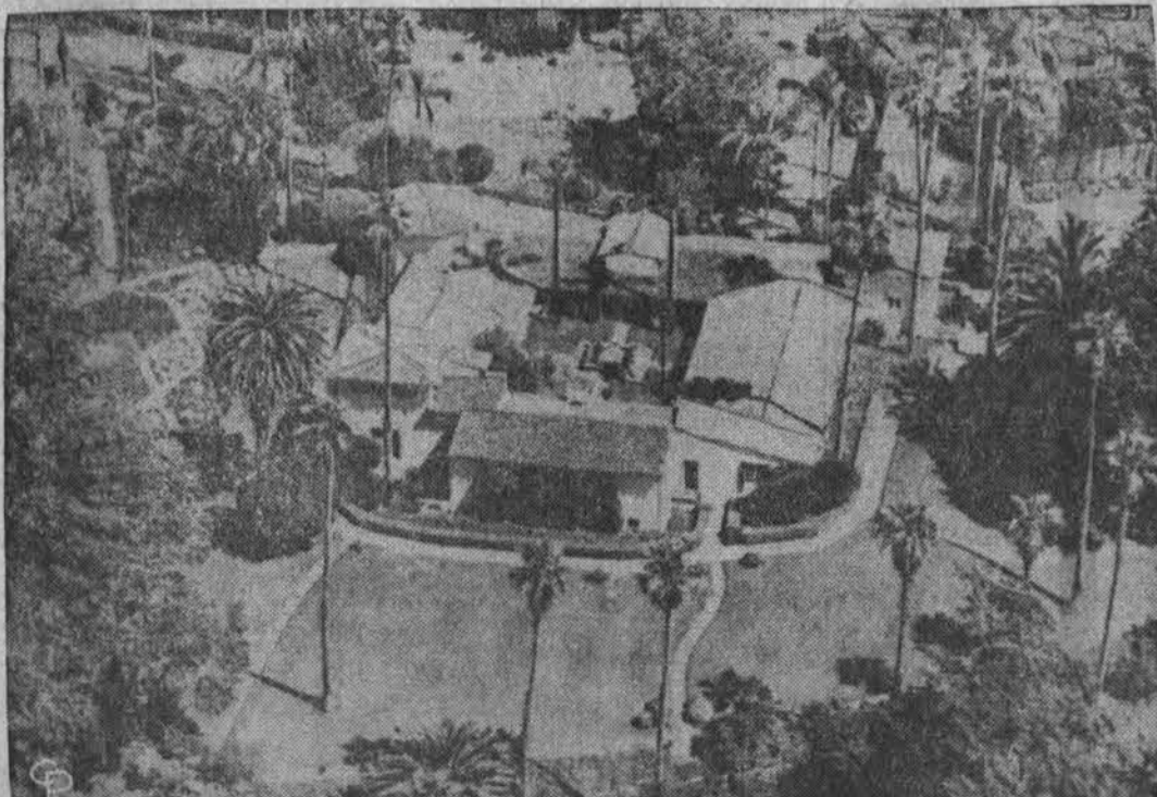
Vasaros meto Baltieji Rūmai — neseniai prez. Nixono įgyti namai San Clemente, Calif., ties Ramioju vandenynu.

● Prez. Nixonas ryt išvyksta keturioms savaitėms į naują vasaros būstinę, San Clemente, Kalifornijoje. Į Washingtoną grįš tik rugsėjo 7 d. Tačiau įvairios pareigos prezidentą vargins ir vasaros Balt. Rūmuose ties Ramioju vandenynu.