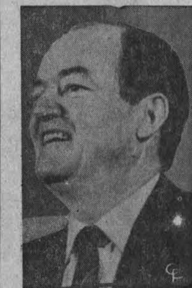
H. H. Humphrey, b. viceprezidentas, grįžęs į JAV iš kelionių Europoje.

Oro biuras praneša: Chicagoje ir jos apylinkėse šiandien saulėta, kiek vėsiar ir mažiau drėgmės, temp. sieks 80 ir daugiau 1. F., ryt — be pakitimų. Saulė teka 5:51, leidžias 8:02.