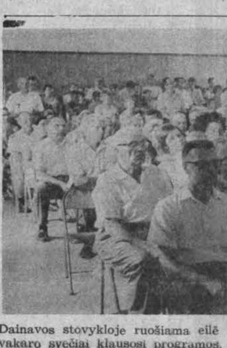
Dainavos stovykloje ruošinama eilė koncertų ir vakarų. Čia pernai Lietuvių fronto bičiulių suruošto meno vakaro svečiai klausosi programos.

× ZUVO DINAMITO SPROGIME Harry Carlson, 7536 S. Cons tance, neteko kojos ir vėliau mirė Jackson Park ligoninėje. Jam įlipus į savo automobilį ir užvedus motorą, sprogo po dangtimi pakista dinamito plytelė. Policija tiria, ar jis turėjęs santykių su nepageidaujamu elementu.