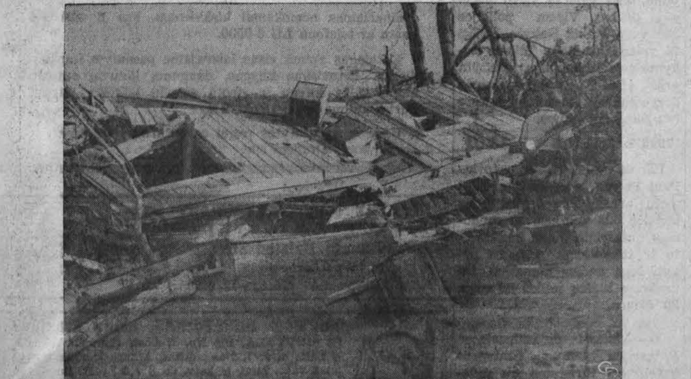
Šlaitrės Minnesotą nusigubė viešulas. Čia matyti sugriautas pastatas prie Brainerd, kur vasarviečių rajonas labai nukentėjo.