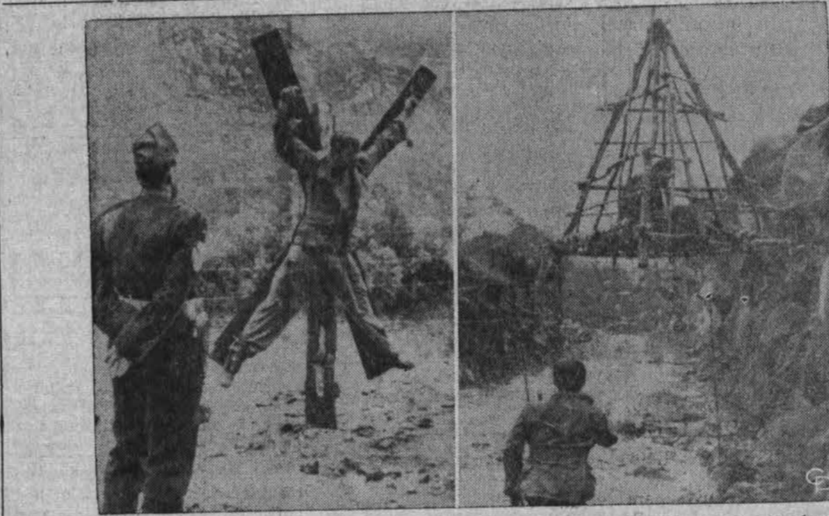
Brazilijos parašutininkai pratina miškingame kente, jeigu juos kovoj su sukilėliais paimtų ir nelaisvę. Kairėj vyras priištias ant stulpo, gi dešinėje jis uždarytas narve, kokius naudoja sukilėliai.

Penki Brazilijos kardinolai ap lankė Brazilijos respublikos prezidentą Costa e Silva. Ta proga buvo aptartos svarbiausios tautinės krašto problemos. Brazilijos prezidentas spaudos konferencijoje pareiškė, kad drauge su kardinolais pirmoje eilėje buvo apsvarstytos žemės reformos bei Bažnyčios ir valstybės santykių problemos.