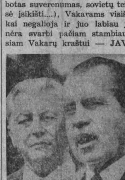
Prezidentas R. Nixonas su Vokietijos kancleriu K. G. Kiesingeriu, po pasitarimų B. Rūmuose. Šiandien abu skrenda, bet priešingomis kryptimis: prezidentas 4 savaitėms į San Clemente, Kalif., gi Kiesingeris — į Bonną ir iš jos vasaroti Tuebingene, Badens.

vakijos invazija, Maskvoje nukalta "Brežnevo samprata" (ribotas suverenimas, sovietų teisė isikišti...), Vakarams visiškai negalioja ir juo labiau ji nėra svarbi pačiam stambiausiam Vakarų kraštui — JAV.