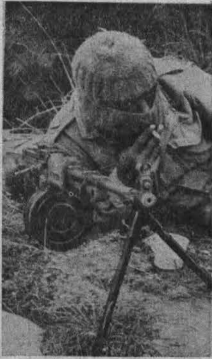
Arabų El-Al Fatah kovotojas išsis