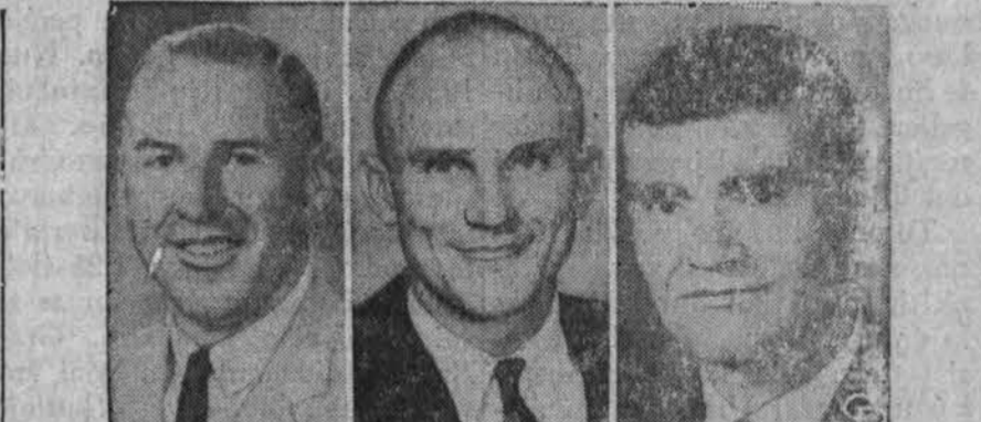
Jau paskirta "Apollo 13", skrydžio į mėnulį, įgula. Iš kairės jos vadas J. Lovell Jr., Th. Mattingly ir F. W. Haise, Jr. Skrydis numatytas 1970 m. kovą mėn.

Prez. Nixonas vertino šį, kelis kartus atidėtą, dviejų dienų pokalbį su vokiečių kancleriu. Prezidento žodžiais, viešnagei buvusi "ypatingai svarbi", ypač, tūneje, su dviem anūkiais.