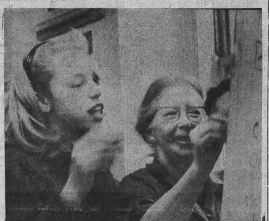
Mokslo metus pradėjus. Piešimo pamoka.