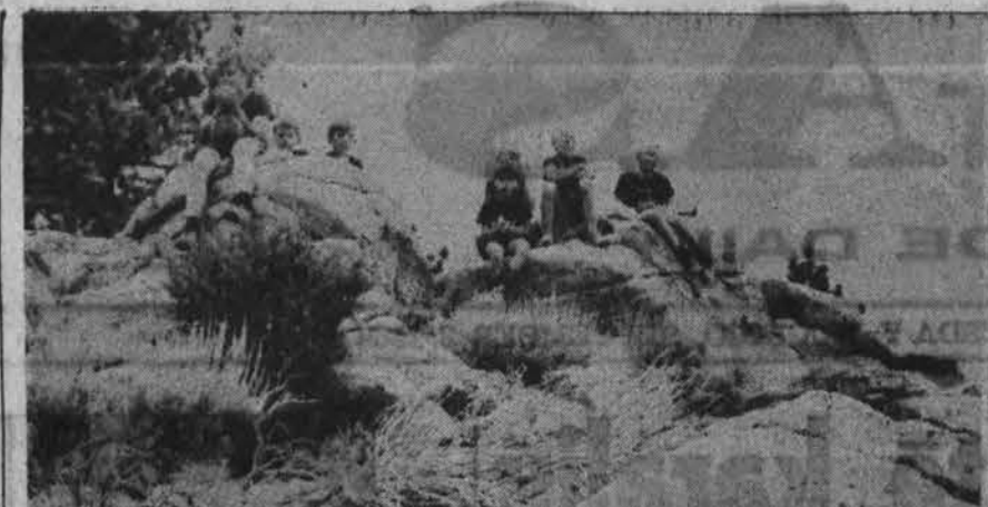
Dalis Los Angeles vilkiukų savo pirmoje stovykloje, įkopę į pačią kalno viršūnę žvelgia į papėdėje likusią Californijos dykumą.

LSS tarybos pirmija suvažiavimo prezidentumą pakvietė Bostonė, Mass., ir Prezidiumo Pirmininku išrinko s. fil. Koštą Neior-