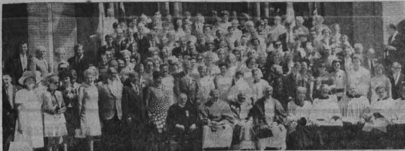
56-ojo Vyčių šeimo dalyviai ir svečiai.