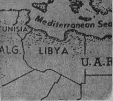
Libija prie Viduržemio jūros