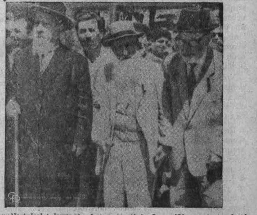
Ilgabarzdžiai žydai žygiuoja demonstracijoje Jeruzalėje, protestuodami prieš žydų nužudymą Irake.

ka: vokiško egzemplioriaus pradžia ir rusiško egzemplioriaus pabaiga su ryškiais Molotovo ir Ribbentropo parašais.