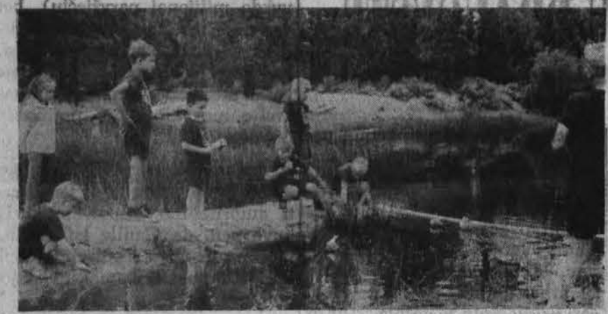
Los Angeles vilkiukai stovykloje išbandė savo gamybos laivelius.