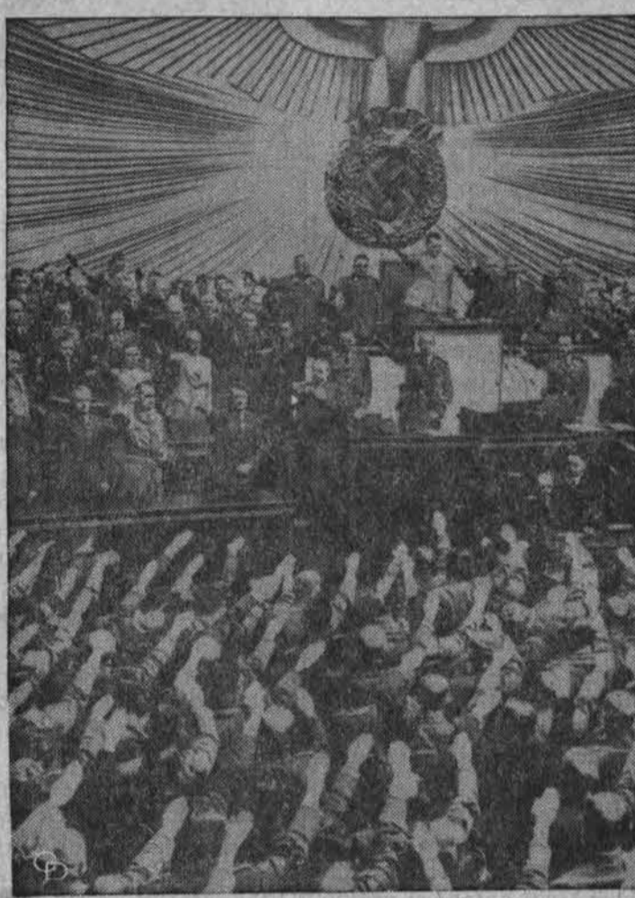
Cia pradėtas II-sis pasaulinis karas. Tai Vokietijos seimo posėdis 1939 m. rugsėjo 1 d. Berlyne. Nuotraukoje matyti Hitleris, Rudolf Hess, kuris vėliau pabėgo į Angliją, maršalas Hermann Goering ir kit aukštieji nacių pareigūnai. Jau trisdešimt metų sukako nuo karo pradžios, kurį nacių įgalino pradėti Hitlerio ir Stalino susitarimas.

MIAMI. — Uraganas Francella, lekiąs 85 myl. per valandą ir grasas nusiaubti Britų Hondurasą ir Meksikos įlanką. Čia audrų per pastaruosius 15 metų buvo užmušta 800 asmenų. Dr. Robert Simpson, oro stebėjimo centro Miami, Fla., vėdėjas, perspėja gyventojus, kad šie būtų pasirėngę sutikti viesulą, einantį 100 mylių per valandą.