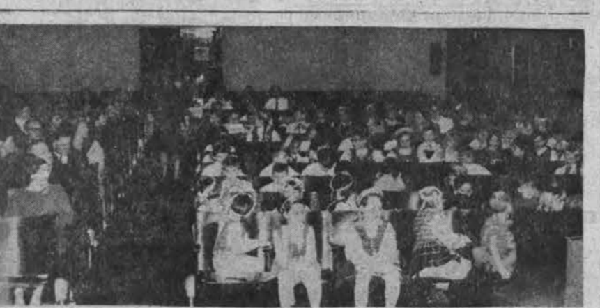
Darius-Girėno liuanistinė mokykla rugs. 6 d. 9 val. ryto Nightingale mokyklos patalpose, 5300 So. Rockwell Ave., pradeda mokslo metus. Registruos mokinius į vaikų darželį ir visus 8 skyrius. Cia matome dalį mokinių su mokytojais ir tėvais.