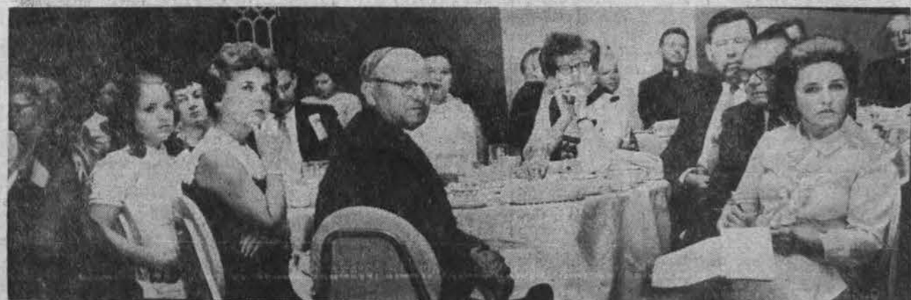
Iš Lietuvos vyčių 56 seimo banketo. Rimti veidai liudija, kad suvažiavimas buvo įspūdingas.

HOURS: Mon. 12 P.M. to 8 P.M., Tues. 9 to 4, Thurs. & Fri. 9 to 8, Sat. 9 to 12:30