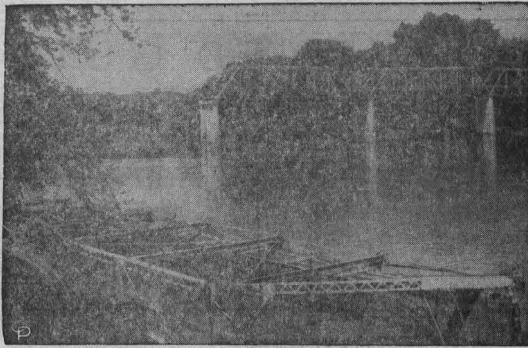
Uraganas Camille padaręs daugybę nuostolių, sugriovė ir tiltą per Rivannos upę prie Palmyros, Va.