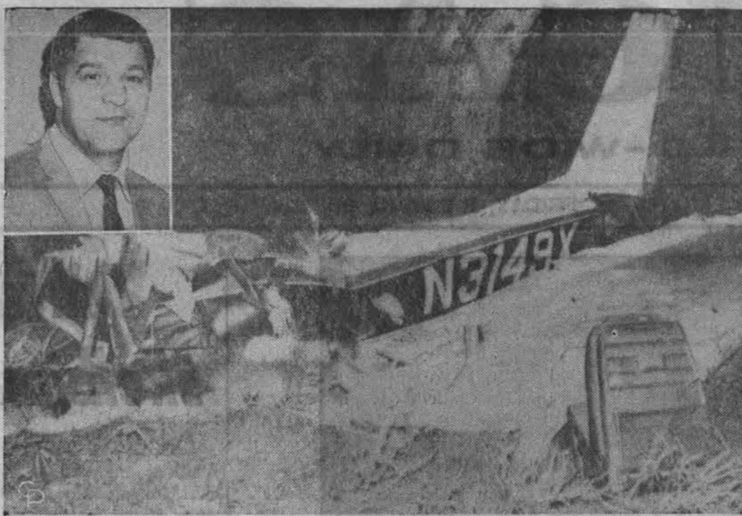
Boksininkas Rock Marciano (viršų kairėje), buvęs pasaulio bokso sunkiausio svorio čempionas, nukritus lėktuvui, užsimušo. Drauge su juo skridę du asmenys, jų tarpe ir pilotas, taip pat rasti negyvi.