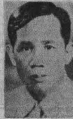
Le Duan, pirmoj vietoj po S. Vietnamo diktatoriaus mirties

Hanoi radijas paskelbė, kad kraštui vadovaus 26 asmenų komitetas, kuriam vadovaus Šiaurės Vietnamo komunistų partijos pirmasis sekretorius prusiškias Le Duan. Antruoju būtu viceprezidentas Ton Duc Thang, jau 81 metų amžiaus. Trečiuoju savo svarbumu eitu prokinietiškos politikos Truong Chinh ir ketvirtuoju min. pirm. Pham Van Dong. Gen. Giap,