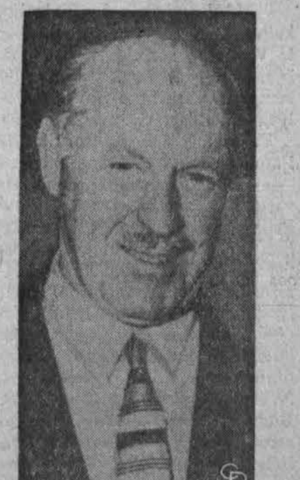
Drew Pearson, žinomas amerikietis kolumnistas, mirė slaukęs 71 m. po ligos, kuri jį ištiko jo ūkyje Potomac. Md. Buvo labai žinomas žurnalistas.

— Honduro ir El Salvadoro valstybės vėl galį pradėti kariauti. Abi viena kita kaltina taikos susitarimų pažeidimais.