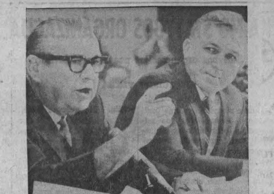
Ohio gubernatorius James Rhodes (k.) ir Indianos gub. E. D. Whitecomb tarsi gubernatorių konferencijos metu Colorado Springs, Co.

Tačiau Rumunijos vadai įsisa- mavimo, kad prez. Nixono pasiūlymas buvo dabar ar niekad. Jie sutiko, pranešdami Maskvai tik po to, kai buvo priimtas nutarimas, ir jie laikėsi kietai, nepaisant, kad rusų trejūnė vizitas buvo atšauktas, ir sutarčių pasirašymas buvo atidėtas neribotam laikui. Jie dviem dienom nukėlė kompartijos kongreso atidarymą. Jie norėjo Nixono vizitą laikyti šalta ir nerzinti rusų vadų, o taip pat nesukelti per daug pavydo pas "mažiau laimingus" kitus komunisti- nius kraštus, kurių Amerikos preziden- tas nepasisiūlė atlankyti. Galiausiai, jei negalėjo ar nenorėjo priešintis tautos spaudimui. Jie davė Bukarešto gy-