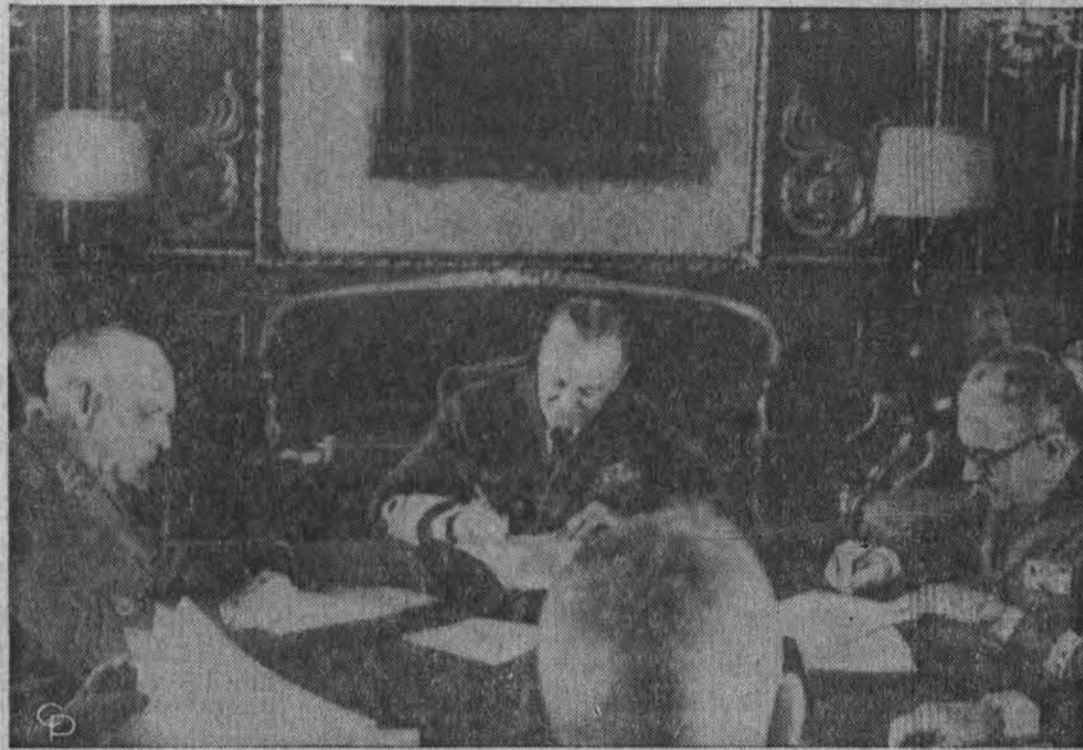
Rio De Janeiro posėdžiauja naujoji Brazilijos valdžia, kuri užgrobė valdžią, susirgus buvusiam prezidentui Arthur da Costa e Silva. Iš k. į d.: gen Aurelio Lira Tavares, adm. Augusto Rademaker Grunewald ir maršalas Marcio de Souza e Mello. Tai yra sausumos laivyno ir oro pajėgų vadai.

Rugsėjo 5 d.: šv. Laurynas, šv. Obdulija, Erdenis, Dinga. Rugsėjo 6 d.: šv. Faustas, šv. Bega, Vaištautas, Skuda. Saulė teka 6:19, leidžias 7:19. Oras Chicagoje ir apylinkėse, oro biuro pranešimu, šiandien, šilta ir tvanku. Galimas lietus. Temperatūra apie 80 l.