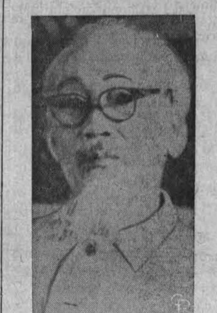
Mirus Šiaurės Vietnamo diktatorius Ho Chi Minh

I diktatoriaus laidotuves suplaukia beveik visi didieji ko-