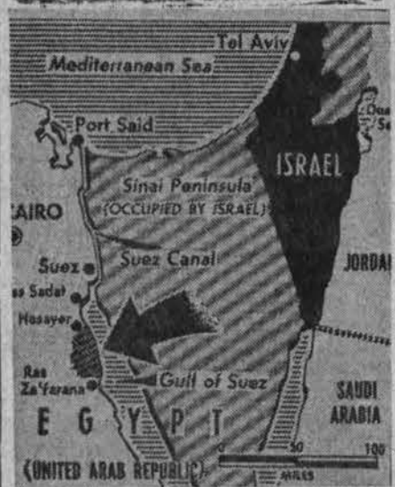
Žydai Suezio kanalą, puldami Egiptą, perėjo prie El Hasayer miesto, pažymėta strėle.

JERUZALĖ. — Izraelio puolimai, kurio metu Egipte žuvo lygi 150 asmenų, gali priartinti žydų ir arabų karą. Žydų puolimas buvo didžiausias nuo 1967 metų ir Izraelio min. pirm. Golda Meier patikino, kad toks puolimas yra tik parodymas, kad už kiekvieną puolimą arabams bus atkeršyta. Šis puolimas buvo po arabų kraštų, Egipto,