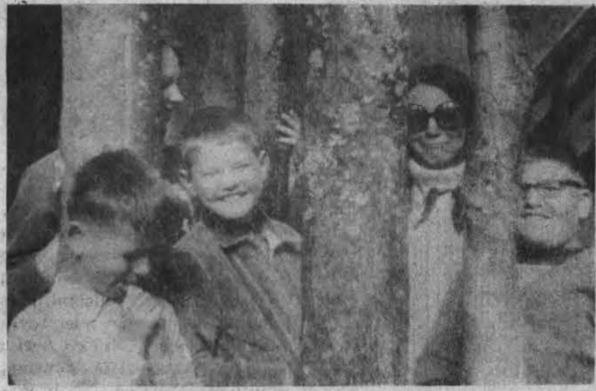
Skandžių ir linksnų momentų buvo šios vasaros moksleivių ateitininkų stovykloje. Vieni išvažiavo į Stratfordą, kitus paliko...

sglygose lietuvių kalba neturi aplinkos, todėl ji turėtų pirmą kartą įsitvirtinti vaike. Galį šeima lietuviškai kalbėti, bet per televiziją ir kitokią aplinką vaikas išmoka vietinės kalbos, dar neidamas į mokyklą.