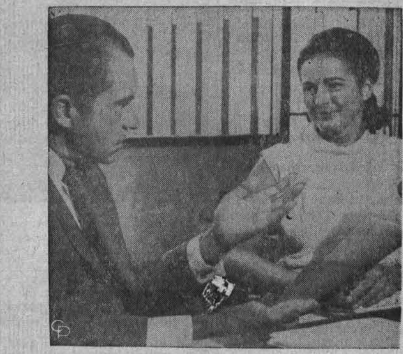
Prez. Nixonas kalbasi su Nancy Hanks, po to kai ją paskyrė krašto meno reikalų vedėja. Ši įstaiga rūpinsis krašto meno reikalais.