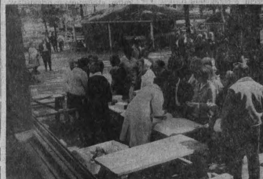
Šv. Antano parapijos pilnikas Detroito prie dovanų išdalijimo stalo. Kitas pilnikas įvyks rugsėjo 14 d. New Liberty parke.

Pereinamąją taurę ir šiais metais (antrą kartą) laimėjo torontiečiai, nugalėjo detroitiečius (St. Butkaus kp. šaulius) 187 taškų persvara. Torontiečių pergalė tuo nepasibaigė, — jie laimėjo dar 10 taurių. Be to, teisėjų komisija torontiečius, kurie išmūšė po 500 kliudymų iš 600 gali-