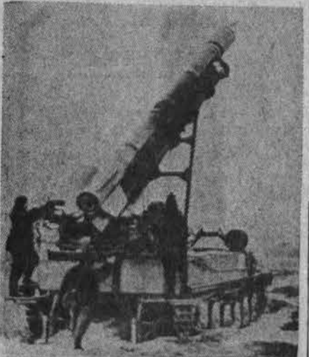
Sovietų raketos nukreipiamos prieš kiniečius

Washingtonas. — Aštrus žodžių karas tarp Kinijos ir Sov. Rusijos grėšia išvirsti ir karštąjį karą. Abi pusės tam ruošiasi ir pasak vėliausio "U. S. News and World Report" žurnalo, toks karas jau galimas. Sov. Rusija palei visą sieną veda karinius sustiprinimus, ypač raketiniuose postuose į kom. Kiniją, ir paruošiami paprasti ir atominiai ginklai. Maskva taip pat prieš savo buvusįjį sąjungininką veda didelę kampaniją, nuolat kalbėdama Rusijos žmonėms, kad šandien komunistinė Kinija graso jų saugumui. Sovietijos diplomatai stengiasi pateisinti būsima susirėmimą, o taip stengiasi, kad JAV nebūtų karo atveju Kinijos sąjungininkė.