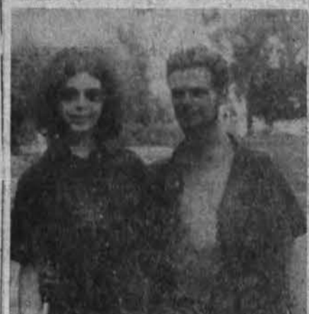
Du hipiški jaunuoliai

Vaikas mėgsta žaidimus, ritmiškus judesius. Žaidimai padeda jam jaugti į grupę, moko būti mandagiu. Bet įvairaus amžiaus vaiko yra skirtingi palinkimai, todėl skirtingi taktiniai ir žaidimai bei kitokie jam taikomi judesiai. Pvz., 4 metų vaikas mėgsta judėti — ir greitai, berniukai lipo laiptais stato pilis, mergaitės pamėgdžioja na-