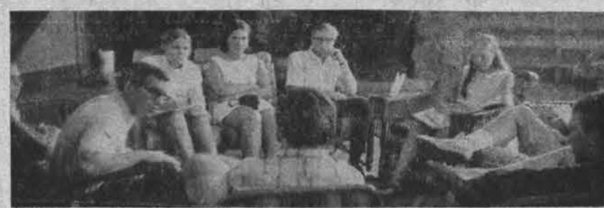
Diskusijų ratelis studentų ateit. s-gos stovykloje Lake Ariel, Pa.

× Chicago At-kų Sendr. balius Ten bus miela ir jauku Ateik ir Tu — Pabūsime kartu Kada? — Spalio 11 d. 8 v. v. Kur? — Argo Memorial Hall — 6050 So. Harlem Ave. Dėl informacijos skambinti Audronej — GR 6-8282. (pr.)