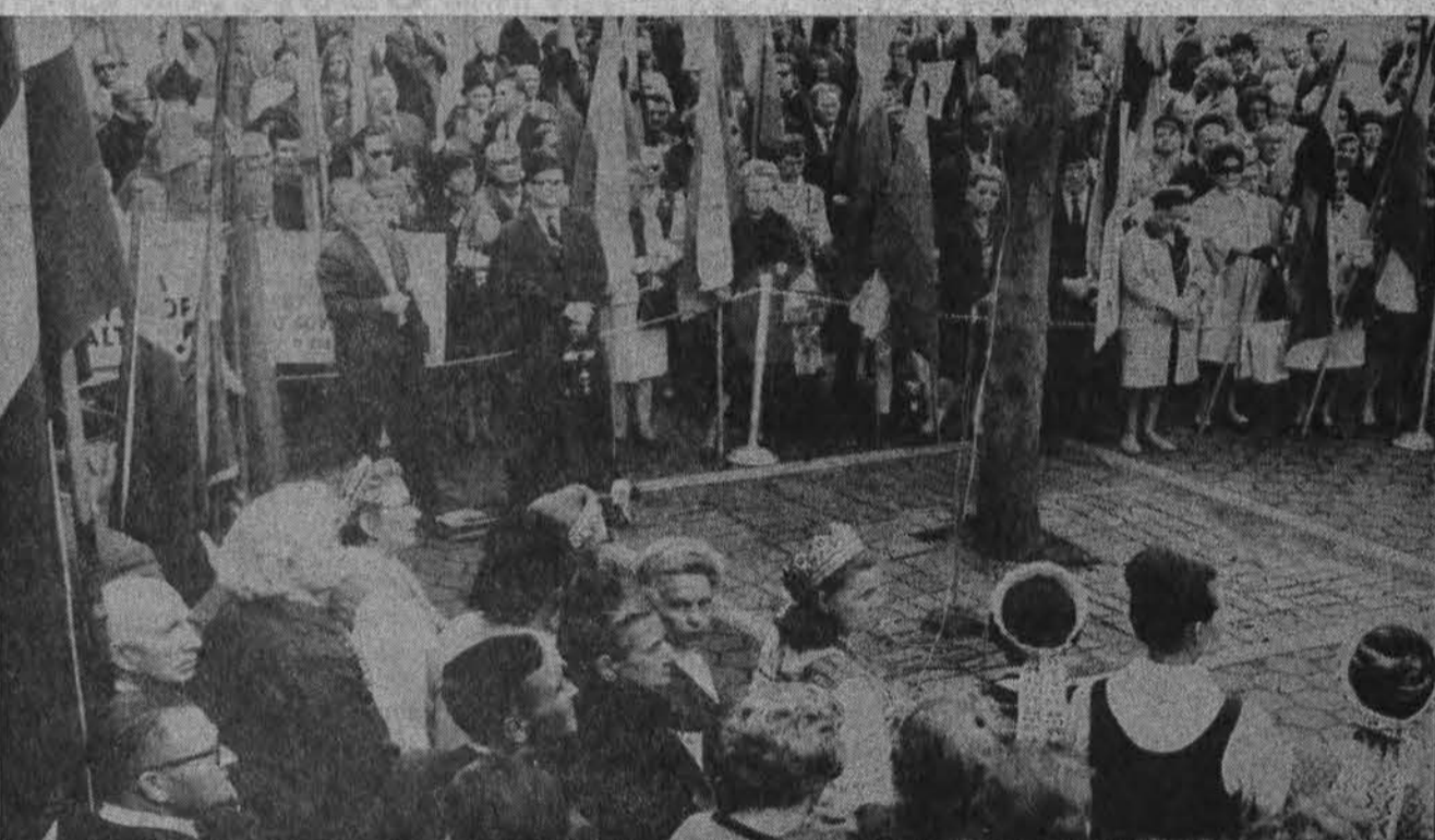
Pabaltiečių protesto demonstracija prie Jungtinių Tautų rūgšėjo 20 d

— Pirma pataisyk gūžtelę, paskutinį pagauk vištelę. (Pušalotiškių patarė).