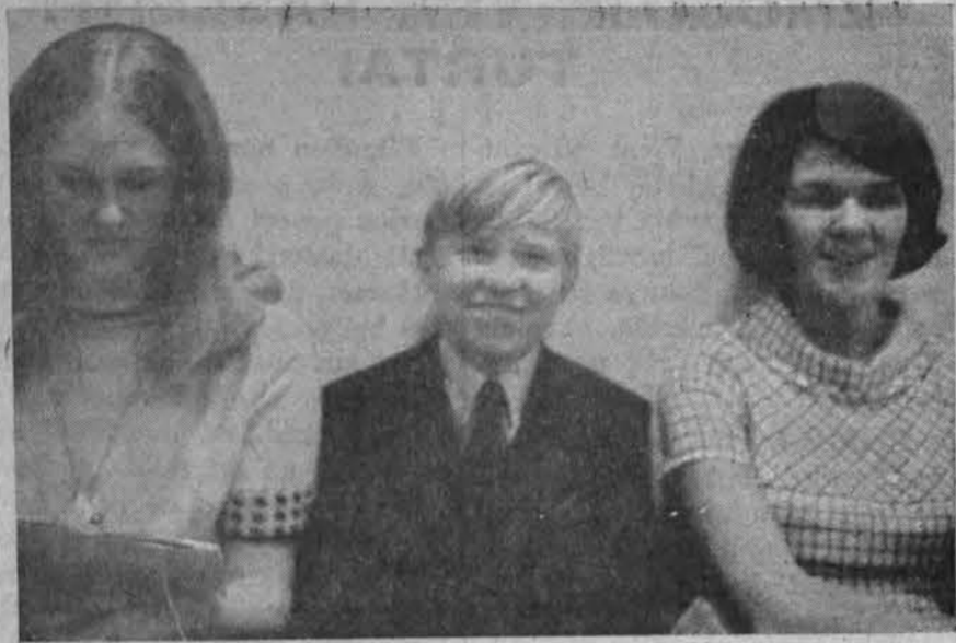
Jauni ir ryškūs lietuviškieji veidai East Chicagos lietuvių kolonijoje.