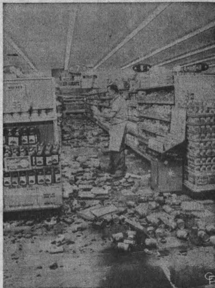
Santa Rosa, Calif., įvyko žemės drebėjimas ir padarė kai kur nuostolių. Čia matyti iš lentynų krautuvėję išbyrėję maisto dėžutės, kurias renka tarnautojai.

TAIPEI, Formosa.— Viena nėsčia moteris ir devyniolika asmenų žuvo, kai komunistinė Kinija apšaudė Matsu salą, kom. Kinijai minint 20 m. komunizmo įsigalėjimo sukaktį.