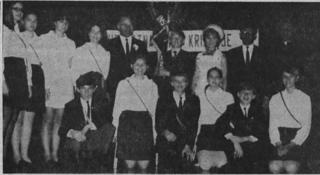
Vysk. P. Brazio moksleivių ateitininkų kuopa, susidedanti iš Waukegano-Kenosos-Racine būreliai.