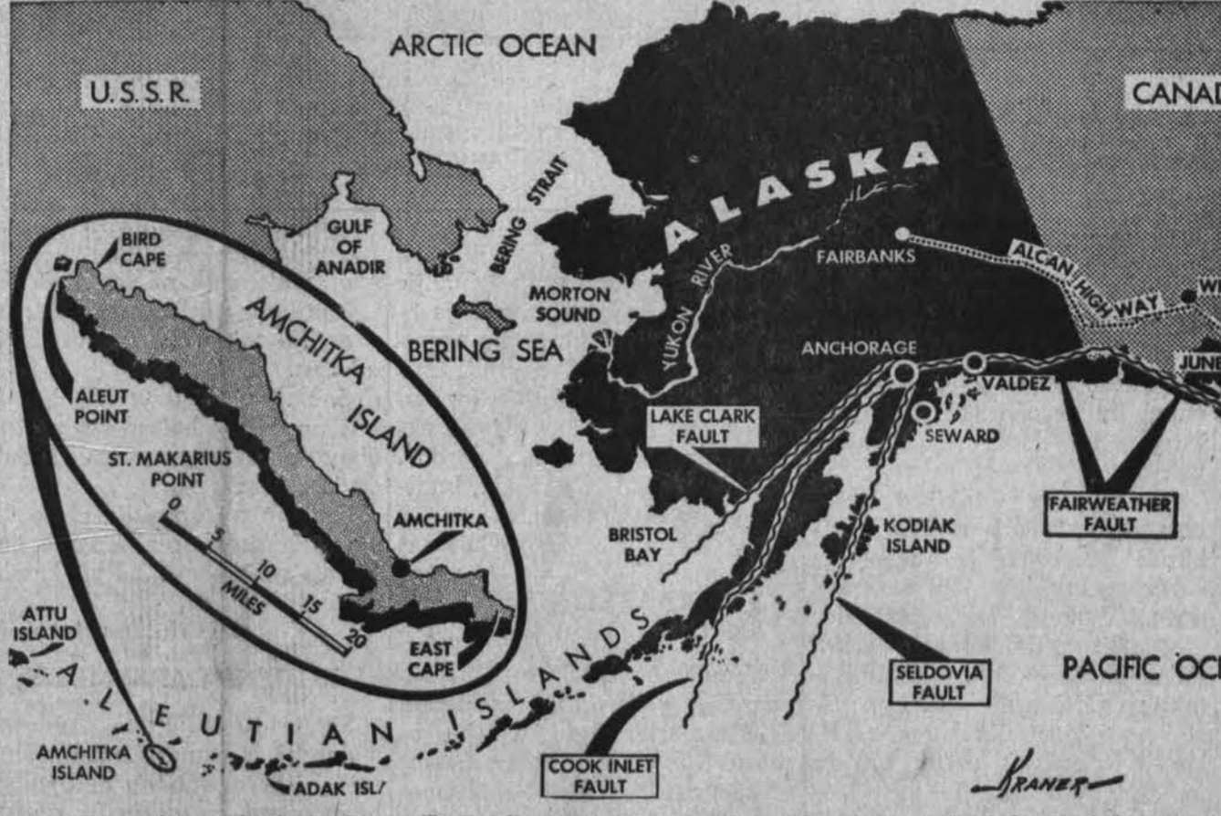
Amchitka salose Aliaskoje buvo išsproginta atominė bomba. Gyventojai ir mokslininkai baiminosi, kad sprogdinimas nesukeltų žemės drebėjimo, tačiau nieko neįvyko. Amerika yra Aleutų salyne įvairių gyvulių ir paukščių prieglobstis, ten prisilaiko ruoniai, arktikos žąsys, amerikietiški ereliai ir kita.