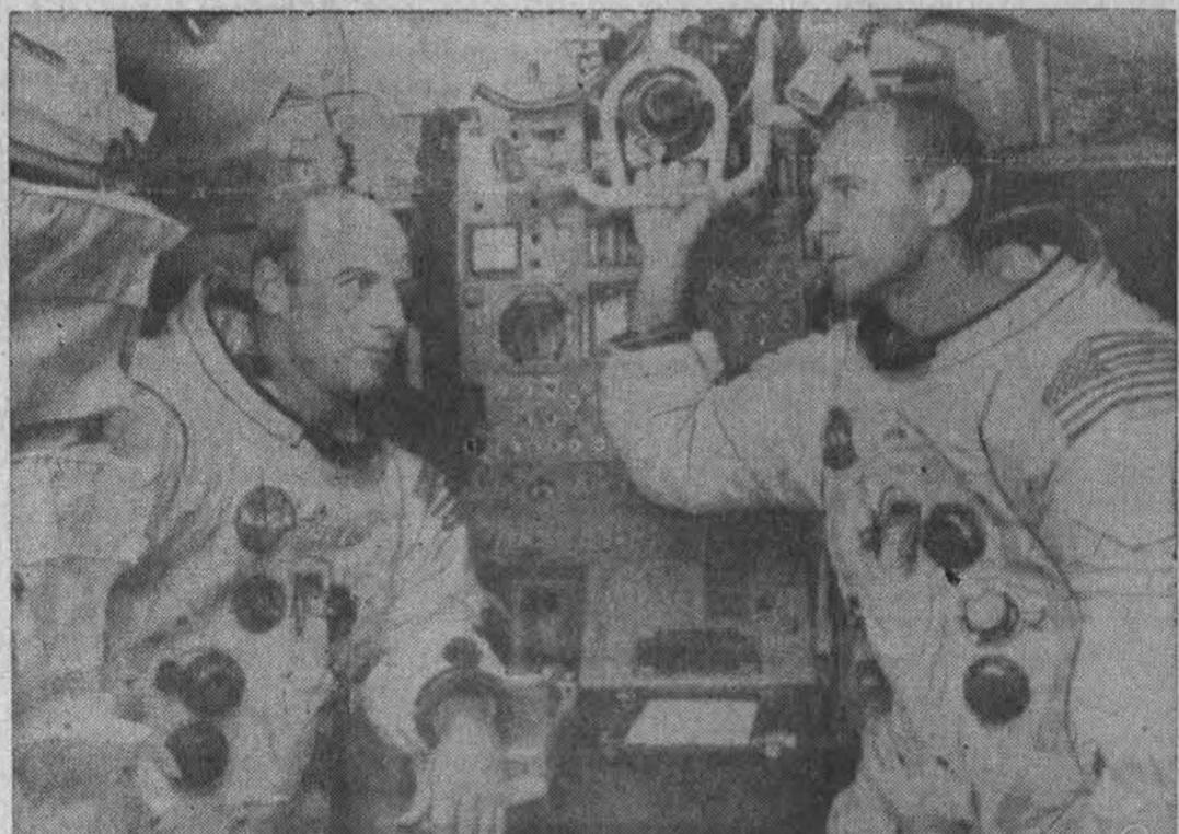
Du astronautai, turintys lapkričio 14 d. pakilęs iš Cape Kennedy, teks nusileisti mėnulio paviršiuje su prietaisais, reikiama "priešininkų" ir šis. Esą tikrinama galis

Oro biuras praneša: Chicagoje ir jos apylinkėse šiandien saulėta, dar šilčiau, temp. sieks 60 ir daugiau l. F., ryt — be pakitimų. Saulė teka 6:20, leidžias 4:09.