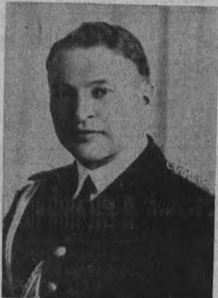
A. a. pulk. B. Svilas