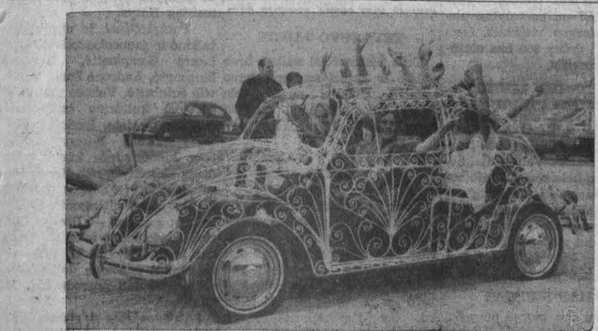
Los Angeles pagamintas automobilis su kiaurom sienom, iš kurio entuziastingai moja jaunuoliai.