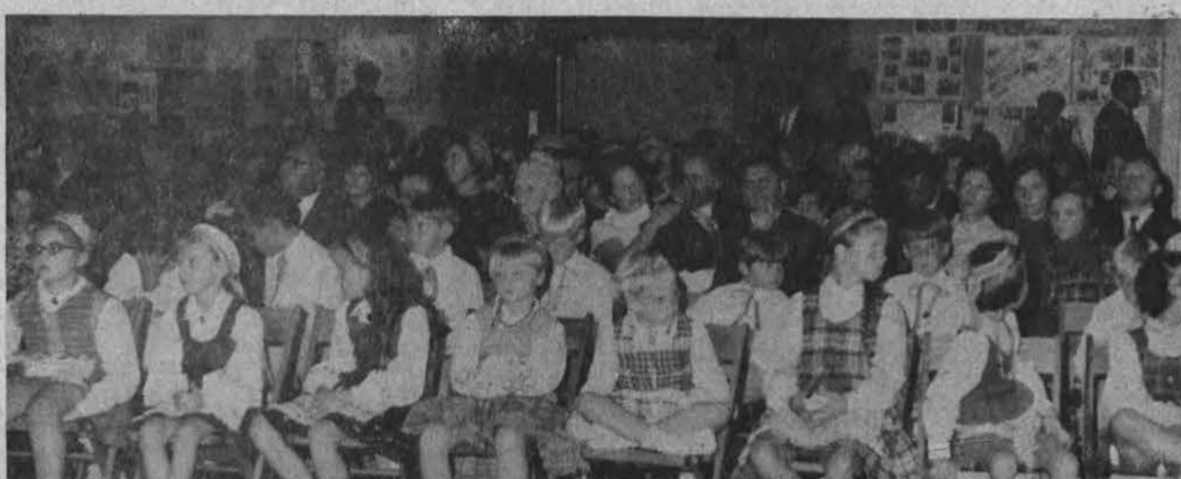
Spalio 12 d. ALB Detroito apylinkės lietuviškos mokyklos iškilmingai užbaigė PLB švietimo tarybos paskelbtų varžybų pirmąjį tarpinį. Nuotraukoje matome kelis (viso buvo 115) laikračių iškarpa rinkinius, dalį užbaigtųjų dalyvių ir prieky sėdinčius ir sėdinčius varžybų laimėtojus ir laimėtojas.

Naujosios bažnyčios statybos reikalai. Klebonijos planai jau perduoti kontraktorių varžybos, bažnyčios planai visiškai baigiami paruošti. Kultūros centro planai irgi sparčiai ruošiami. Visoms statyboms dar trūksta apie 100.000 dolerių, kuriuos padaryti turės sudėti arba rei-