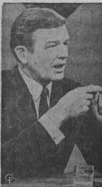
John Lindsay, lapkričio 4 d. perrinktas, ketveriems metams, New Yorko miesto meru. Anksčiau pralaimėjęs respublikonų pirmi-niuose rinkimuose, Lindsay šį kartą iš respublikonų virto "liberalu - nepriklusomuoju"