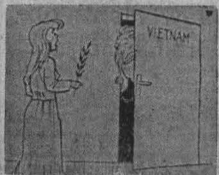
Taika ir Vietnamas