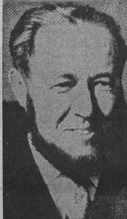
A. Solženicinas, kurio raštai plačiai pasklidę Vakaruose, lapkričio 4 d. pašalintas iš Sovietų Rašytojų sąjungos