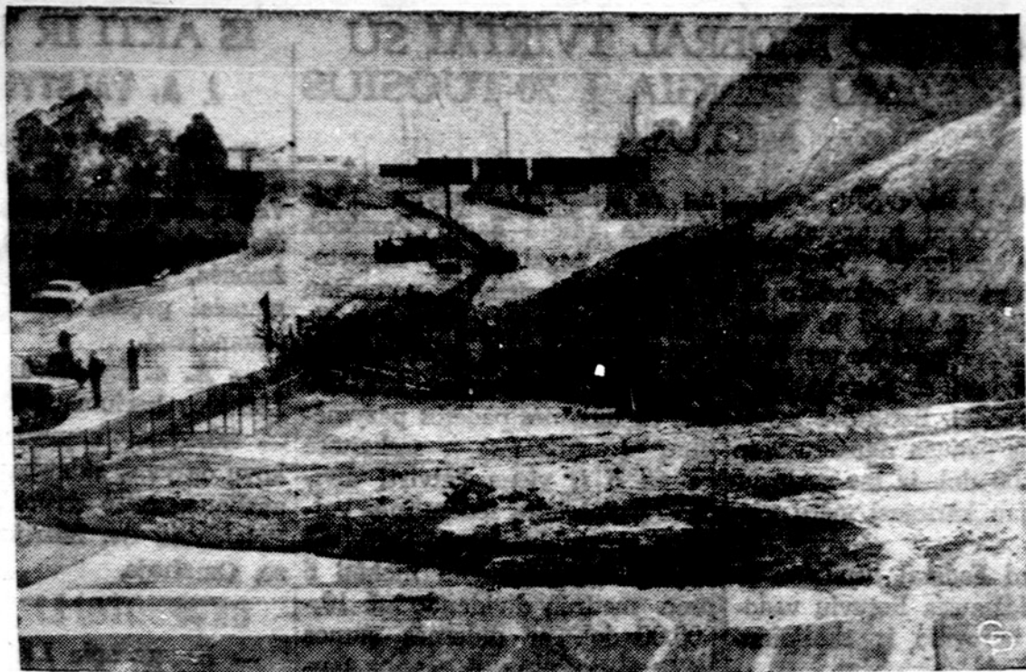
Slenkantis slaitas užvertė kelią netoli Los Angeles esančiame Slysian parke.