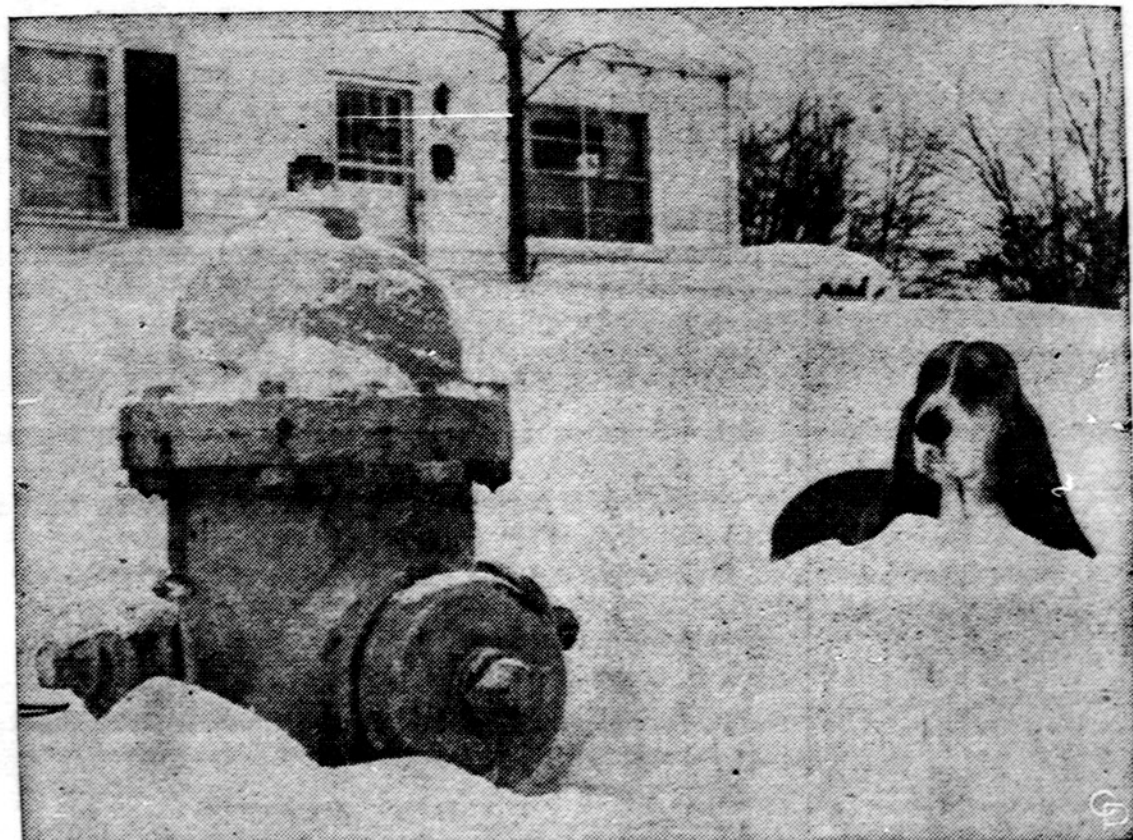
Ir šunys turi savo nepatogumų žiemą.