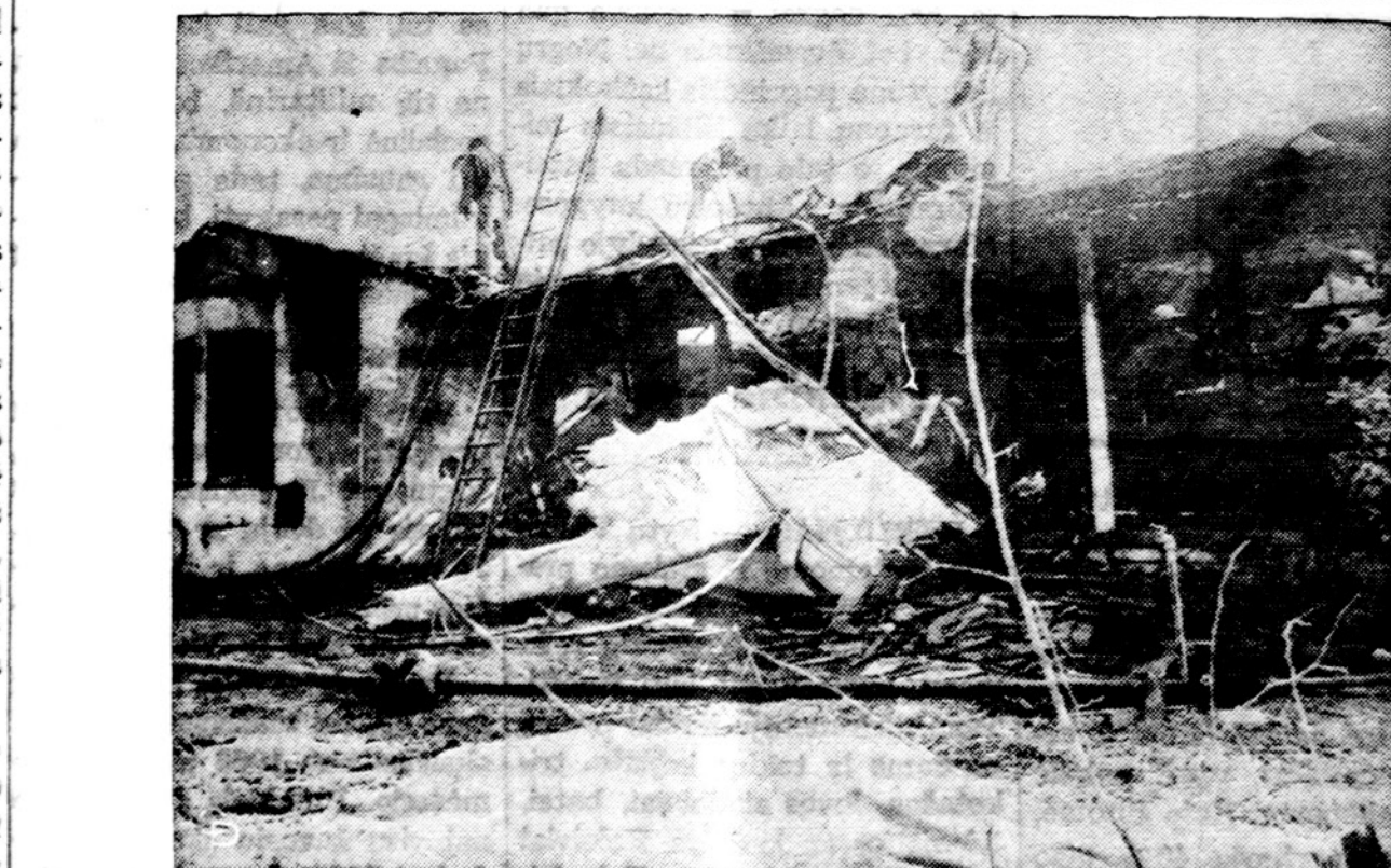
Prie Van Nuys, Kalifornijoje trys asmenys buvo užmušti, kai mažas dvimotorinis lėktuvas nukrito ant vieno namo.