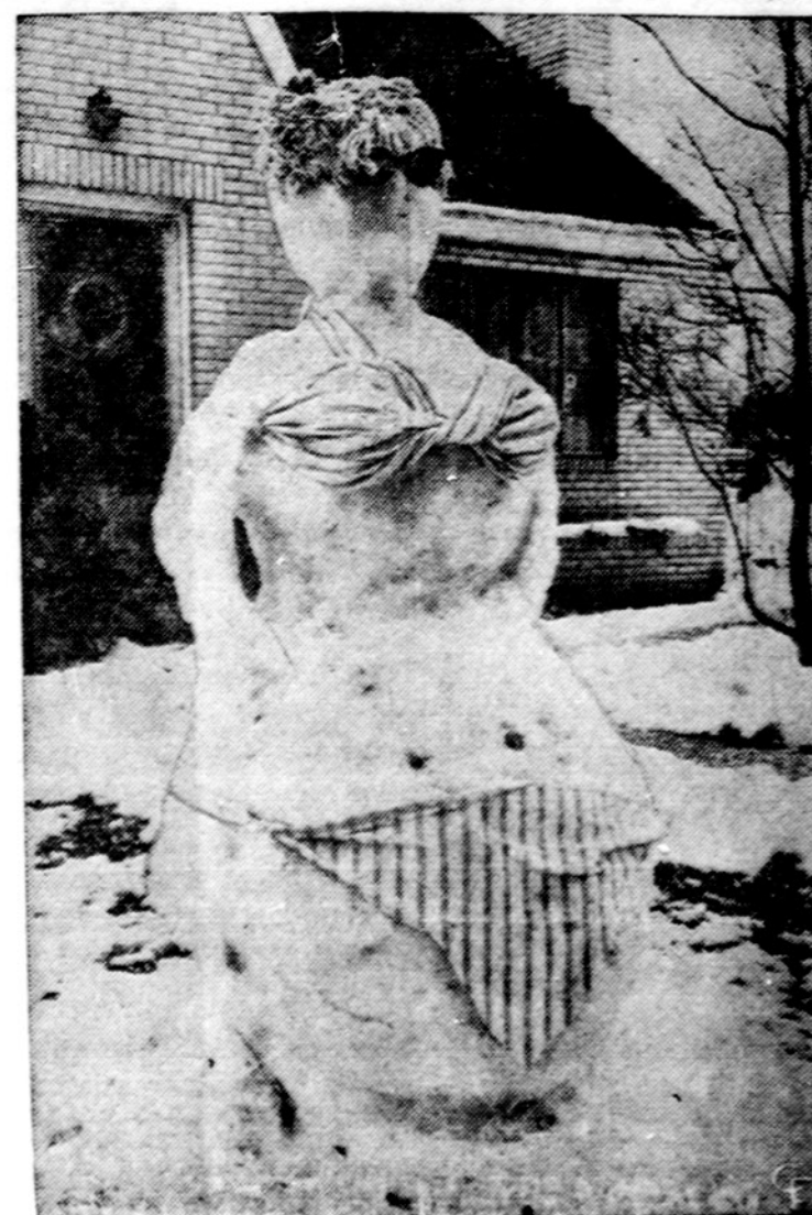
Būna sniego senų vyrų, būna ir senųjų - moterų.

gusių arba esančių Š. Vietnamo nelaisvėje priskaičiuojama 1,356. Nelaisvėje daugiausia numuštų lėktuvų lakūnai.