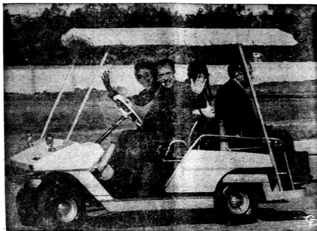
Prezidentas atsiveikino su saulėtąja California ir grįžo į šaltą Washingtoną.