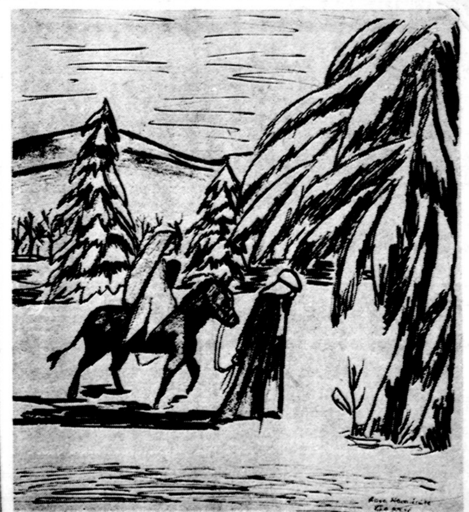
Piešė Rasa Macevičiūtė, Kr. Donelaičio Lituanistikos mokykla