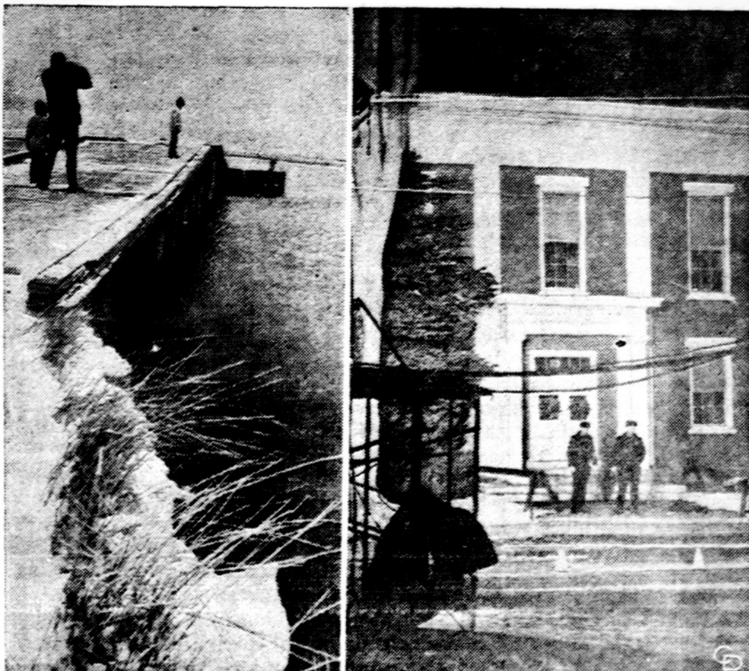
Spaudos žmonių ir fotografų dėmesys sukauptas į tiltą, nuo kurio nukrito Edward Kennedy automobilis ir Dukės apskrities teismo rūmus, kur vyksta apklausinėjimai.

Senatoriaus Edward Kennedy bylos tyrimas, dėl Mary Jo Kopechne nusikandimo, Edgartown teisme eina visą savaitę. Rašant šias žinias tur būt yra paskutinė apklausinėjimo diena. Tai nėra tik-