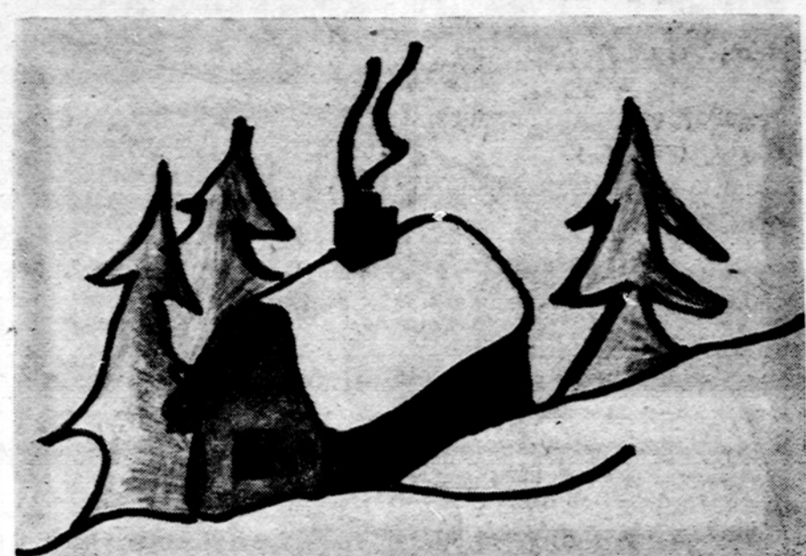
Namas žiema. Piešė Viktorė Jogaitė

Isteigtas Lietuvių Mokytojų S-gos Chicago skyriaus Redaguoja J. Plačas. Medžiagą siūsti: 7045 So. Claremont Avenue, Chicago, Illinois 60636