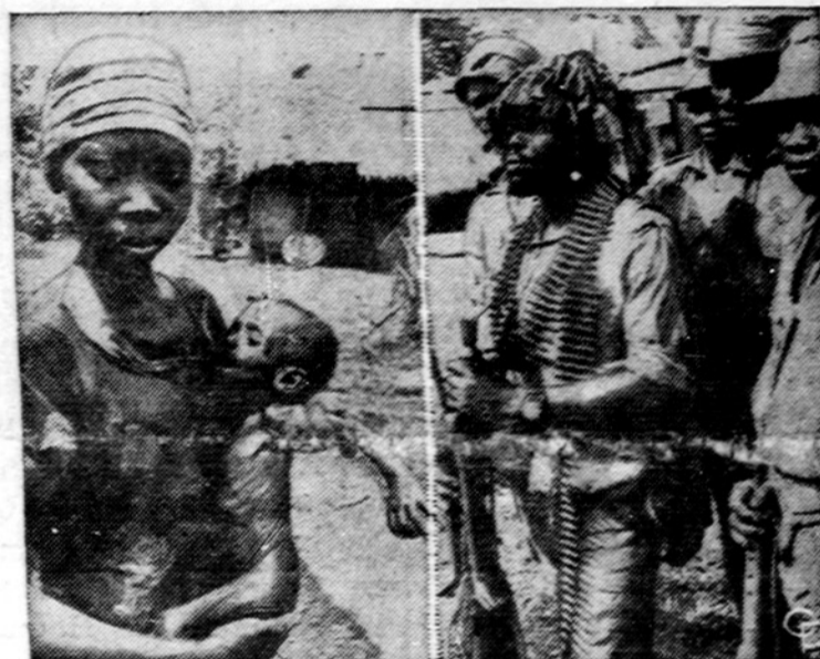
Biafra paskutinėm pasipriešinimo dienom: motina su išbadėjusiu vaiku; pralaimėję kovotojai.