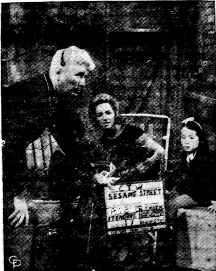
Zuvusio sen. Kennedy našlė Ethel žiūri į paruošimą vaikų televizijos programos Sesame Street. Programa bus perduodama vasario mėnesį. Ethel turi 11 vaikų.