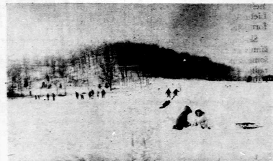
Dašnava stovykla žiemos metu. Čia nuo gruodžio 26 iki sausio 1 d. vyko moksleivių atkų stovykla, o sausio 3-4 d. Detroito jaunieji ir jaunučiai at-kai turėjo savo išvyką. Galia, lietuviai per mažai ja naudojasi ir stovykla žiemos metu, todėl tada ji daugiausia išnuomojama amerikiečiams.

"Sukaktuvinę leidinių" skyrelyje randame, kad šiaja proga PLI išleido du Vaižganto raštų leidinius. Abiejų leidinių redaktorius tas pats, kuris yra