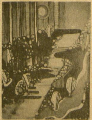
J. Leškienė Pizz.cato (aliejus)