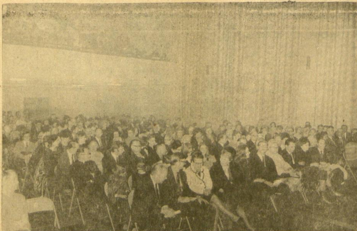
Publika "Penkių stulpų turgaus aikštėje" premjeroje, Jauimo centre, Chicagoje, sausio 17 d.

Vakarietis kritikas, praęs prie originalo kalba dainuojamų operų, rado reikalo pastebėti, kad "nežiūrint sunkumų, išskylančių