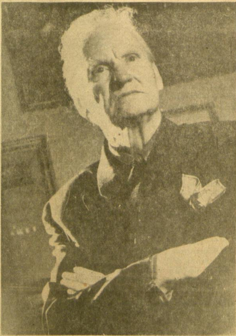
Viena iš paskutiniųjų Kipro Petrausko nuotraukų 1965 m.