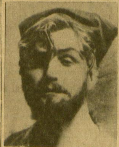
Kipras Petrauskas - Griška "Kitežė" 1936 m.