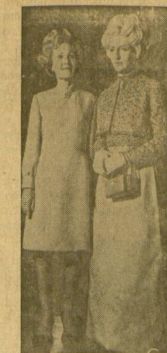
Istorinė vaško figūra. Pat Nixon stovi šalia vaškines figūras, apmokytos jos inauguracijos baltaus suknelės Smithsonian instituto Washingtono, kuriame rodomos visų JAV-bių buv. prezidentų žmonių suknelės.

Visais amžiais žmonės valgė žuvį, ją valgė vargšas ir turtoolis. Tačiau jos vertė gal labiausiai šiandien pripažįstama, kada mityboje daugiau vertinami, proteinais, vitaminais, mineralais, o ne riebalais.