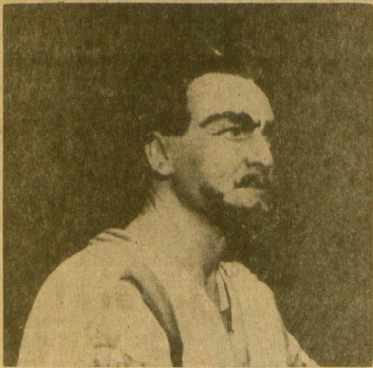
Kipras Petrauskas Otello vaidmenyje 1938 m.

tos. Netgi panaudojus modernią garso filtravimo techniką, tokius įrašus nebeįmanoma pakenčiamai išvalyti nuo pašalinių garsų, tuo pačiu perdau: nesužalojant paties dainininko balso. "Dėl tokių priežasčių atranka savaiame susiaurėjo, o vienu kitu atveju gal buvo pasirinktas ir savotiškas kompromiso kelias: buvo panaudotas ir techniškai mažiau vykęs įrašas, bet vokaliskai įdomesnis.