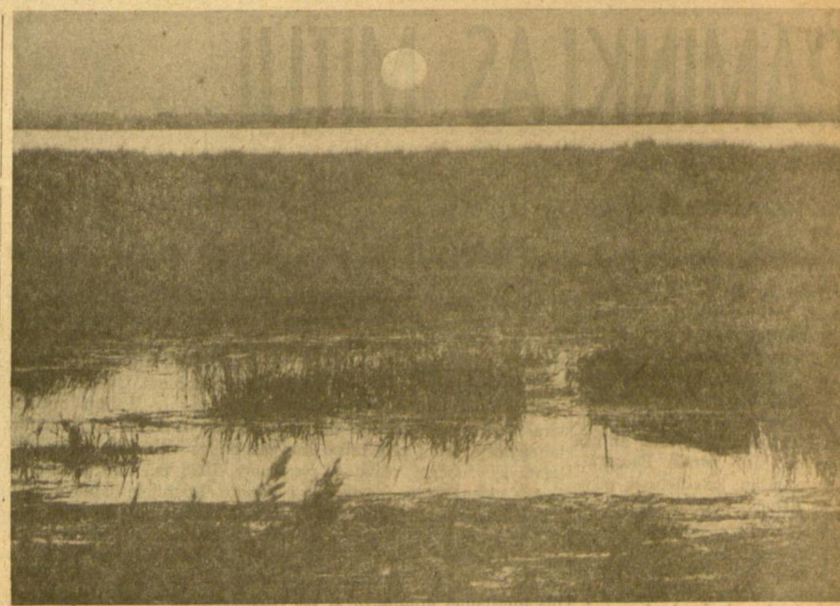
"Saulė patekėjo, ir ežeras skuba jos pasitikti"... (Danguolė Sadūnaitė)

ma vytele (plona šakelė, rykš-telė), ir PLB Valdyba, rūpinda-masi tautinių tradicijų išlaiky-mu, nori atgalvinti gražų Ver-bų paprotį ("Ne aš plaku, ver-ba plaka"). Bet vėlgi, Verbų sek-madienis dar taip toli! Matyti, ir daugiau kas nesuprato to žo-džio, tad sekančiame laikraščio numeryje pakartotame skelbime jau paaškinta, kad tas Vytukes reikia lipinti ant automobilių langų. Aha, dabar tai jau visai aišku. Tai bus, ką mes kasdieni-nėje, "neišeikotoje" kalboje va-