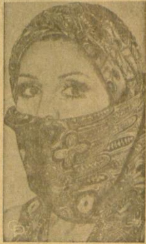
Ir turbanas dabar "maxi". Turbanas, su jarda's pridėtos medžiagos, buvo modeluojamas Amerikos Skrybėlių instituto parodoje New Yorko, rodant pavasarinius kūrinius. Šilko turbanas, sukurtas Brookfair, gali būti dėvimas, kaip čia matome, dvejopu būdu.