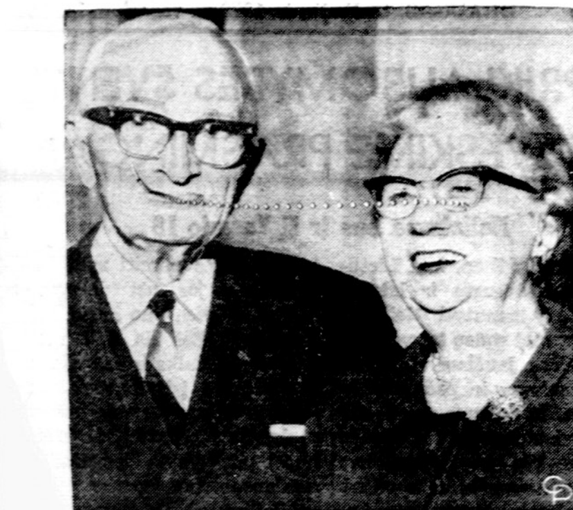
Buvusio prez. Trumano žmona vasarib 13 šventia savo gimimo 85 m. sukaktį ir sakosi ją praleis paprastai kaip ir kiekvieną dieną. Buvęs prez. Harry Truman yra taip pat 85 m. Gyvena Independence, Mo. Ši nuotrauka darota 1969 m.

Daug narkotikų iš Artimųjų Rytų į Vidurio Europą atveža svetimšaliai darbininkai. Darbininkų judėjimas tarp Artimųjų Rytų ir Vidurio Europos yra gana didelis. Vienas turkas sunkvežimiu mėgino į Prancū-