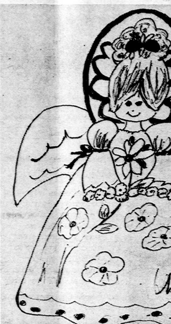
Laisvės angelas. Piešė Zivilė Brakauskaitė

Isteigtas Lietuvių Mokytojų S-gos Chicago's skyriaus Redaguoja J. Plačas. Medžiagą siųsti: 7045 So. Claremont Avenue, Chicago, Illinois 60636