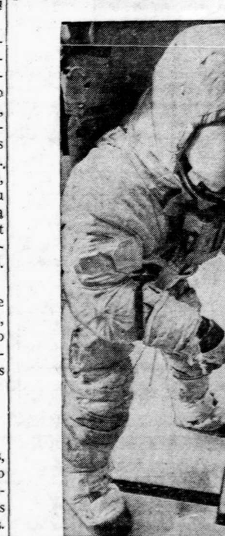
Astronautas Fred W. Haise praktikuojasi su gręžimo mašina. Taip jam reikės gręžti mėnulio paviršiuje iki 10 pėdų gylis ir iš ten paaimti medžiagų pavyzdžių.

Pagyrė Nixoną Humphrey giria Nixoną už jo užsienio politiką, bet turi ką prikišti dėl vidaus reikalų. Nixonas daug ką nudelsia, atidėliojas.