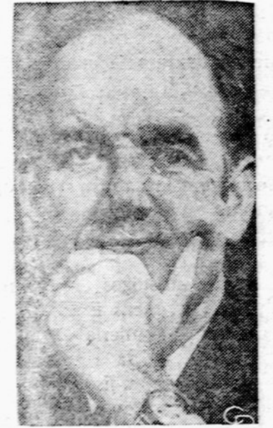
Sen. George McGovern teigia, kad Amerika apie 300.000 vyrų turės vietnamiečių laikyti 15 ar dvidešimt metų.

DENVER, Colorado. — Padėta bomba garaže susprogdino 22 mokyklinius autobusus. Nuo stolių apie pusė milijono dolerių.