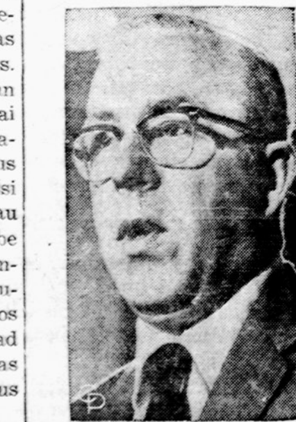
Darbo sekret, George Shultz skelbia, kad gėdinkėlių streikas ligi vasario 21 anuntatomas.

LB anjūnija ir organizuota ir organizacijom nepriklausanti lietuvių. Tad jos rėmuose yra