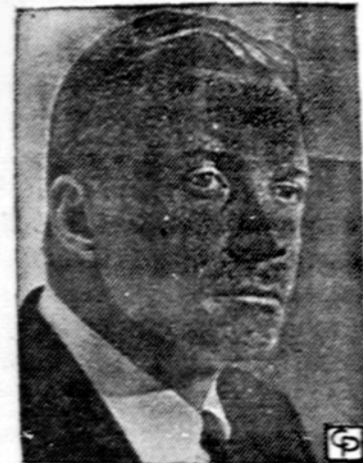
Charles H. Percy

"Tie dalykai turi būti skelbiami ir žinomi plačiai visam pasauliui, visi turi žinoti, kad Lietuva vis dar neša sunkią našą."