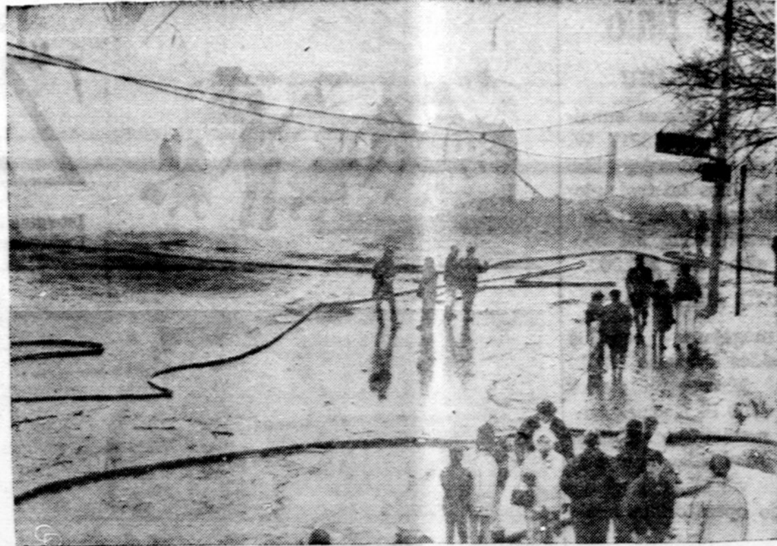
Swanton, Vt. ugnis sunaikino 16 įvairių pastatų. Paliko 15 šeimų be pastogės. Miestelis turi 3.500 gyventojų.