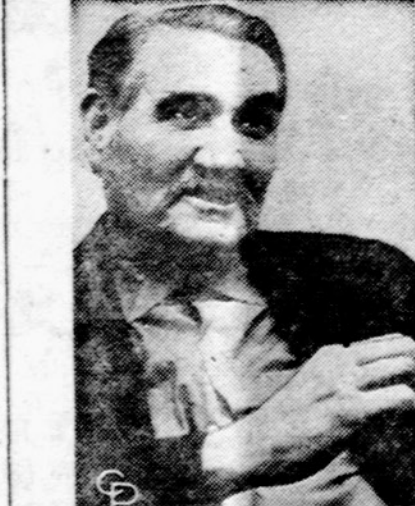
James Folsom, 62 m. buvęs du kartus Alabamos gubernatorium. Vėl kandidatuos gegužės 5 d. įvykstančiuose pirminiuose rinkimuose.