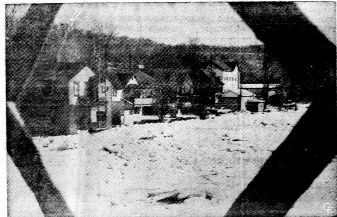
Allegheny upė Parker miesteliui, Pennsylvania, jau rodo savo pavasarišką galybę.