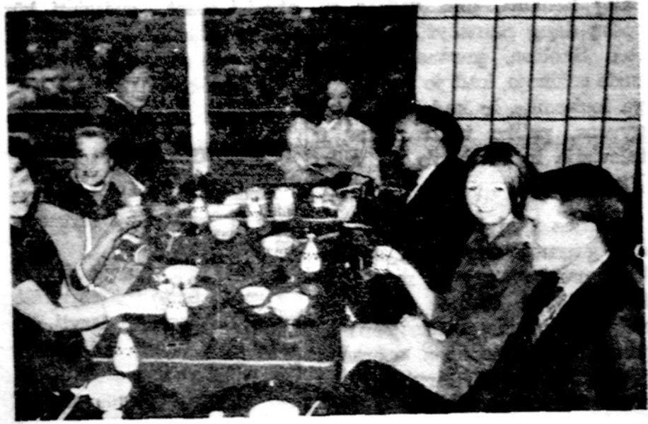
Lietuviai gardžiuojasi "sukiyaki" ir "sake" dviejų japonų patarnaujami.