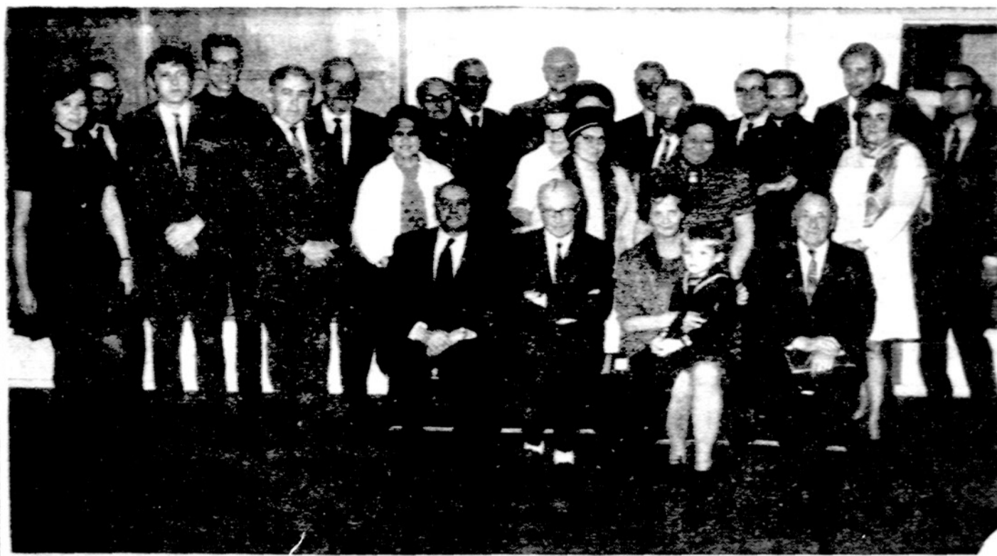
Ekumeninio maldos vakaro sausio 25 d. Chicagoje dalyvių būrelis po kavutės.

rianius klausimus, kaip sakant, Marijos garbinimas ir popiežiaus vieta Bažnyčioje.