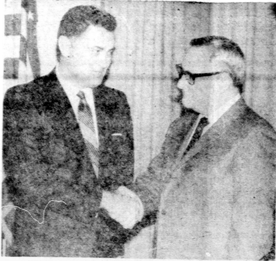
lnž. V. Adamkus (k.) ir Illinois valst. gub. R. Ogilvie

Montini atsidėjęs išklaušė mū-sų prašymus, nors jie užsities il-gokai. Nė vienu žodžiu nebuvo nutraukęs delegacijos kalbos, kaip darė Tardini. Jo atsakymai buvo labai nuosirdūs ir atvirai. Jis pripažino, kad Vatikanas ne-