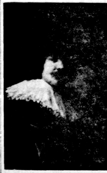
Vyras. Rembrandto tapyba