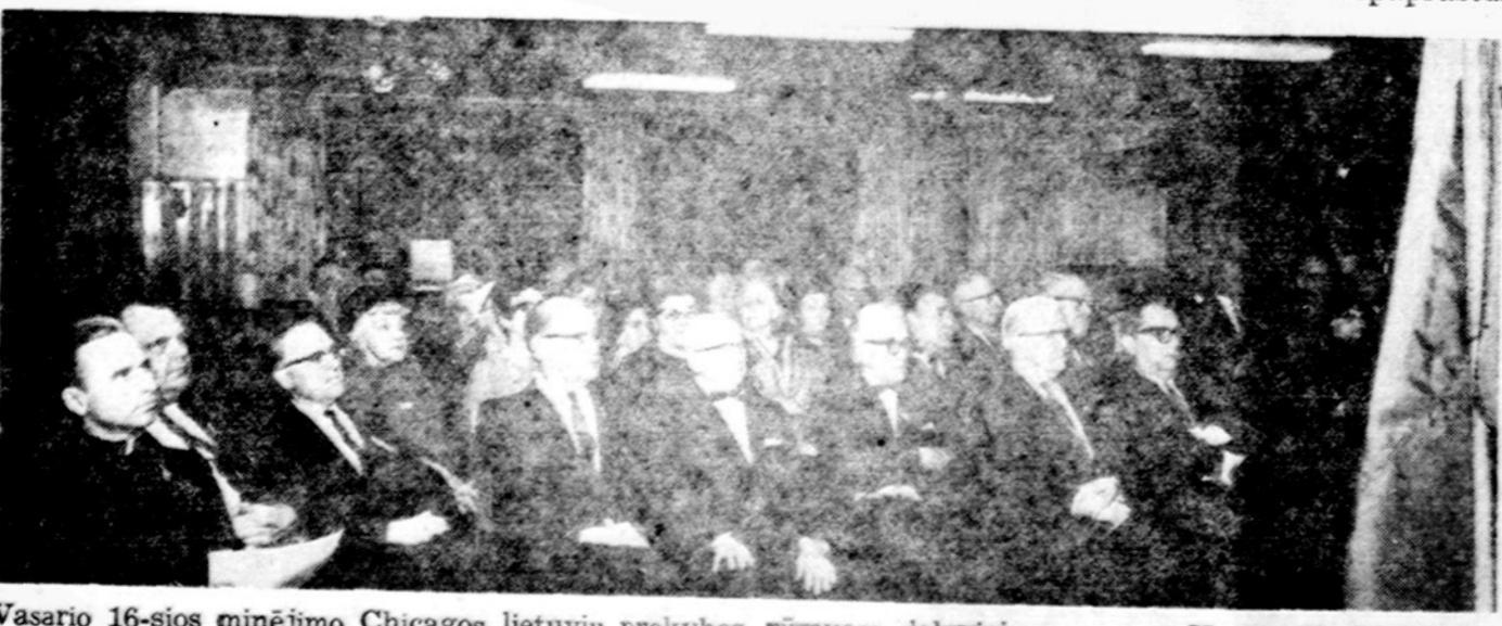
Vasario 16-sios minėjimo Chicago lietuvių prekybos rūmuose dalyviai.