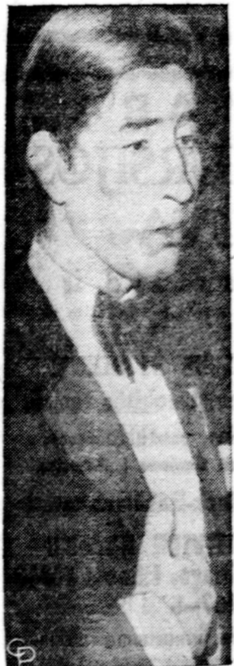
Britanijos princas Charles priimtas į lordų rūmus.