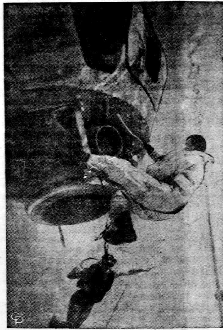
Astronautas Fred W. Haise Jr. treniruojasi Apollo 13 skridimui mėnuli. Skridimas numatytas balandžio mėnesį.

NEW YORK. — Skelbimai laikraščiuose apie darbo pasiūlymą sausio mėnesį Amerikoje smarkiai sumažėjo. Mažėjimas pastebimas ketvirtas mėnuo iš eilės. Darbininkų ieškojimų skelbimas yra tam tikras ūkinis barometras, vadinamas, darbas po truputį mažėja.