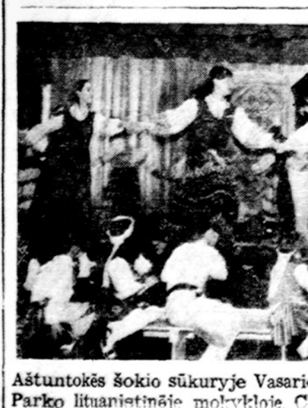
Aštuntokės šokio stikuryje Vasario 16-tosios minėjimo metu Marquette Parko lituanistinėje mokykloje Chicagoje.