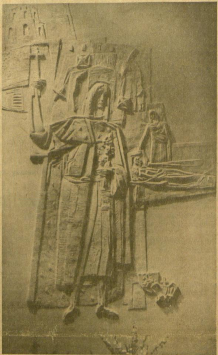
V. K. Jonynas Sv. Kazimieras — Worcesterio lietuvių bažnyčioj

Ir mūsų pačių tarpe jaučiama kartais lyg nuovargio, lyg apsi-pratimo, lyg rankų nuleidimo nuotaikų pradžia. Ir mūsų pa-čių, laisvųjų lietuvių, vienybė irgi kartais pradeda lyg plyšinėti ir trūkinėti. Dėl paties didžiojo tikslo mes, atrodo, visi dar lyg sutariame: visi siekiame laisvos lietuvių tautos savo laisvoje, suve-reninėje valstybėje. Pradedame kartais erzintis ir skirtis dėl pa-čių darbo būdų. Yra atsiradusių tokių mūsų tarpe, kurie lyg no-rėtų eiti tam tikrais vingiais, ki-ti, linkę net vartoti valenrodiškus