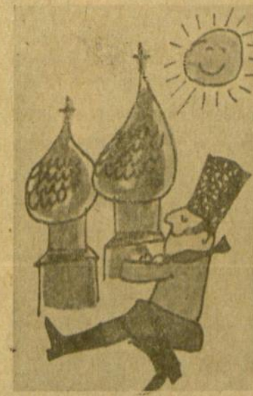
Šokis pagal politruko botagėlį.

Taip sakant, verta žvilgtelti iš naujo į tos vargšės nuskriaustosią sielą. Negali gi nutylėti, kai poetė apie laisvos Lietuvos spau-