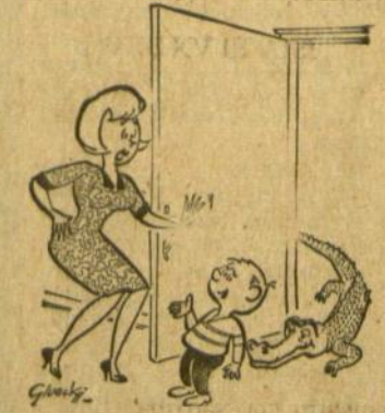
— Mamyt, nebijok, tas žvėrelis nepiktas, žiūrėk kaip plačiai šypso!

Žmogus, kuris tik kalba ir kalba, yra boba.