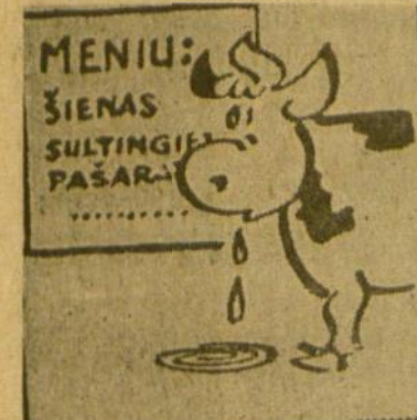
Karvė ašaroja, žiūrėdama į skirtumą tarp plano ir tikrovės. (Vals tiečių laikraščio piešinys).

"Labai rūpinasi gyvūnais šakių rajono "Šviesos" kolūkie galvijų fermos darbuotojai. Prie