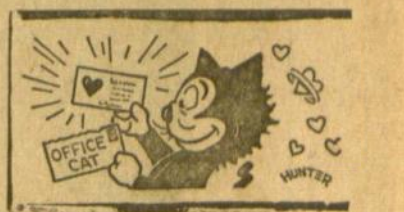
Storieji ir plonieji

Vienas Amerikos aktorių pradėjo viešą kampaniją, norėdamas sugrąžinti gerą vardą storuliams.