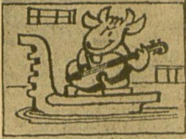
Tarybinė karvė su gitara lietuviškoj Venecijojej.

Nepaisydamas šalčio, greitai atsidiuru toje Vorėnų kolūkie karvių fermoje. Ir tikrai, jeigu būčiau pašaipūnas, pasakyčiau, kad čia nedaug trūksta, jog karvės pradėtų laiveliais plaukioti.