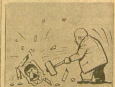
Šaunusis humoristas Chruščiovas į šipulius skaldo S. Neris apdai nuotąją saulę.

Taigi bolševikinis kelias, kaip ten kokių amerikiečių vedamas Highway, greitkelis, einas kur tik papuola, kai reikia nugriaua namus ir bažnyčias. Ką tu pasakysi, tiesiog amerikonišką techniką jau tada poetė įsisavino.