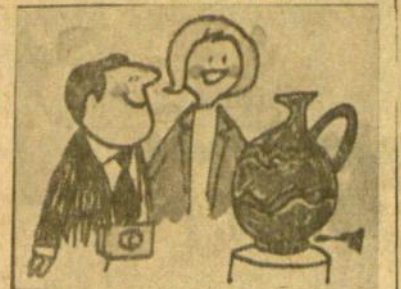
Arbata ar alus?

Tiesiog bausis moterų teisų pažeidimas, kada vyrai geria alų, jos turi gerti vandenį.