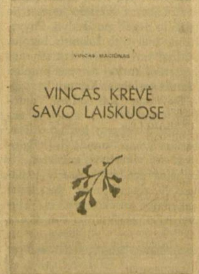
VINCAS KRĖVĖ SAVO LAIŠKUOSE

"Tautų šventovėse" iš kitų pa- našaus žanro knygų skirias tuo, kad autorius, kaip dvasiškis, per pasaulį keliauvo kunigo — pil- grimo keliais, pasiryžęs aplanky- ti katalikams brangias šventai- sias vietas: Jeruzalę, Romą, Liur- dą ir Fatimą bei kitas žymiąsias įvairių tautų šventoves, kuriose aidai praėjusių amžių žingsniai ir maldos.