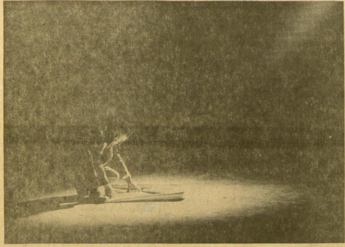
K. Daugėla Lietuvių foto archyvo konkurse antrąją vietą laimėjusi nuotrauka.

fotografu K. Izokaičio ir L.F.A. konkursų vedėjo A. Grigaičio, nors savo posėdį pradėjo anksti vakare, bet jį užbaigė tik rytą su aušra. Ne tik meninis lygis, bet ir techniniai darbu apipavidalinimas, su mažomis išimtimis, buvo gana geros vertės. Tačiau, palyginus su tarptautiniais foto konkursais, teko pasigesti tematikos įvairumo bei įvairesnių nuotraukos apipavidalinimo būdų. Populiariausia tema buvo gamtovaizdis, įskaitant ir gamtines miniatiūras. Antrą vietą gausmu užėmė portretas. Portretai tačiau buvo gan žemo meninio lygio, ir todėl nei vienas jų nebuvo premijuotas. Teko pasigesti išraiškos portretu, kur veido išraišką atspindėtų momento nuotaika ir žmogaus charakteris. Ne buvo taip pat judesio, veiksmo nuotrauka.