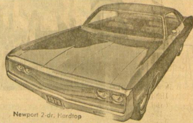
Newport 2-dr. Hardtop

Kaina nuo $2,995.00 NEWPORT — 300 — NEW YORKER