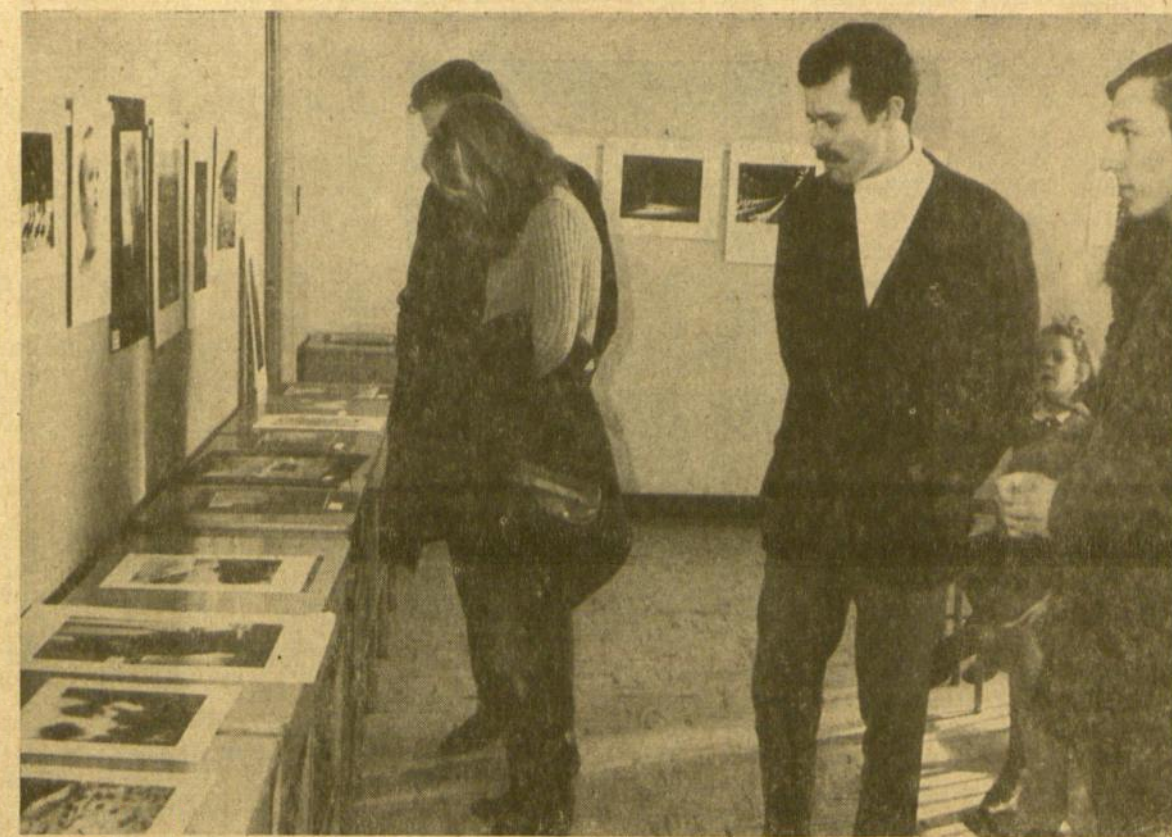
Jaunimas Lietuvių foto archyvo premijuotųjų ir atžymėtųjų nuotraukų parodoje, Jaunimo centre, Čikagoje.