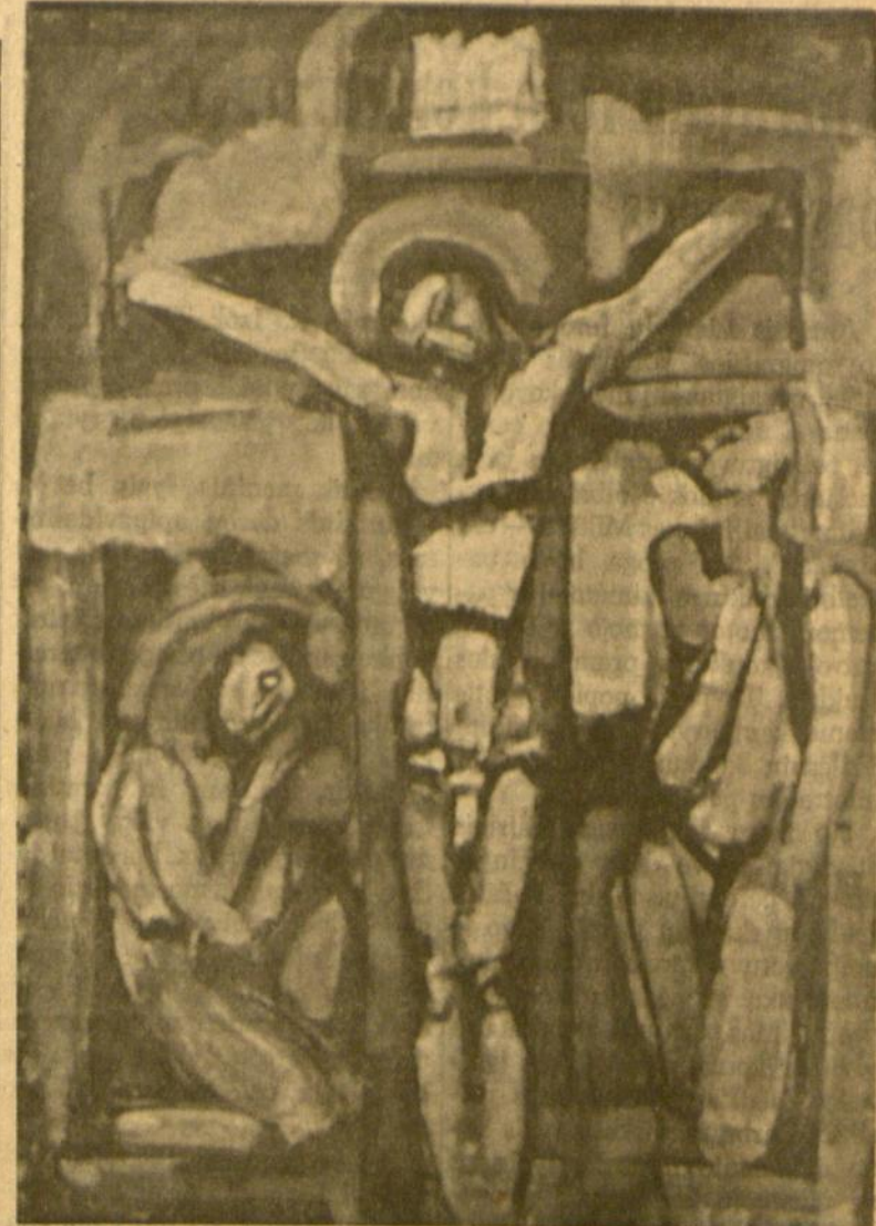
Georges Rouault (prancūzas, 1871-1958)

Greitis (tempo) yra įdomus Verdi muzikinis bruožas. Visur jo užrašuose ypač yra pažymėtas ir pabrėžtas greitis. Tas greitis, atrod, tikriausiai bus išplaukęs iš