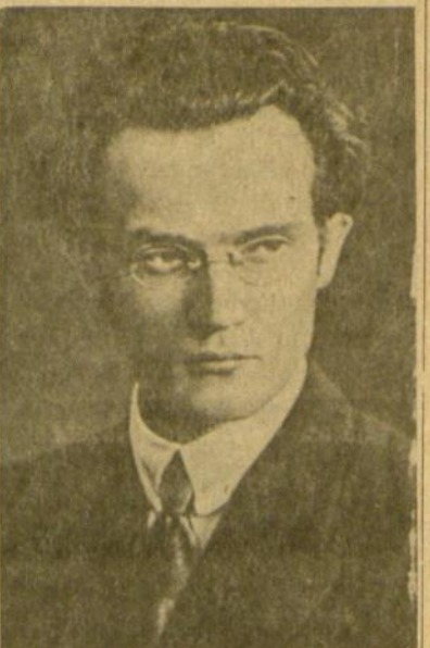
Vincas Mykolaitis - Putinas

Katalikų grožinės literatūros kritiką "Židinyje" ypač išskėlė V. Mykolaitis, tą žurnalą redagavęs 1924-1932 m. Jis 1918-1922 m. Friburge studijavo meno istoriją ir literatūrą, prisidėjęs prof. de Munynko meno aptarimą, kaip esmingiausios žmogiškosios kūrybos, parašė disertaciją apie Vl. Solovjovo estetiką. Vėliau profesoriavo universitete. Jo asmenyje jungėsi didelis poetiškas, literatūros kritikas ir istorikas. Jis gerai suprato kūrėjo psichologiją. Jis įžvalgiai vertino tiek vyresnius rašytojus (Donelaičių, Zemaiteį, Lazdynų Pelėdą, Satrijos Ragana, Maironį, Vaižgantą, Vydūną), tiek jaunesnius. Atsisakęs Jakšto dog-