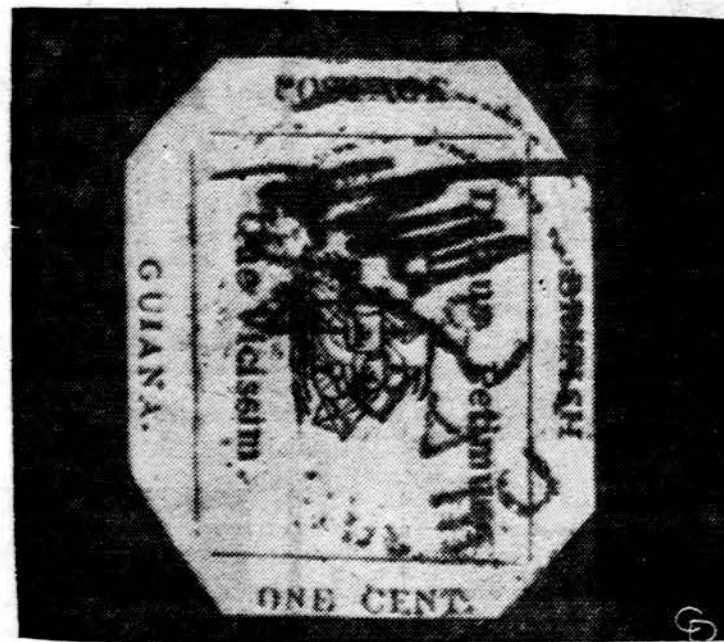
Buvusios Britų Gvjanijos pašto ženklas išstatytas New Yorke filatelijų parodoje ir kainuoja 280.000 dol. Jis yra 1856 m. 1 ct. Kai jis buvo parduodamas 1940 m., kainavo 50.000 dol.

Reikia pripažinti, kad japonai sugebėjo labai gražiai ir gerai suorganizuoti šią milžinišką parodą. Visur matyti pavyzdinga tvarka, švara, planingumas ir punktualumas. Apie 350 tūkstančių lankytojų perėina per šią parodą kiekvieną dieną. Tačiau niekur nėra stumdymosi ar spūsties, visur tvarkingos eilės ir ramumas. Mažiausiam reikalui esant, specialūs vadovai ir policija yra pasiruošę parodos lankytojams padėti. „Banzi“ Expo-70 ir jos rengėjams!