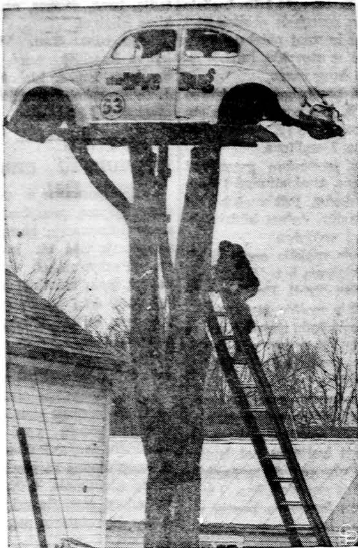
Dimondale, Mich., vienas ūkininkas savo vaikus medyje įtaisė tokį iš automašinos namelį, į kurį lipa 11 m. berniukas.