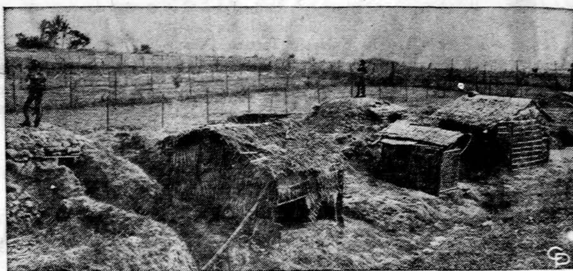
Pietų Vietnamo ir Kambodijos siena. o už sienos gali būti draugai, bet gali pasirodyti ir priešai.