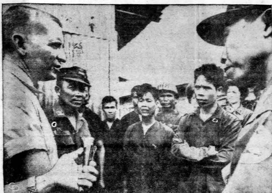
Texas milijonierius Perot kalbasi su šiaurės Vietnamo belaisviais Pietų Vietnamo stovykloje. Šie belaisviai gali gauti laiskus ir siuntinius iš savo giminių, o sykį į savaitę susitinka su savo šeimom. Priešingai gegiškai š. Vietnamas su amerikiečiais belaisviais — belaisvių sąrašo iki šiol nedavė.

Chicago ir Illinois sunkvežimį vairuotojai naujo kontrakto reikalui nėra vieningi, ir kai kurie jų jau streikuoja. Pirmiausia sustreikavo pieno išvežiotojai.