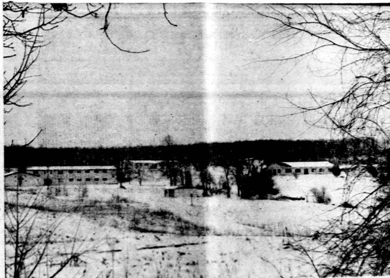
Dainava sniegui tirpstant.