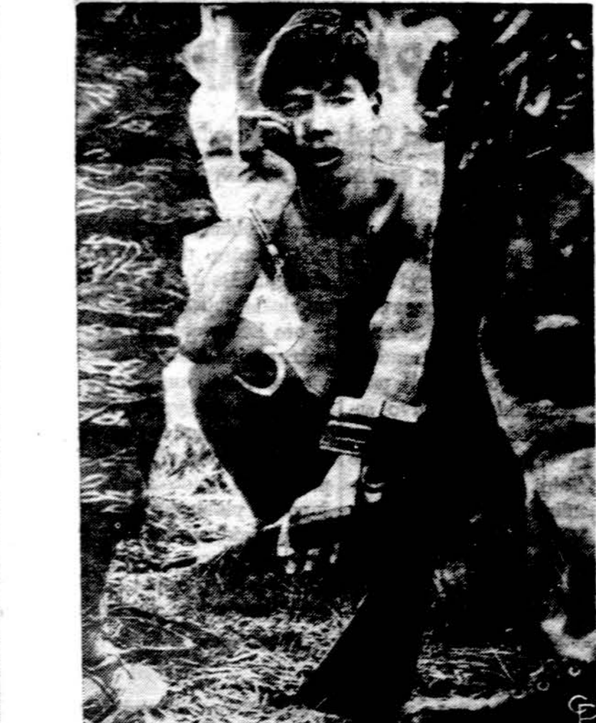
Komunistų karys Pietų Vietnamo nelaisvėje laukia apklausinėjimo. Jis bu-vo pagautas amerikiečių bazės puolimo metu Tay Ninh.

Dėl cenzūros ir popierio sto-kos tarybinių laikraščio apim-tis tesiekia tik kelis puslapius, bet, kai spausdina medžiagą a-pie rinkimines apylinkes, tai ki-tom žiniom laikraščiuose mažai vietos telieka, nors tom dienom laikraščiai žymiai pastorėja. Be to, laikraščiai pilni žinių, kad pavyzdžiui tokio tai fabriko ko-lektyvas viršijo savo mėnesinį gamybos planą ir šį šaunų lai-mėjimą skiria rinkimų garbei. Arba vėl kokio tai kolūkio trak-toristas, lenktyniaudamas rin-kimų garbei, suarė virš normos tiek tai hektarų pūdyimų. Vie-nu žodžiu spauda kasdien at-žymi pirmuose puslapiuose, kad visa laudis su patriotiniu ri-kiulimu sutinka artėjančius rin-kimus didvyriškais laimėjimais visuose darbo fronto baruose.