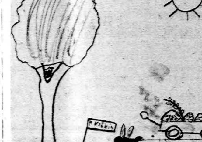
Piešė Algis Moskaitis

ZIEMA Dabar yra žiema. Šiais metais labai šalta. Visi upeliukai ir ežerai yra užšalę. Yra ir sniego. Kur tik pasižiūri tik balta, balta. Kaip koks baltas apklotas. Ant ledo, kasdien po pamokų, vaikai čiuožia, vartalojasi. Kitur nuo kalnelio vaikai su rogutėmis leidžiasi žemyn ir slidinėja. Oras pilnas šauksmų, riksmų, juokio ir verkimo.