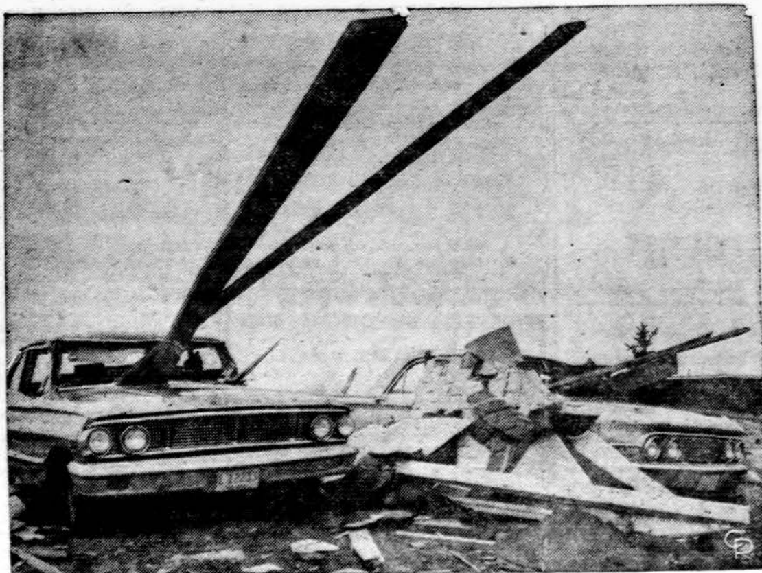
Prasidėjus pavasariui, prasidėjo ir tornadų sezonas. Netoli Columbus, Ohio, suardyto namo lentas vėjas suklijo į automobilį.

Roma. — Italijos vyskupų nutarimu, vėliausiai ateinančiais metais, bus išleisti keturi nauji katekizmai, skirti pradinių ir aukštesniųjų mokyklų mokiniams, vyresniojo amžiaus jauniui ir suaugusiems. Šie katekizmai pakeis iki šiol vartotą 1912 metais Pijaus X išleistą "Romos katekizmą". Naujuose katekizmuose bus pateikiamos pagrindinės katalikų tikėjimo žinios pagal naujuosius teologijos ir filosofijos mokslų tyrimus ir aiškinius, atsižvelgiant į paskutinių laikų pedagoginių ir psichologijos mokslų reikalavimus.