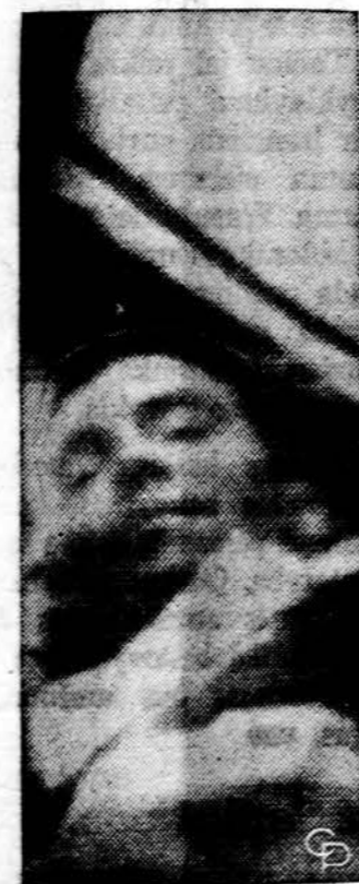
Iš Apollo 13 erdvėlaivio perduota astronauto Fred Haise nuotrauka. Vyrai grįžta namo.

Tokiems kunigams beveik visiems būdinga yra tai, kad jie mėgsta dažnai minėti Vatikano II-jo susirinkimo "dvasią". Tačiau iš to susirinkimo žodžių ir jų tikros prasmės jie priima tik tai, kas jiems patinka. Ne vienu atveju jie kalba ir elgiasi priešingai susirinkimo nutarimui