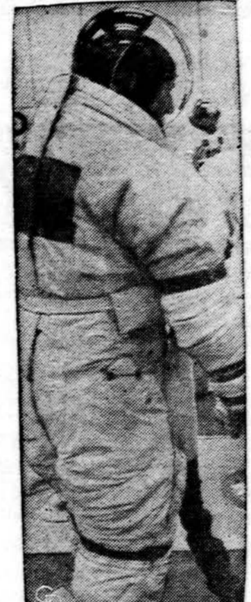
Apollo 13 kamanderis James Lovell prieš iškrendant į mėnulį.

PARDUODAMI IS MODELINŲ NAMŲ BALDAI 30% iki 50% nuolaida Galima pirkti dalimis ir išmokėtinai SOUTHWEST FURNITURE CO. 6200 S. Western Tel. GR 6-4421