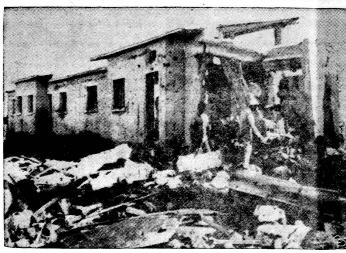
Egiptas kaltina, kad Izraelis sugriovė šią mokyklą Barn El Bakar vietovėje, kur žuvo daugiau 30 arabų vaikų ir 36 sužeisti. Arabai teigia, kad už tai žydams bus atkeršyta.

Knygą išleido Lietuvos Knygos Klubas Jos 273 psl. kainuoja 5 dol. Ji gaunama Drauge ir pas platintojus.