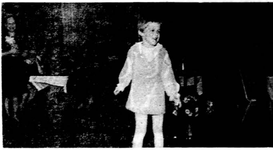
Mažoji rūbų modeluotoja madų parodoj Chicagoje.

Perskaite Draugą, duokite kitiems pasiskaityti.