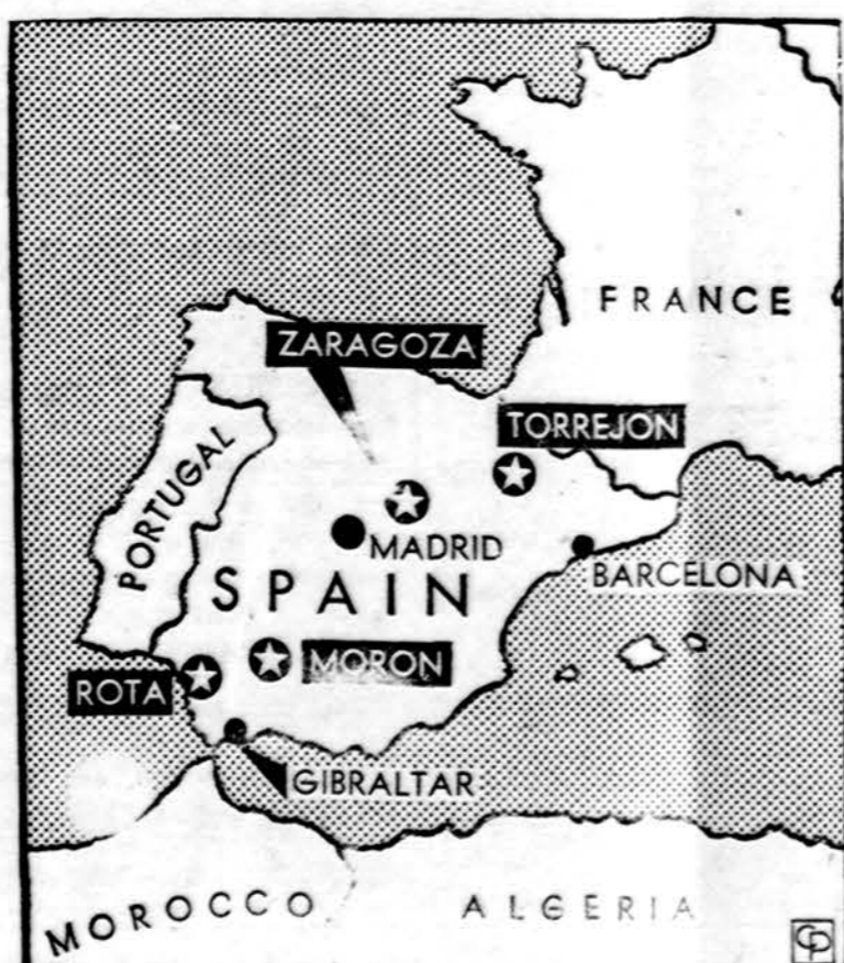
Amerikos bazės Ispanijoje, dėl kurių neseniai buvo susitarta iš naujo, ligi 4,000. (E.)