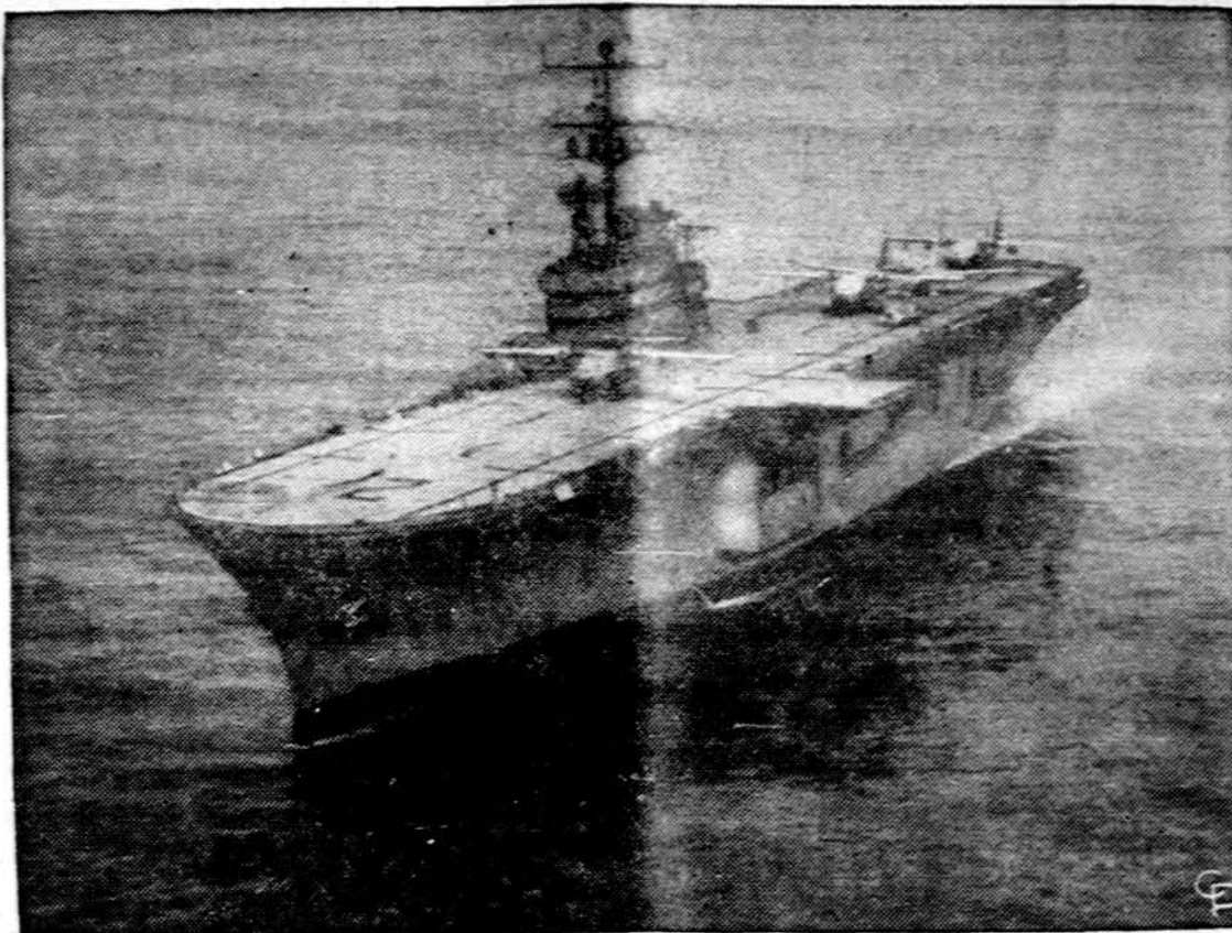
Lėktuvnešis Iwo Jima skuba į tą vietą Pacifiko vandenyne, kur Apollo 13 nepasiekė mėnulio, paskubintai turės nusileisti.

NEW YORK. — Moterų išsilavinimo organizacijos devynios narės buvo areštuotos, kai jos įsiveržė į Grove Press leidyklą ir neišėjo penkis valandas, protestuodamos, kad leidykla leidžia knygas, kuriose degradinga moteris, leisdamas pornografines knygas.