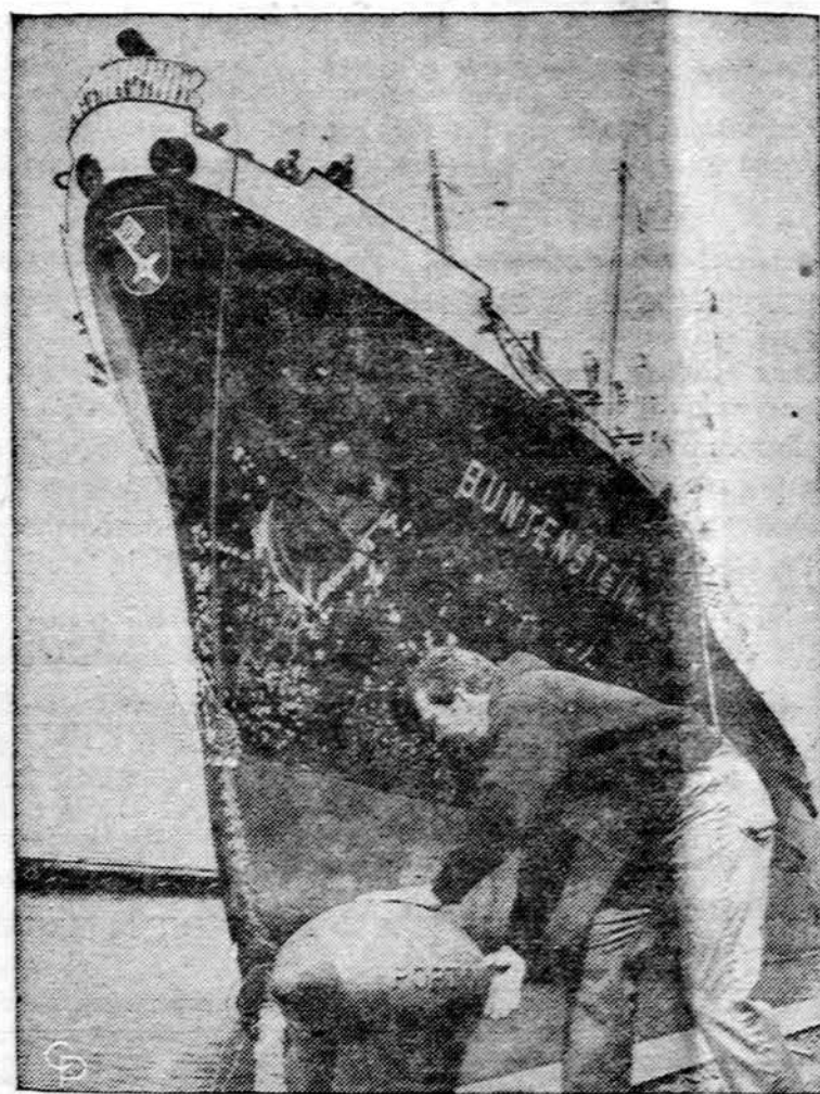
Laivininkystės sezonas Didžiuosiuose ežeruose jau prasidėjo. Pirmasis laivas iš Hamburgo pritrivtinamas Clevelando nuste.

STOCKHOLMAS. — Penkiolika Islandijos studentų įsiveržė į savo, Islandijos, ambasadą ir ją laikė kuri laiką okupavę, protestuodami, kad Islandija dalyvauja NATO pakte ir reikalauja savo krašte socialistinės revoliucijos. Tik švedų policija juos išprašė.