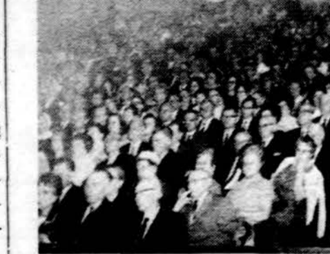
Svečiai su įdomumu seka "Grandinėles" šokius.

— Vaižganto minėjimas. Balandžio 19 d. 12:30 val. Lietuvių