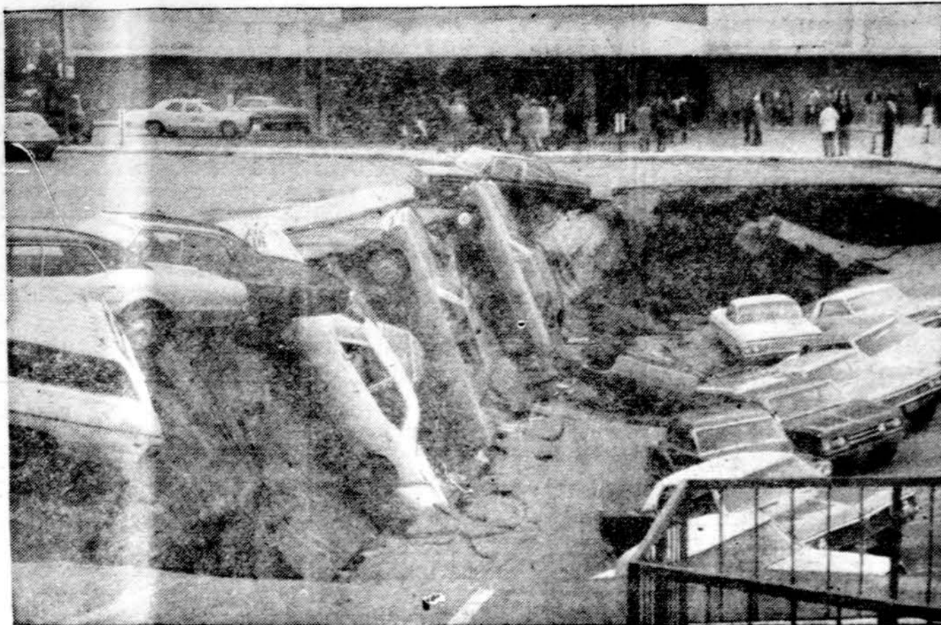
Įlūžęs Clarkson ligininės stogas Omahoje, Nebraska.

TEHERANAS. — Valstybės sekretoriaus padėjėjui Sisco lan kantis Vid. Rytuose, į Teheraną suvažiaavo tos srities Amerikos ambasadoriai ir misijų viršininkai. Pasikalbėjimo tema — arabų ir Izraelio karas ir Sovietų brovimasis į Viduržemio rajoną.