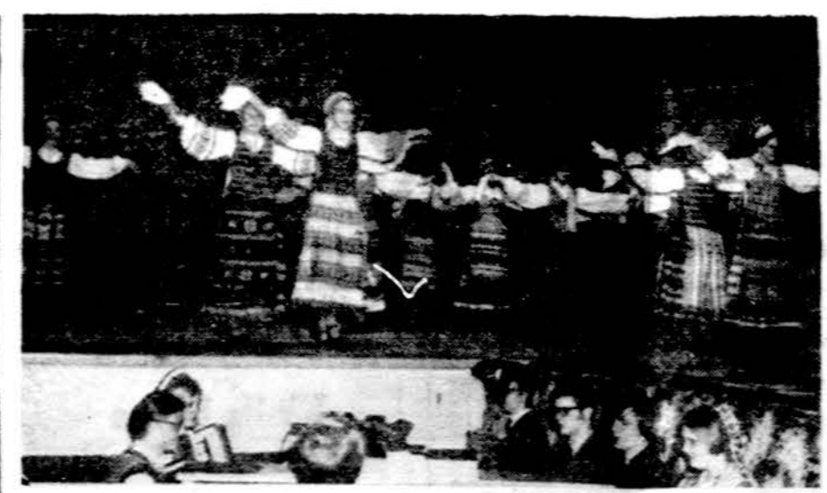
Grandinėlės mergaičių grupė plastiniame šokyje balandžio 12 d. Detroito. Apačioje Grandinėlės orkestras iš 4 asmenų.

— Sako, tu greiči visi, Svensonai? — Aš ir pats nežinau. Mano sužadėtinė nenori tekėti už manęs, kol aš neišmokėsiu skolų. O tu skoli tiek daug, kad aš negalėsiu jų išmokėti tol, kol negausiu jos kraičio.