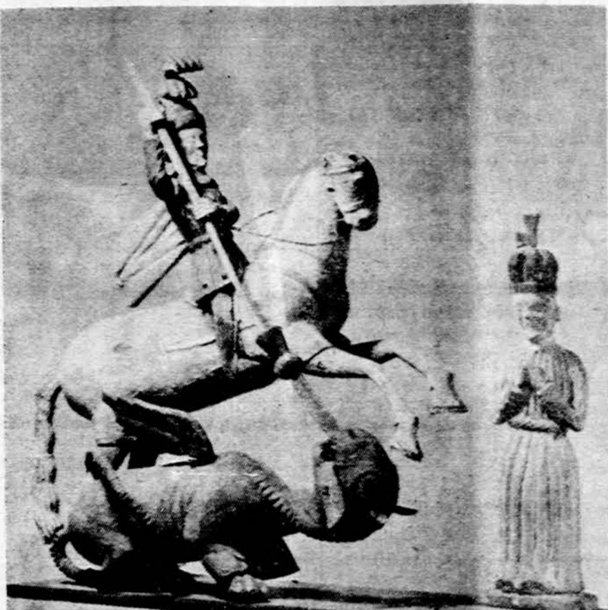
Sventasis Jurgis. Lietuvių liaudies menas. Darbėnai, Zemaitija.