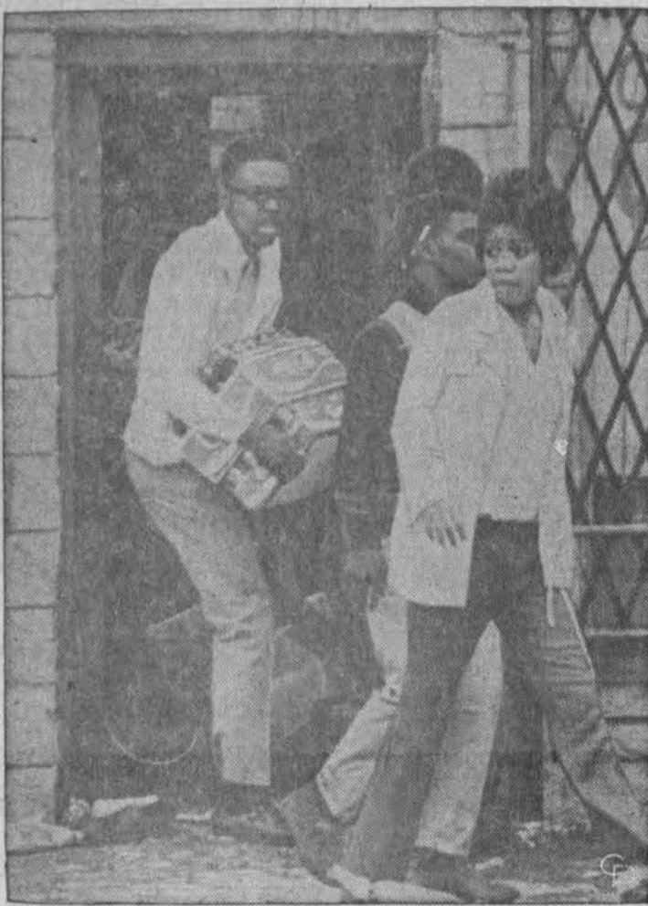
River Rouge, Mich., aukštesniosios mokyklos rasiinės riaušės baigėsi paprastu plėšikavimu ir krautuvų plėšimu.

Saulėta ir kiek šilčiau, temperatūra apie 65 laipsnius.