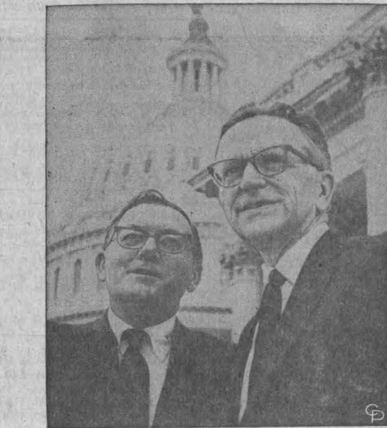
Teisėjas Harry Blackmun (dešinėje) žvalgosi Washingtone, kur vyksta jo apklausinėjimas, ryšium su jo nominavimu į aukščiausią teisumą. Šalia yra sen. Robert Griffin (R.-Mich.)

Laukiama Amerikoje karo priešų riksmo Negali būti pamiršta galimybė,