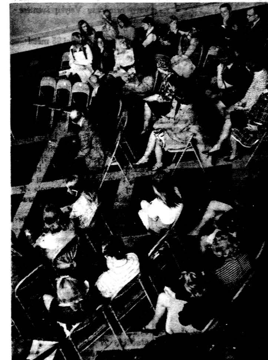
Simpoziumas: diskusijos tarp Chicago moksleivių ir tėvų aktualiomis problemomis metinės šventės pirmą dieną. Nuotr. V. Kaulio, S.J.

Rosaries — Herbs — Oils — Incense and Gift Items If we don't have it, we'll order it. Open 7 days a wk. 8:30 a.m.-8 p.m. 1400 So. Union Ave., Chicago, Ill.