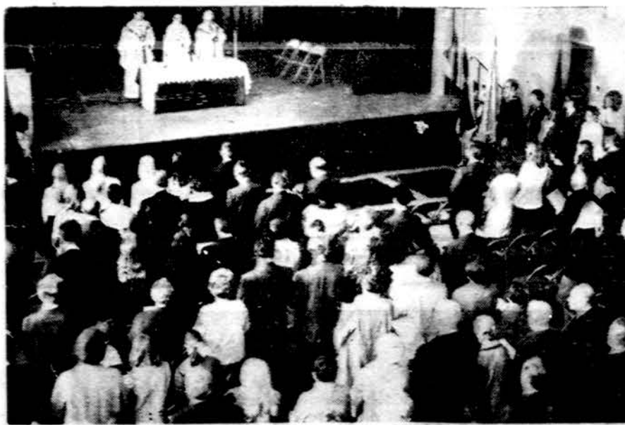
Seimos šventės proga ateitininkai susirinkę šv. Mišioms Jaunimo centre, Chicagoje.

Mielas ateitininke, ir šandien tavo ausis kutena diena iš dienos visom galimom priemonėm skelbiami šūkiškieji. Dar daugiau ir garbiau, negu tada. Vyljoja jie kiekvieną "draugu" įtaka, "laisvės", "taikos" šūkiškieji, emblemomis ir utopiškais pažadais. Todėl nesijustebk, jei šio dekadentiško mo-