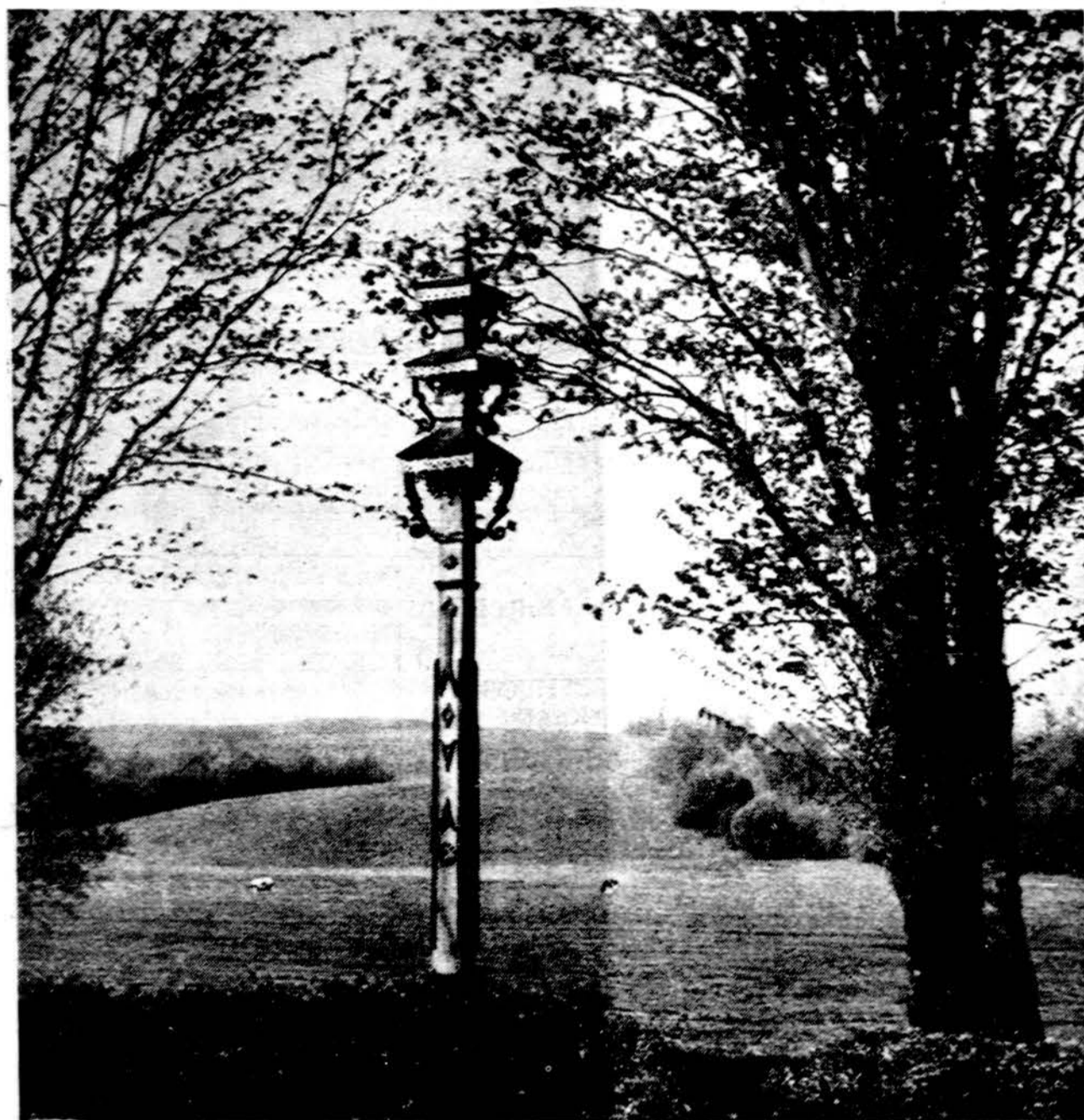
Sventiškas vaizdas Lietuvos kaime.

Seno tipo komunistai turi didelės įtakos vadinamajai "Nau-