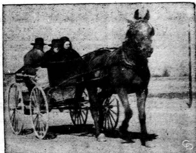
Saulėtą sekmadienį tolimajam Indianos kaime grįžta žmonės iš bažnyčios tokiu pat vežimu, kaip ir jų seneliai. Idiliškai gražu.

● Gyventojų surašinėtojai jau gavo atgal 80% pasiųstų anketų, daugiau nei tikėjosi. Iš vadinamųjų "geto" rajonų anketos plaukia lėčiau, kol kas sugrįžo 60%.