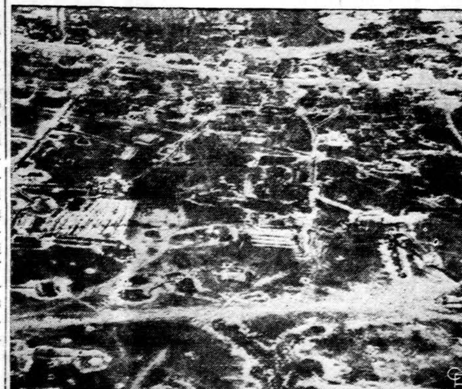
Kambodijoje amerikiečiai užėmė milžinišką komunistų sėvyklą Ba Thu, kur buvo įrengti sandėliai ir kareivių apmokymo centras.

Kongreso žymūs nariai (respublikonai, bet daugiausia demokratai) jaučiasi labai užgauti, kad Nixonas ryžosi tokiam žygiui, gerai žinodamas jų griežtą nepritarimą. Svarbiausia juos pykina, kad Nixonas nepain-