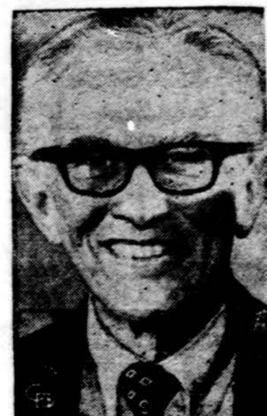
Clevelando prekybininkas Metzzenbaum, pirmiausia balsavimuose nugalėjęs astronautą John Glenn. Rudenį jis rungsis su respublikonų kandidatu Tafy dėl Ohio senatoriaus vietos.

MASKVA. — Rusijoje pasirodė požeminis laikraštis "Exodus". Jį leidžia žydai sionistai. Jame telpa eilė dokumentų ir laišku, rašytų sovietų valdžiai, Jungtinėms Tautoms. Laikraštis turi 39 puslapius, išleistas gana dailiai.