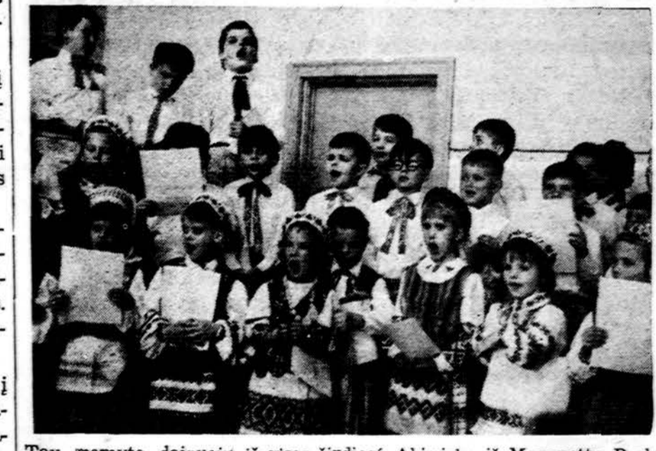
Tai, mamytė, dainuoja iš visos širdies! Akimirka iš Marquette Parko lituanistinės mokyklos Motinos dienos minėjimo.