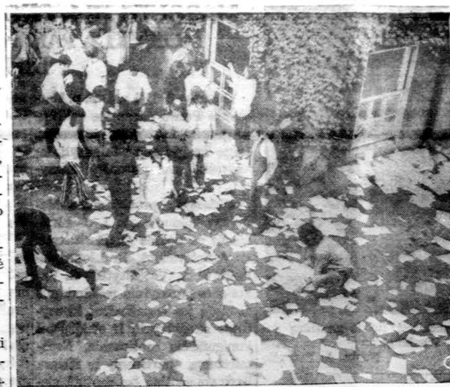
Carnegie Mellon universitete Pittsburghe, studentų organizacijos, vadinamos Studen'ai už tvarkingą visuomenę, renka išbarstytas knygas. Knygas išbaršė chuliganiškų poinkinių studentai demonstrantai, puldami ir lauždami karinio parengimo departamentą.