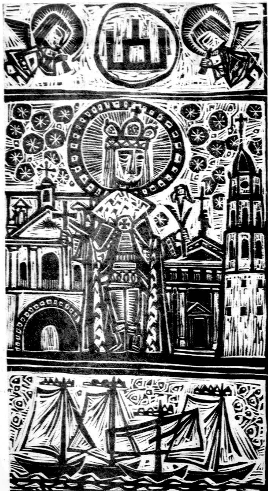
Vytautas Ignas „Lithuania“ Sv. Kazimieras (Detalė iš medžio raižinio „Nuotr. V. Mazelio“)

ba tikrai mums daugiau nebe-maloni. Nebegali jų rašyti kaip mums įprasta ar patinka. Taip Lietuvos Brastą, arba tik Brastą, pateko į EL mums neįprastu Brest, ir Gudijoje. Skliaustuose i teiperrašyta jai savięji vardai ir kiek ankstyvesnis Brest-Litovsk, o tekste surašyti ir kiti vardai ir jų keitimai, nors jie nebeuduoti atskirais nurodymais. Šiap ar taip reikėjo: to ir Brzešč Litewski ir vēlesnio — Brzešč nad Bugiem su atskiromis nuorodomis, nes tie vardai dar tebesimašo įvairiuose gazetteer, kuriais ir naudojasi paprastai angliškai kalbąs žmogus, kai nori išsiaiškinti kur viena ar kita vietovė yra, kiek paskutiniu metu turi