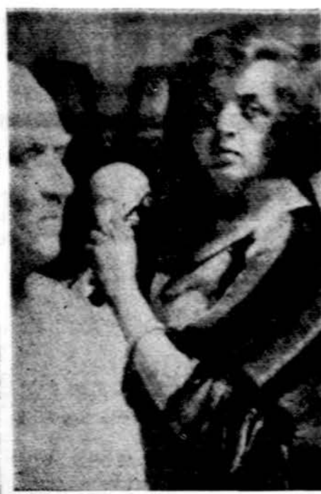
Clara Consuelo Sheridan 1920 m. prie vienos iš savo skulptūrų.

norisi iš autoriaus tikėtis didesnio rinkinio liaudies pasakų, perleistų per tą šmaikščią švaistišką plunksną, iliejant daugiau veiksmo, o taip pat knygiu jaunimui, kurias skaitydami mūsų moksleiviai galėtų jausti, kad fantastiški nuotykiškai ir nuostabūs įvykiai nėra vien tolimos praeities monopolis, bet gali riedėti ir dabartyje. O tu įvykių herojai gali būti ne tik senosios liaudies milžinai, artojai ar žvejai, bet jie patys — erdvių amžius lietuviukai.