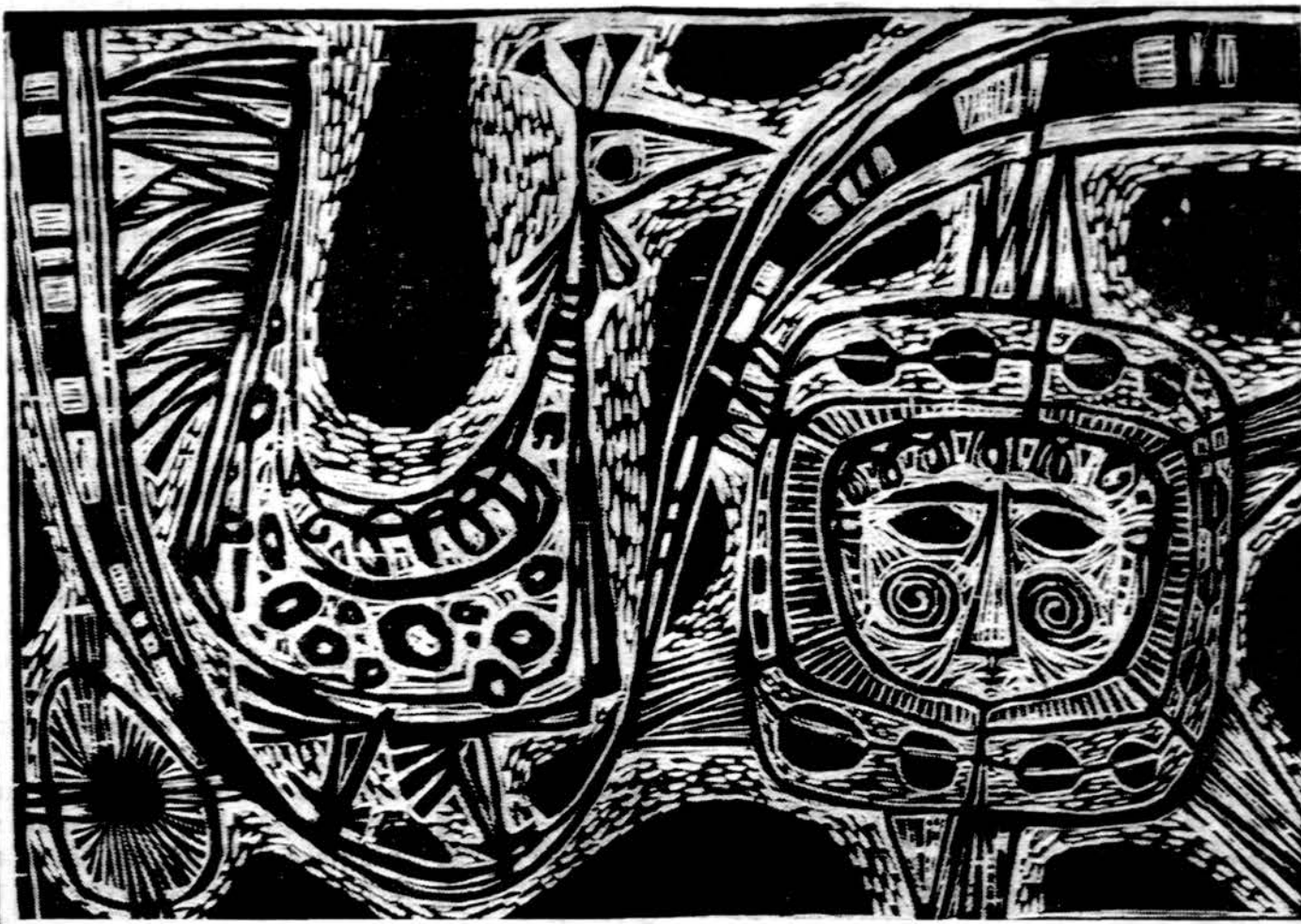
Vytautas Ignas Saulė ir paukštis (medžio raižinys)

Imkime kad ir pirmą rinkinio eilėraščių "Poemą apie brolių". Tai klasikinio surentimo, bet kartu ir labai modernaus eilėraščio pos- mai. Tai labai konkreti, nuosek- liai ir trieliūs posmus įkūnyta po- ema apie brolių — žmogų visuose amžiuose ir visuose kraštuose! Beveik girdimo žingsnio kietu metru parašytos eilutės visą laiką skamba lyg dunksintys legionų žy- giavimas Respighi simfoninės po- emos "Pini di Roma" paskutinė- je dalyje. O kiek dažnoje eilėraš- čio eilutėje čia randame alitera- cinio išradimo ir grožio! Va, argi negirdime rūstaus liūtų riau- mojimo Koliziejaus arenoje kad