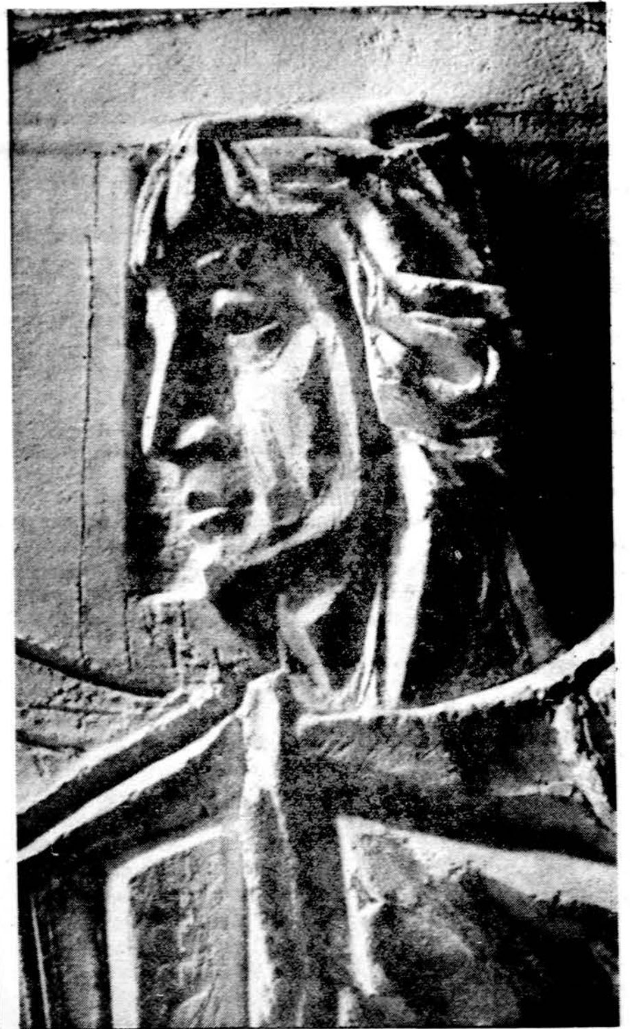
V. K. Jonynas Šv. Kazimieras (Detalė iš Lietuvos kankinių koplyčios Vatikane.)

Kongurse iš viso dalyvavo 25 šokėjų poros iš aštuonių Rytų ir Vakarų Europos kraštų ir Japonijos. (E.)