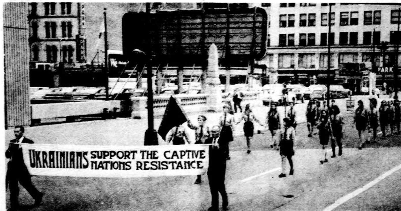
Ukrainiečių jaunimas žygiuoja Pavergtųjų Tautų savaitės parado metu Chicagoje. Liepos 18 d.