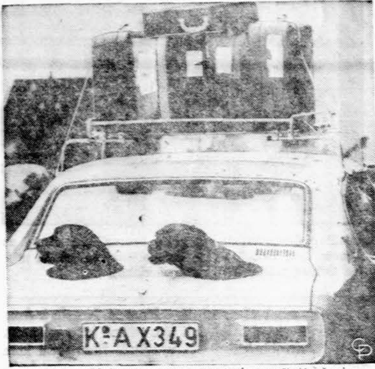
Koelne, Vokietijoje, šitai savininkas važinėja šunis.