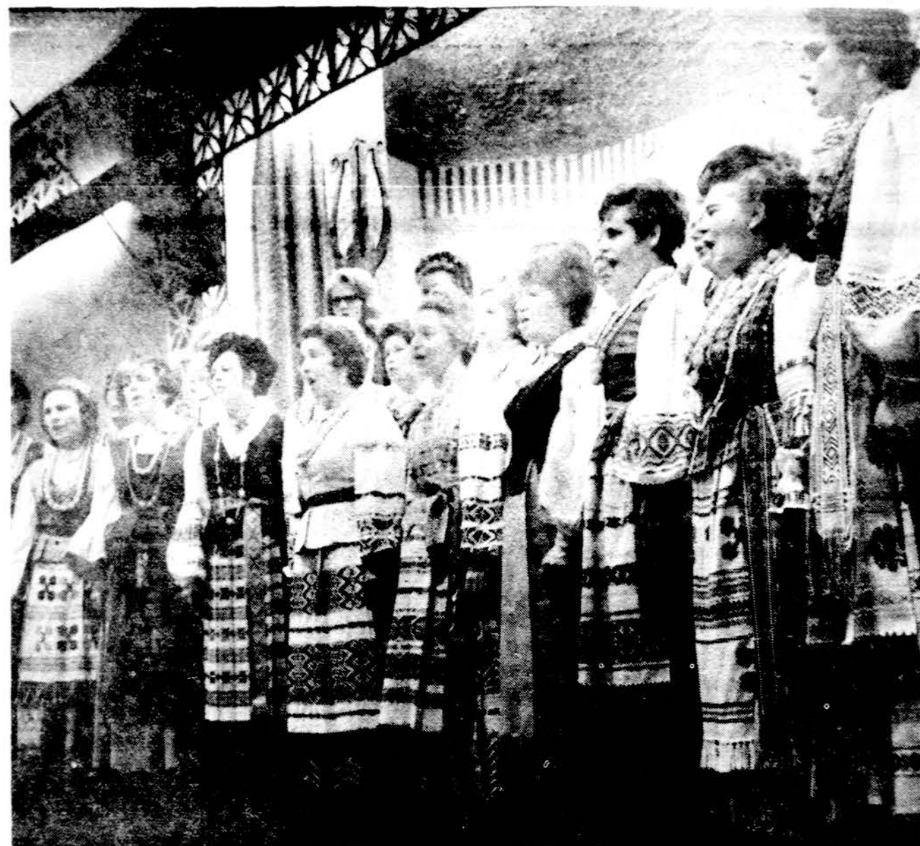
Operetės choras New Yorke