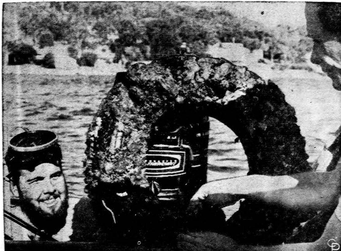
Goodyear b-vė skelbia, kad ji nežinanti kaip sunaudoti kasmet atliekamų pusantro bilijono senų padan-gų. Jie čia demonstruoja, kad galima tokias padangas panaudoti žvejybai, esą jos, nuleistos į vandenį su-daro žuivms vietą pasislėpti, o austrėms prisikabinti i, kaip čia matyti, kad yra įvykę ant vienos senos pa-dangos.

Mūsų visuomenė dabar mažai kovoja dėl idėjų. Srovinės orga-nizacijos dabar gyvena taikioje ir bendradarbiauja. Tačiau tai nereikia, kad auklėdami jau-nimą, neturėtume stengtis pa-dėti išugdyti pasaulėžiūrą, pa-dėti išugdyti asmenis su idėjo-mis. Yra faktas, kad pasaulė-žiūra paremtos mūsų jaunimo organizacijos — ateitininkai, skautai, neo-lituanai — dar ga-na tvirtai laikosi. Taip pat džiuginantis reiškinys, kad jos sa-vo tarpe bendradarbiauja. Tuo tarpu bendrinė studentų orga-nizacija nebeperodo jokios veiklos. Tur būt, tai yra dėl to, kad bendrinė studentų organizacija neturi jokios vyresniųjų globos.