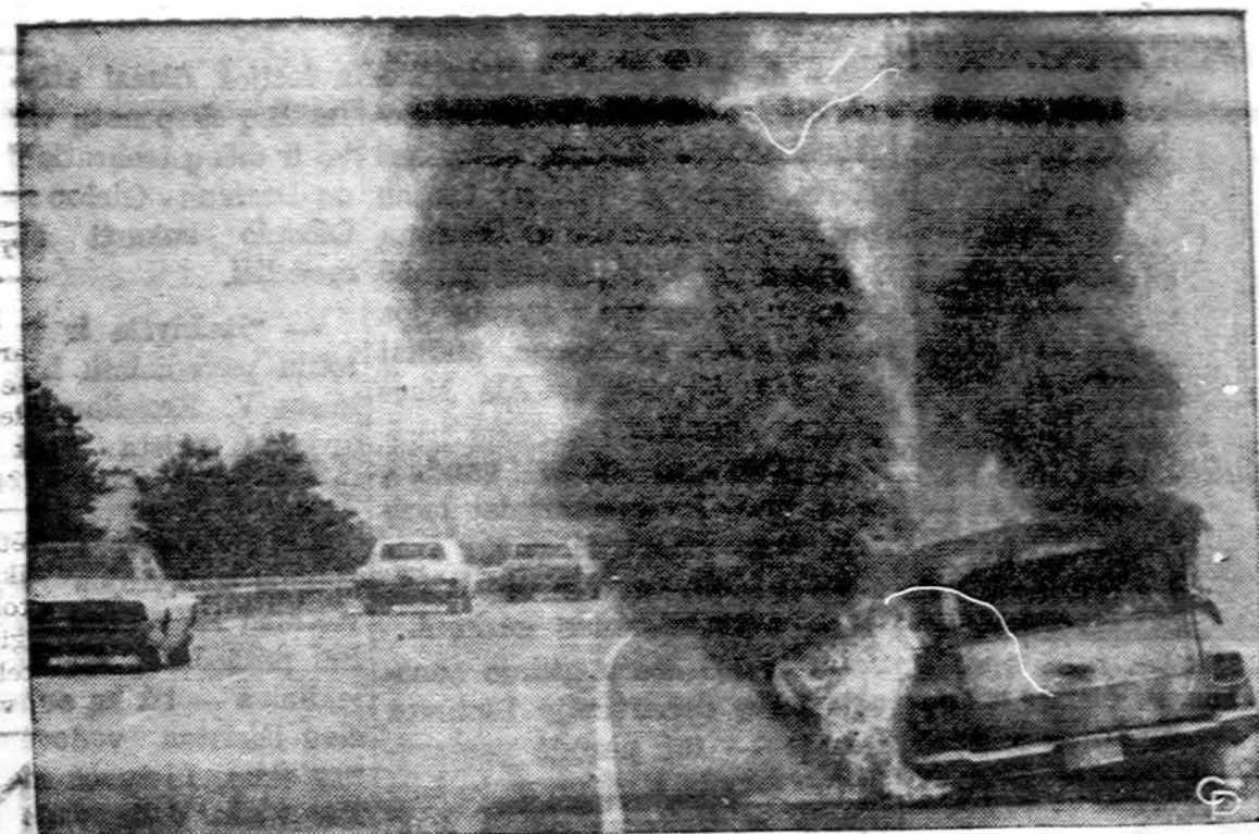
Amerikoje dažna nelaimė: automobilio gaisras. Šis automobilis dešimties 91 kelio, netoli Holyoke, Mass.