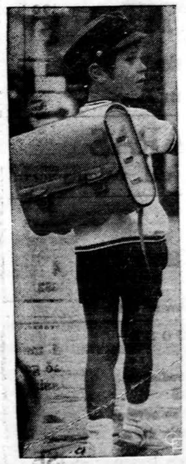
Vakariniai vokiečiai sukonstravo savo mokiniams naujas kuprines. Jos yra plastikinės, geltonos spalvos, iš tolo, net nakties metu gerai matomos, nes yra tam tikru būdu apšviestos.