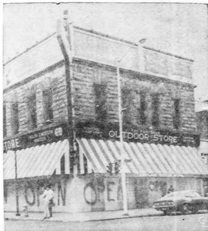
Pasiruošę konvencijai, Portlande, Oregon, vyksta Amerikos veteranų konvencija. Ta proga miesto pakraščiuose susirinko iš visos Amerikos 8,000 "taikos šalininkų" ir kitokių triukšmadarių ir ruošėsi sutrukdyti veteranų suvažiavimą. Atsargūs prekybininkai, numatydami galimas muštynes gatvėse, langus užkalė iš anksto.

viceprezidentu Garner, tarėsi, kaip išvengti įtraukimo į karą ir pasipriešinti Roosevelto politikai. Lindbergh'as po Pearl Harbor puolimo panorėjo grįžti į armijos aviacijos korpuse, bet įsikio prezidentas, ir jis nebuvo priimtas. Vėliau Lindbergh'as skraidė Pacifiko rajone kaip civilinis patarėjas lėktuvų kompanijoms. Rooseveltas jo nenorėjęs turėti kariuomenės eilėse, kad neužimtų kur vadovaujamą vietos, jau ir karui einant, dėl jo požiūrio į karo vedimą.