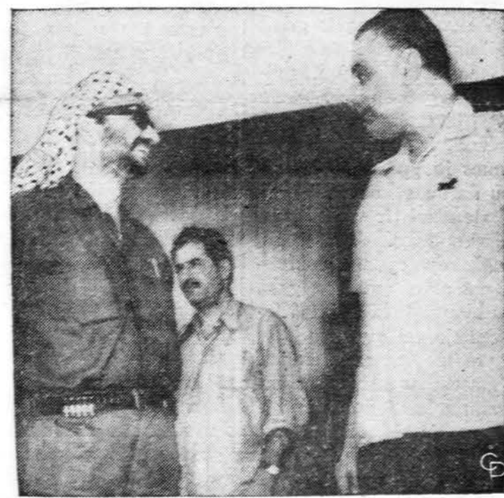
Palestinos partizanų vadas Yasir Arafat kalbėjosi su Egipto prezidentu Nasseriu, bet nelabai ką sutarė.

Kiek pasiseks stovykla, tiek pasiseks kongresas, o stovyklos nuotaika ir entuziazmas jau tą užtikrina.