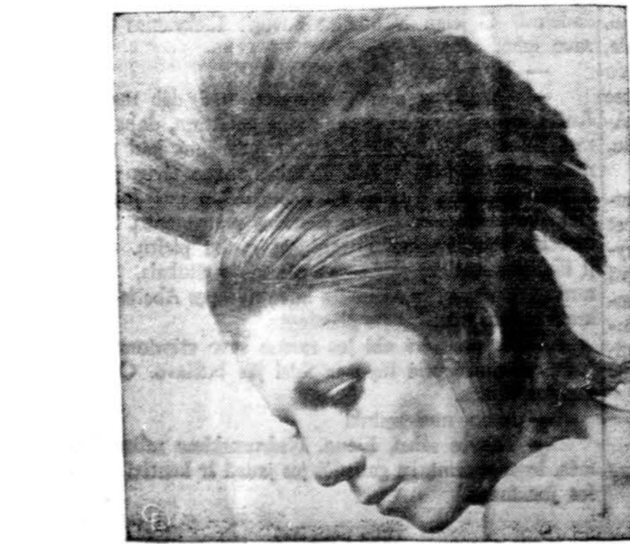
Tokios šukuosenos demonstruojamos Paryžiuje.

Kas kart vis daugiau reklamuojama ir skatinama įsigyti žemę, vien kaip kylančią vertybę pinigų investavimui. Tokios žemės kaina iškeliamą ne dėl jos vertės tiesioginiam panaudojimui statybai, ar išsukama pareikalavimo, bet kyla dėl sumanių reklamų. Reklamuojamo daikto vertė, jei ji nėra palaikoma gyvenimo būtinybės bei realybės, tesiasi tik tol, kol ji palaikoma reklamos. Nustojus reklamuoti, netenka ir savo vertės. Natūraliai žemės vertė yra pastovi, su mažais svyravimais kritimui, bet su didesniais svyravimais kilimui. Reklamos būdu iškelta žemės vertė tolygi kilimui. Reklamos būdu iškelta žemės vertė tolygi kairioms akcijoms, kurios kelių metų bėgyje iškilo dešimteriopai ir vėl nukrito į savo pirmąją vertę. Investavimas į žemę, lygiai kaip ir investavimas į akcijas bei fondus, turi būti gerai išnagrinėtas, nes gali būti labai geras, bet gali būti ir labai blogas.