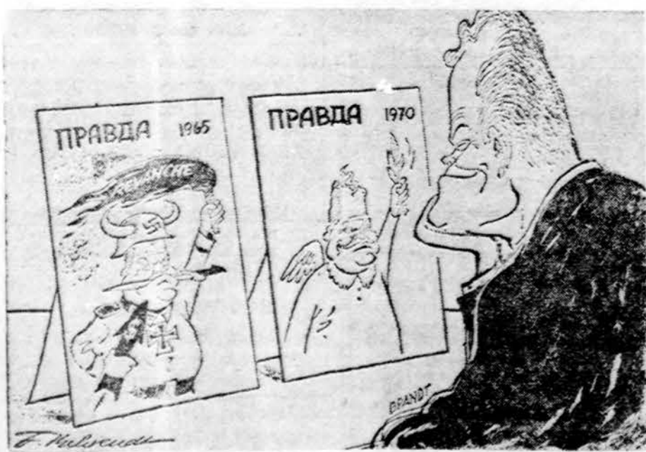
Kanceleris Willy Brandt negali atsistebėti savo pasikeitimu: 1965 Pravda rašė, jog jis fašistas, hitlerininkas, revanšistas, nusikaltėlis, o 1970 — jau angelas, panašus į šventąjį. (Iš Vakarų Europos spaudos)

Išlaidos maistui meksikiečių šeimos biudžete per pastaruosius dvejus metus padidėjo nuo 60 iki 75 procentų.