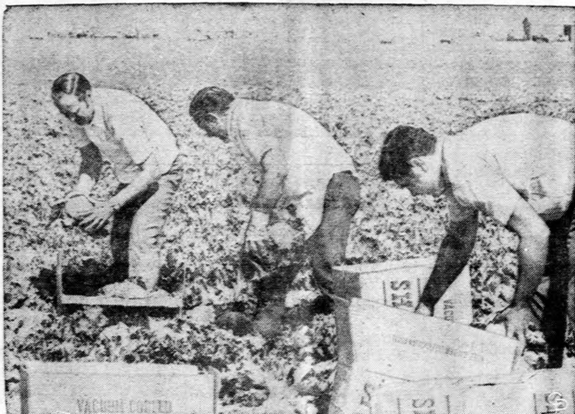
Kai Kalifornijos daržovių rinkėjai susitreikavo, kopūstų mėgėjai patys pasiskina pietus.