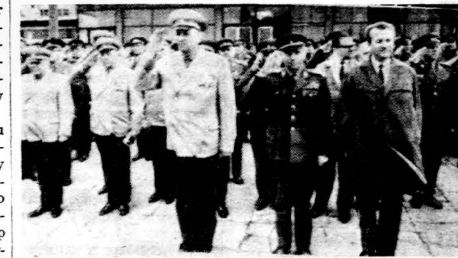
Sovietų Sąjunga kietai laiko Čekoslovakiją savo karinėse, politinėse, ekonominėse replėse. Karinį paradą Prahos aikštėje priima iš Maskvos atvykęs maršalas Grečko.