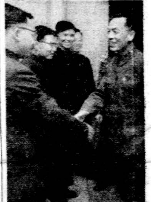
Kinijos ambasadoriaus sutikimas Varšuvos aerodrome. Kiniečiai šypšos tik savo tarpe.

Vid. Rytų atveju Kinija aiškiai remia neklaudžadus partizanus. Kitaip ir negalėtų elgtis, tūk Egiptas ir Jordanija, jų palaubos yra Amerikos ir Rusijos politikos spaudimo išdava. Neseniai Palestinos partizanų de