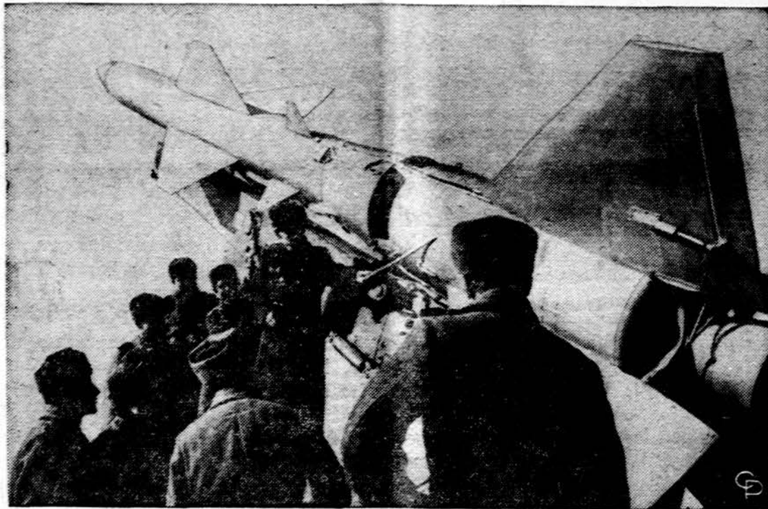
Sovietų gaminta raketa SAM-2, kurių pilna dabar Egipte. Rusų karininkas instruktuoja kareivius.

SAIGONAS. — P. Vietnamo kariuomenė patyrė pralaimėjimą viename fronte, neteko 34 užmuštais ir 42 sužeistais, kai 200 komunistų užpuolė vieno dalinio štabą į pietus nuo Da Nang.