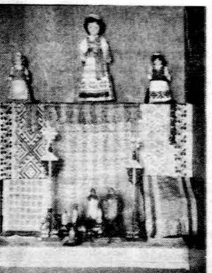
Rankšluosčių, servetėlių, padukėlių, takelių, juostelių, lėlių ir t.t. Tikrai gražūs darbai, tinkami dovanoms. Kainos prietamos.