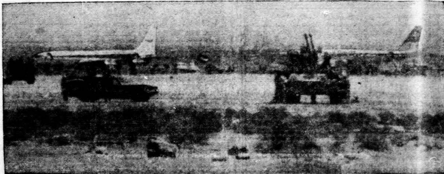
Arabų partizanų pagrobti lėktuvai tankais saugojami Jordanijos dykumoje.

Iš ryto apsiniaukę ir galimas lietus, vėliau daugiau saulėta, vėšiau ir didesni vėjai, temperatūra apie 75 laipsnius.