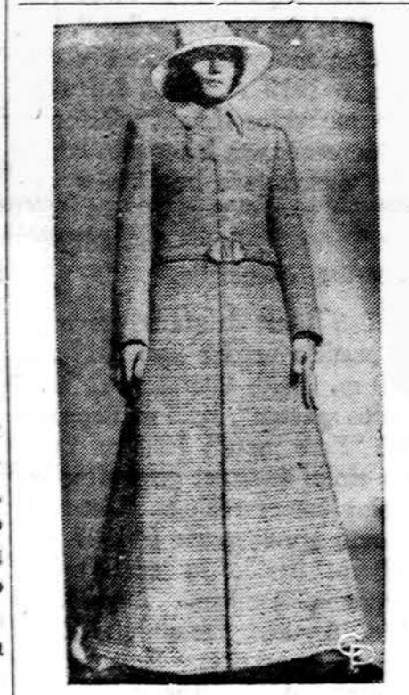
Tokie drabužiai vyrams demonst- ruojami Romoje.

LINKSMIAU ISSPRENDĖ — Žinai, bičiuli, kad aš nepa- prastai puikiai išsprendžiau au- to susisiekimo problemą. — Nagi kaip? — Pardaviau savo automo- bilį. PARDUODAMI IS MODELNIŲ NAMŲ BALDAI 30% iki 50% nuolaida Galima pirkti dalimis ir išmokėtina! SOUTHWEST FURNITURE CO. 6200 S. Western Tel. GR 6-4421