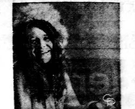
Daikininkė Janis Joplin. 27 m., ras-ta negyva savo bute Hollywood.

Opening for experienced R. N. non — appointment department on P. M. shift. You will be handling administrative areas such as payroll, scheduling, identification of training needs etc. Establish and evaluate priorities, techniques and procedures. Supervise R. N.'s, L. V. N.'s, Ward Clerks, Surgical Technicians, Receptionists and Orthopedic technicians. Openings available also for RNs Also NURSE ANESTHETIST WRITE OR CALL KAISER PERMANENTE MEDICAL GROUP PHONE (213) 325-5111, Extension 1378 1100 W. Pacific Coast Highway Harbor City, California 90710