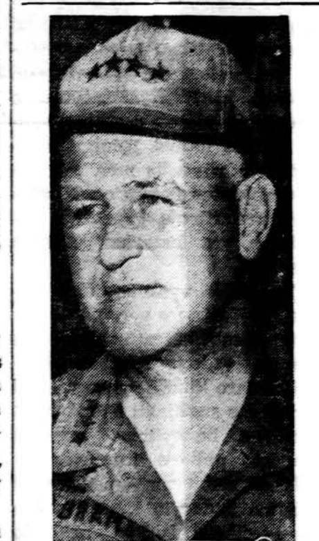
Gen. Creighton W. Abrams, JAV karo vadas Vietnamo, buvo truputį sunegalavęs.

Tų didžiųjų tikslų besiekiant, reikia vykdyti ir mažesnius uždavinius. Vienas tokių yra rūpestis kriminaliniais nusikaltimais. Amerikoje labai daug kriminalinių nusikaltėlių. Tiksliai nežinia, kiek jų yra, tačiau statistikos duomenimis du milijonai kriminalinių nusikaltėlių kasmetai juose gyvena. Kiti 800,000 yra paleisti su sąlyga, kad nenusikals. Dar didesniame jų skaičiu pavyksta išvengti ar pasisukti nuo teisingumo orga-