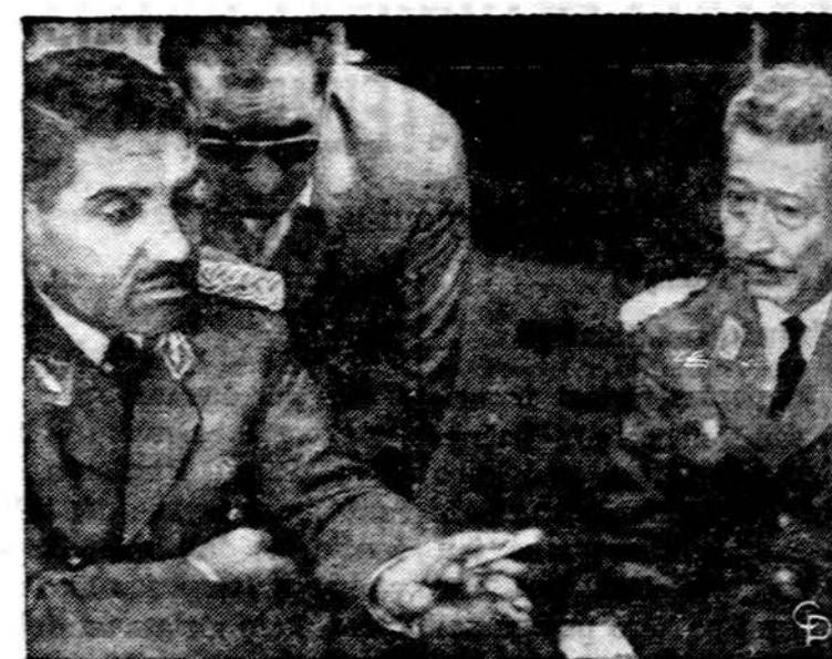
Bolivijos gen. Rogelio Miranda (kairėje) kalba spaudos atstovams, kodėl nuvertė Bolivijos prez. Alfredo Ovando. Jis pats irgi tuoj pat kitų iš valdžios nustumtas žemyn.

Jeigu ligi šiol didžiausias technologijos dėmesys buvo kariški reikalai, tai dabar turėtų būti daugiau dėmesio skiriama žmoniems iš žlugdančių negeruogių gelbėti. Ligi šiol žmonija daugiausiai darbo, išmonės ir lėšų dėjo į vis tobulėsių ginklų išradimą ir jų gaminimą. Nūdien, kai per jų neįsiamumą ir apsilėdimą baigiamas užteršti oras ir vandenys, reikia tikėtis, kad bus susiprasta ir pradėta rimtai rūpintis žmonių ir aplinkumos nuo visokių užteršimų apsaugojimu.