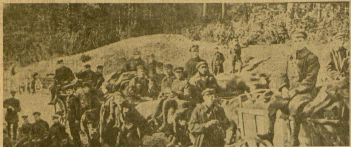
Mūsų kariuomenės 5 pėstininkų pulko kariai 1920 metais, kietose kovose atrėmė lenkų puolimą prie Beržininko, netoli Seinų.