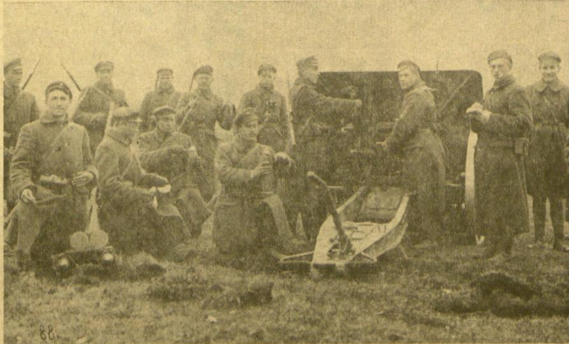
Mūsų sunkioji artilerija kovoja prieš lenkus Seinų fronte 1920 metais.

(Tęsinys iš praėjusio šeštad.) Rugsėjo 22 d. katastrofa. Lietuvos puolimui lenkų buvo skirta pirmoji, stipresnė, sparninė grupė. Įsakyta užimti išeities ribą puolimui Augustavo miškuose lenkų kariuomenės dalys gavo rugsėjo 19 d. Užimti galutinai ribą ir pasiruošti buvo įsakyta iki rugsėjo 21 d. ryto. Puolimai rugsėjo 22 d. 10 val. ryto. Seinus, Beržininką ir Kapčiamiestį buvo įsakyta užimti ir lietuviams nustumti į šiaurę ne vėliau kaip iki rugsėjo 22 d. sutemų. Lietuvos kariuomenės vadovė apie atvykimą į Augustavo miškus lenkų pėstininkų turėjo tik apytikrų žinių. Žinias suteikė žvalgybon pasiūstų mūsų karių ir keletas pabėgusių lenkų kareivių. Vadovybė išėjo būti pasirėngusiems atremti kėkėviena prieš puolimą. Rugsėjo 22 d. apie 10 val. staiga ir didelėmis jėgomis lenkai pradėjo puolimą. Vietose, kuriose ke, nublokšti lietuvius į šiaurę, pereiti Nemuną prie Druskininkų (reikalui esant ir prie Merkinės), užėjus į rusų — bolševikų kariuomenės sparną, priversti pasitraukti juos iš Gardino, smogiant bendrąjį Druskininkai, Marcinkonys, Rodūnė, Žirmūnai, Lyda kryptimi; antrasis — su-