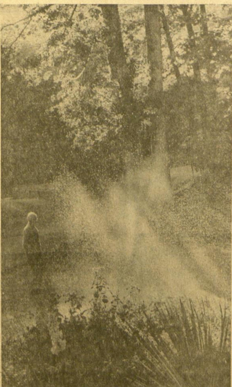
Rudenio saulės švystelėjimas...