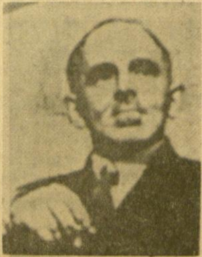
Poetas Osipas Mandelstamas, nu- kankintas Rusijos vergų stovyk- lose.

"Kodėl manai, kad turėtumei būti laiminga?" — Mandelsta-