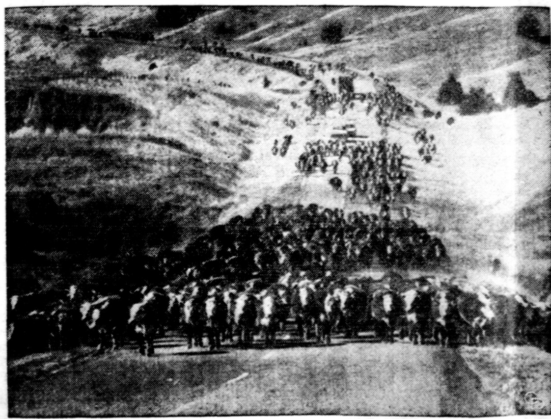
Pabandykite dabar tokiu plentu pravažiuoti, kai vienas Montanos ūkininkas varo į geležinkelio stotį savo 1,800 galvių.

Dalinal saulėta, kiek šilčiau, temperatūra netoli 50 laipsnių.