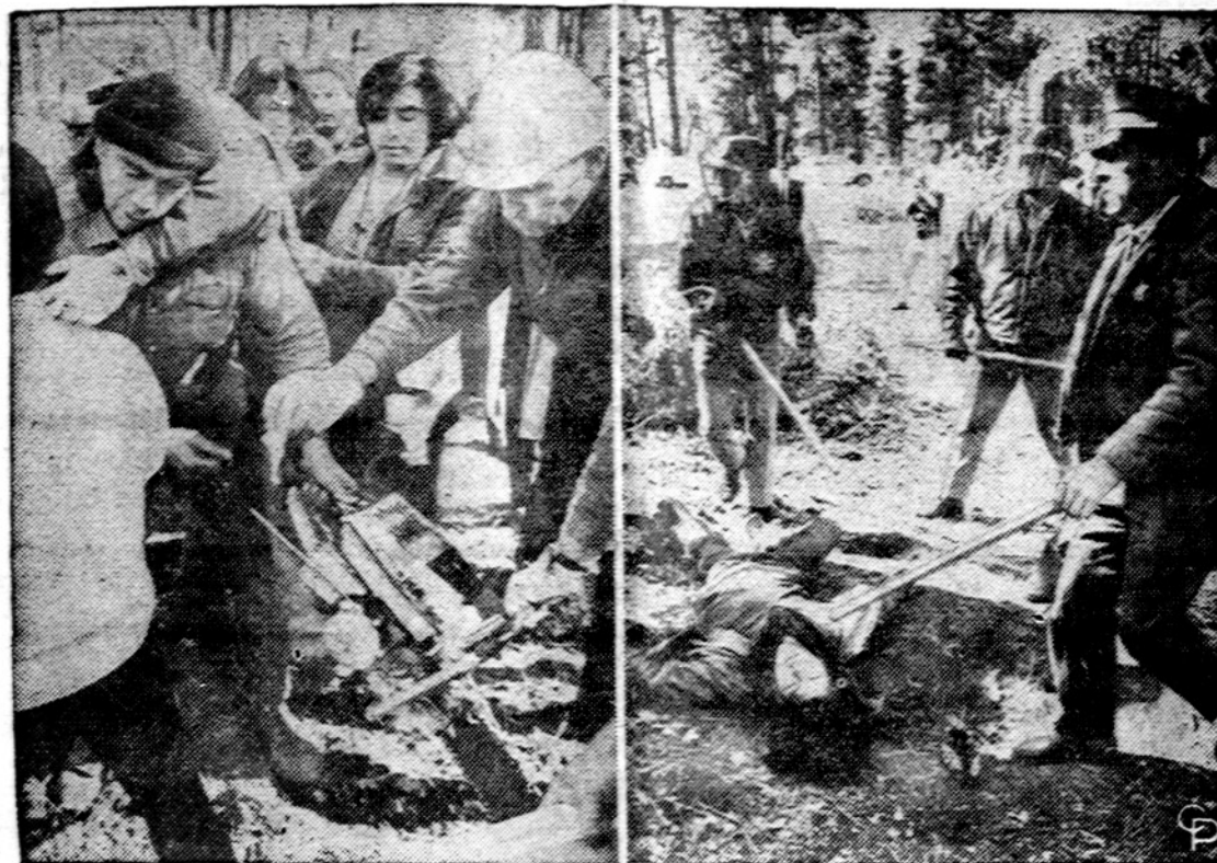
Kai indėnai kirtė Californijos valdiniam miške retus medžius ir norėjo ten apsigyventi, namus pasistatė, įsikio policija įvyko muštynės ir buvo suimti 23 indėnai.

Berlynas: Luteronų Bažnyčios iniciatyva Berlyne įsteigta visų krikščionių vienybės (ekumeninis) sąjūdis, kuriam priklauso šalia katalikų Bažnyčios dar devynios protestantų Bažnyčių bendruomenės. Bendoroje konferencijoje sudarytos keturios tikėjimo, krikščionių vienybės, misijų ir bendradarbiavimo ryšių palaiškymo komisijos.