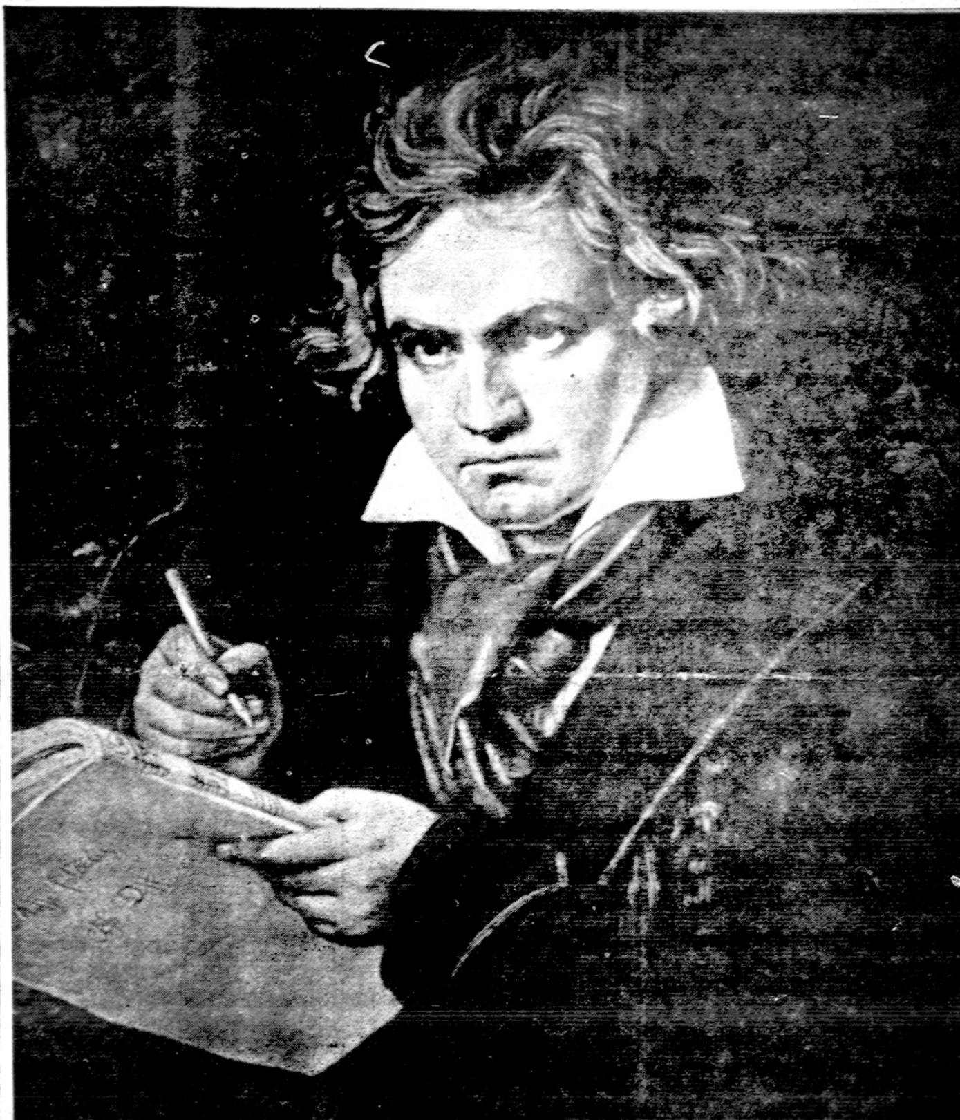
Ludwig van Beethoven, laikantis vieną iš didžiųjų savo kūrinių "Missa Solemnis"

kaip pianistas, o iš 12 metų amžiaus jau turime atspausdintų kunigaikščiu dedikuotų keletą trumpų fortepijono sonatų ir vargiacijų, rodančių, nepaisant formos trumpumo, nemažą sugebėjimą, aiškų kūrybinį talentą ir net kai kuriuos būsimą Beethoveno bruožus. Liudviko tėvas turėjo vis didėjančią palinkimą alkoholin. Sūnui nuo 11-12 m. teko vargonininkauti, kunigaikščio orkestre groti viola ir net operų pastatymuos palydėti orkestrą fortepijonu; tai buvo tada at-