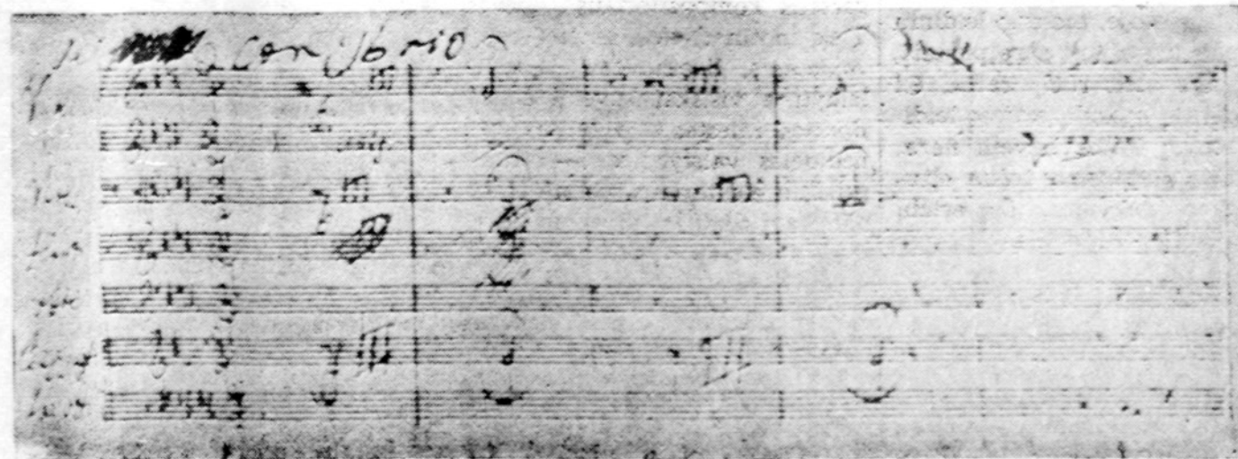
Ludwig van Beethoven rašantis; Penktosios simfonijos pirmieji taktai