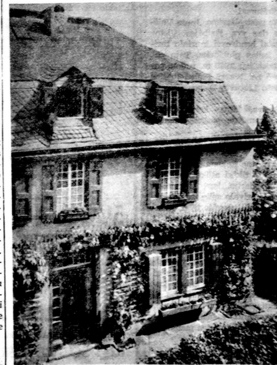
Ludwig van Beethoven gimtasis namas šilandienėje Vakarų Vokietijos sostinėje Bonnoje.

Savo asmenybės jėga, o iš dalies ir istorijos raidai remiant, Beethovenas įvykdė vieną svarbią visuomenišką reformą: kuni-