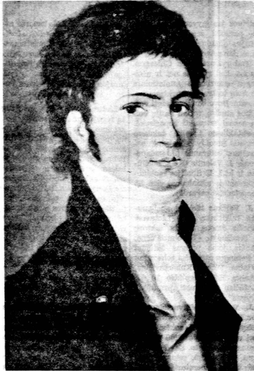
Ludwig van Beethoven apie 30 metų amžiaus — tuo laikotarpiu, kai jis parašė Patetiškąją sonatą, Pirmąją simfoniją ir Mėnesienos sonatą.

iki amžiaus galo Beethovenas mėgdavo puošniai apsirengti, bet namuose dažnai būdavo tik pusiau apsirengęs. Iš to kildavo žinios apie "suvargusių genijų", kurį pusiau apsirengusį nešvariame bute aplankydavo koks keliaujantis anglų lordas. Iš tikrųjų, Beethovenas turėjo gana neblogas sąlygas, kurias šiuo metu turėti tik keletas garsųjų kompozitorių — jis galėjo pragyventi iš savo kūrybos; chaotiškai šeiminkaujant, suprantama, būdavo momentu, kai kalendoriaus lape likdavo Beethoveno užrašas "Nichts zu essen" (nėra ko valgyti). Jam mirus, stalčiuje tačiau buvo rasta keliolikos tūkstančių pinigų suma.