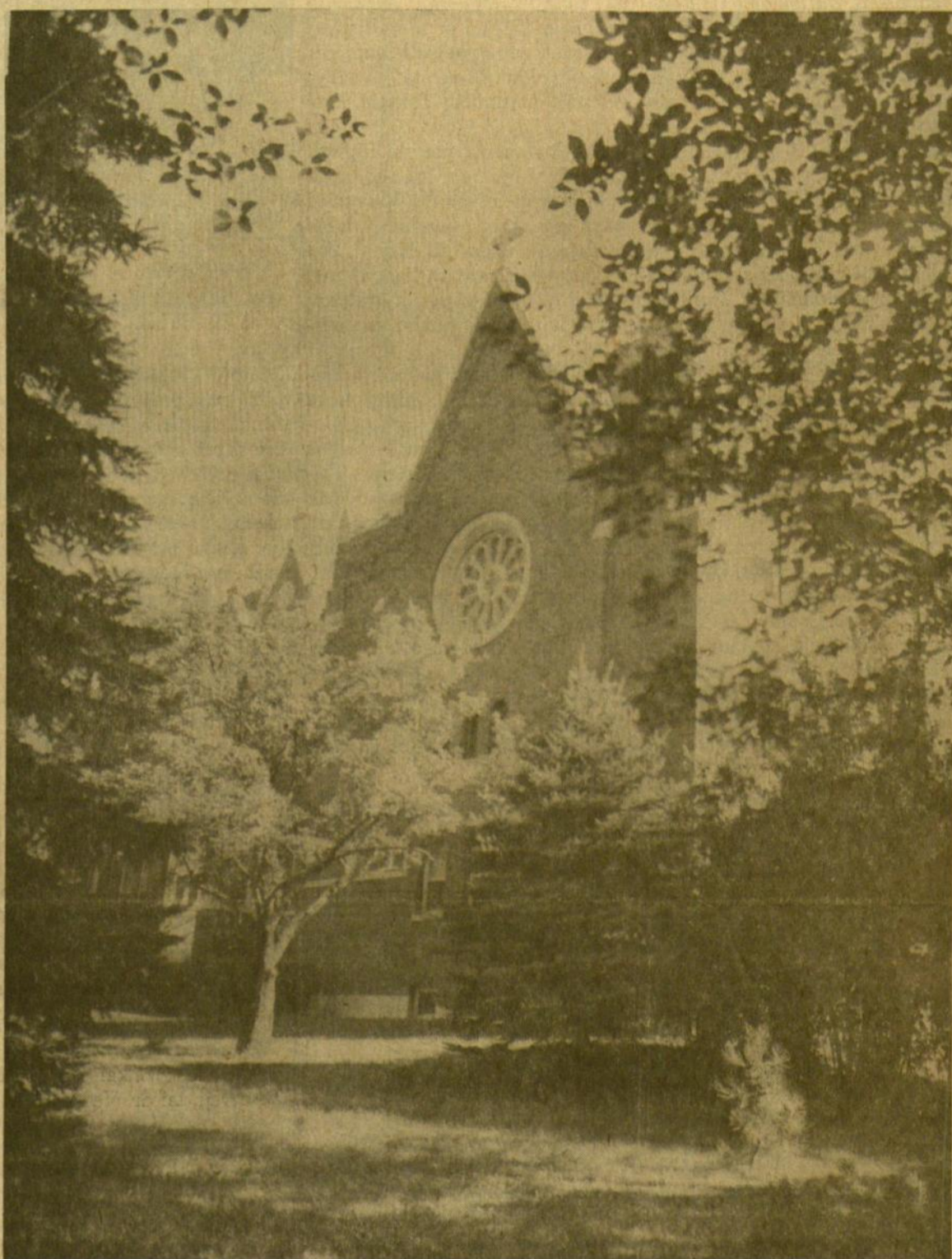
Vasara lietuvių marijonų sodyboje, Charendon Hills, prie Čikagos

Nusikreipimu prieš išmintį ir pažinimą tikėjimo negalima nei sustiprinti nei jo vertės padidinti. Jeigu tikėjimo vertingumas būtų priklausomas nuo žmogaus protingumo mažinimo, tai šitokio tikėjimo negalima būtų laikyti humanistine vertybe.