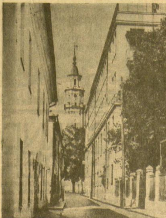
Dągirdo gatvė Kauno senamiestyje

Bet dar ne viskas, ką norime pasakyti. Toji senojo Kauno aikštė nesivadintų Rotušės aikšte, jeigu joje nebūtų rotušės, miesto valdžios rūmų, dailėsnių gal ir už anas bažnyčias, jei ji neturėtų bokšto, aukštesnio už visus miesto bokštus. Rotušė stovi aikštės vidury, neužstatyta jokiais mūrais, tik apsupta žalių kaštanų ir klevų vainiku. Balta, lyg kasdien prausiama, procingų išmatavimų, grakšti, liekna, lyg gulbės kaklas. Gal už tai ji ir gavo Baltostos gulbės vardą.