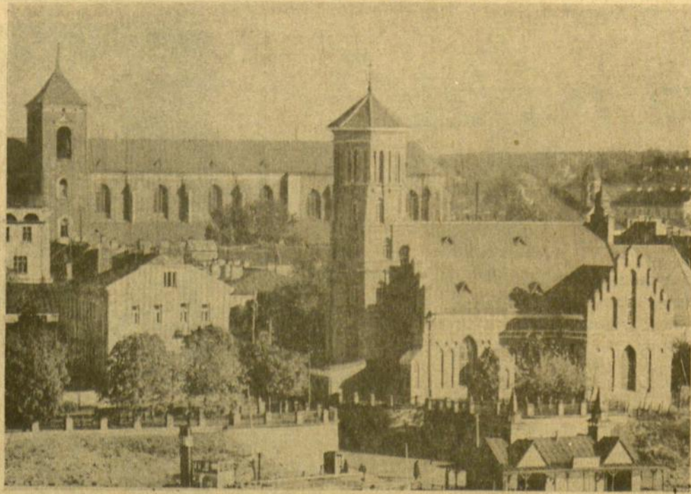
Kauno senamiesčio vaizdas nuo garlių prie plaukos