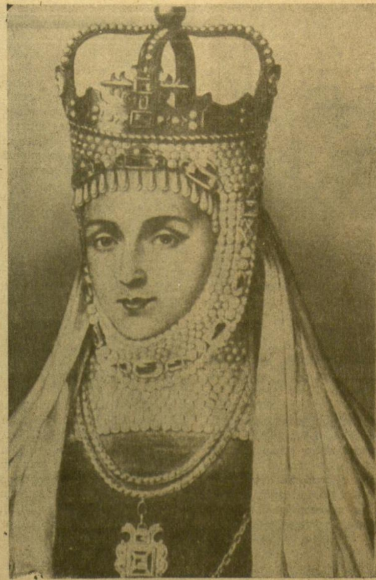
Barbora Radvilaitė, Žygimanto Augusto žmona, 1522-51

Žygimantas Augustas turėjo pakelti kietą kovą ir su lenkų didikais, kad jie pripažintų Barbora savo valdove. Vyko triukšmingos scenos seimuose. Bet paprastai silpnos valios paskutinis gėdinais čia savo pasiekė. Kai tik tėvas pasimirė, jis pristatė Bar-