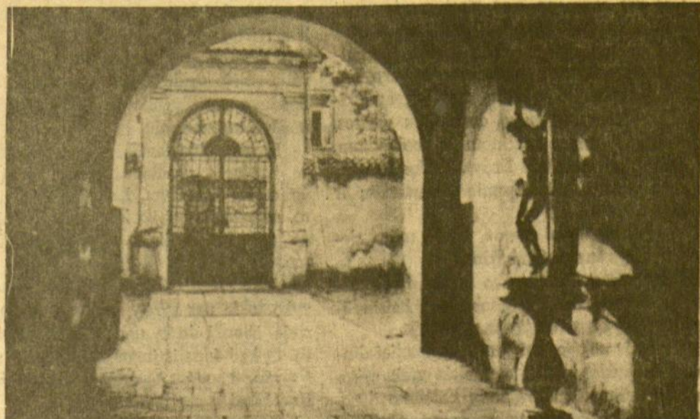
Kauno bazilikos prieangis ir šventoriaus vartai

Kiti Pūko draugai skųsdavosi policininkais (Nukelta į 4 pusl.)