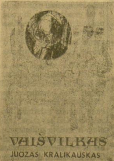
J. Kralkausko romano viršelis, pieštas Zitos Sodeikienės.

vertinimas (jo bus dar ir tęsinys). Žurnalo viršelius puošia dail. A. Tamošaitienės darbų nuotraukos, o puslapius — švedijoje gyvenančio mūsų dailininko E. M. Budrio tapybos.