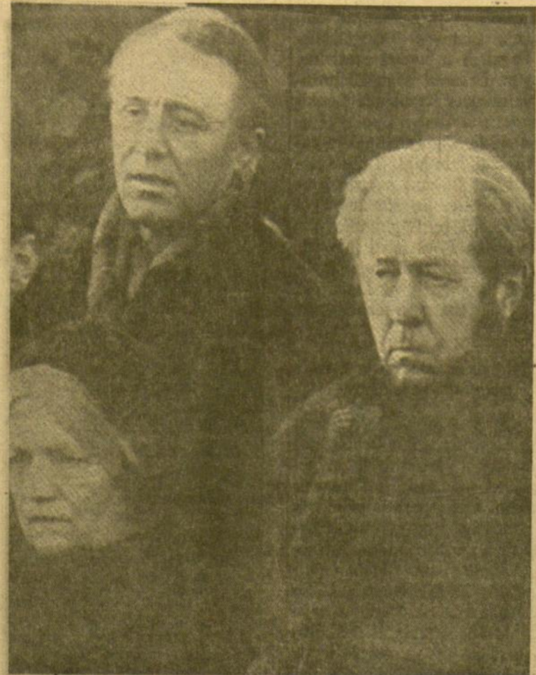
Rusų rašytojas Aleksandras Solženicynas (dešinėje) savo bičiulio redaktoriaus ir rašytojo Aleksandro Tvardovskio laidotuviuose praėjusį antradienį Maskvoje. Šermenys jis čia lydi velionio Tvardovskio našę.