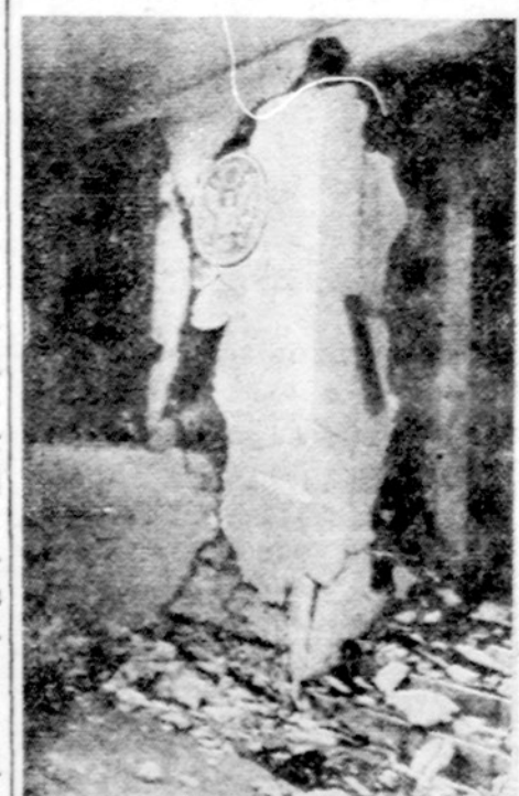
Simboliška ir reikšminga. Per žemės drebėjimą Nicaraguoje Amerikos ambasados namai Managuoje sugriuvo, bet gabalas sienos, kur kabo herbas, stovi, iškaba nenukrito.

SAIGONAS. — Prez. Thieu i Washingtoną siunčia penkis senatorius, kad jie ištirtų Amerikos nuotaikas, susitiktų su