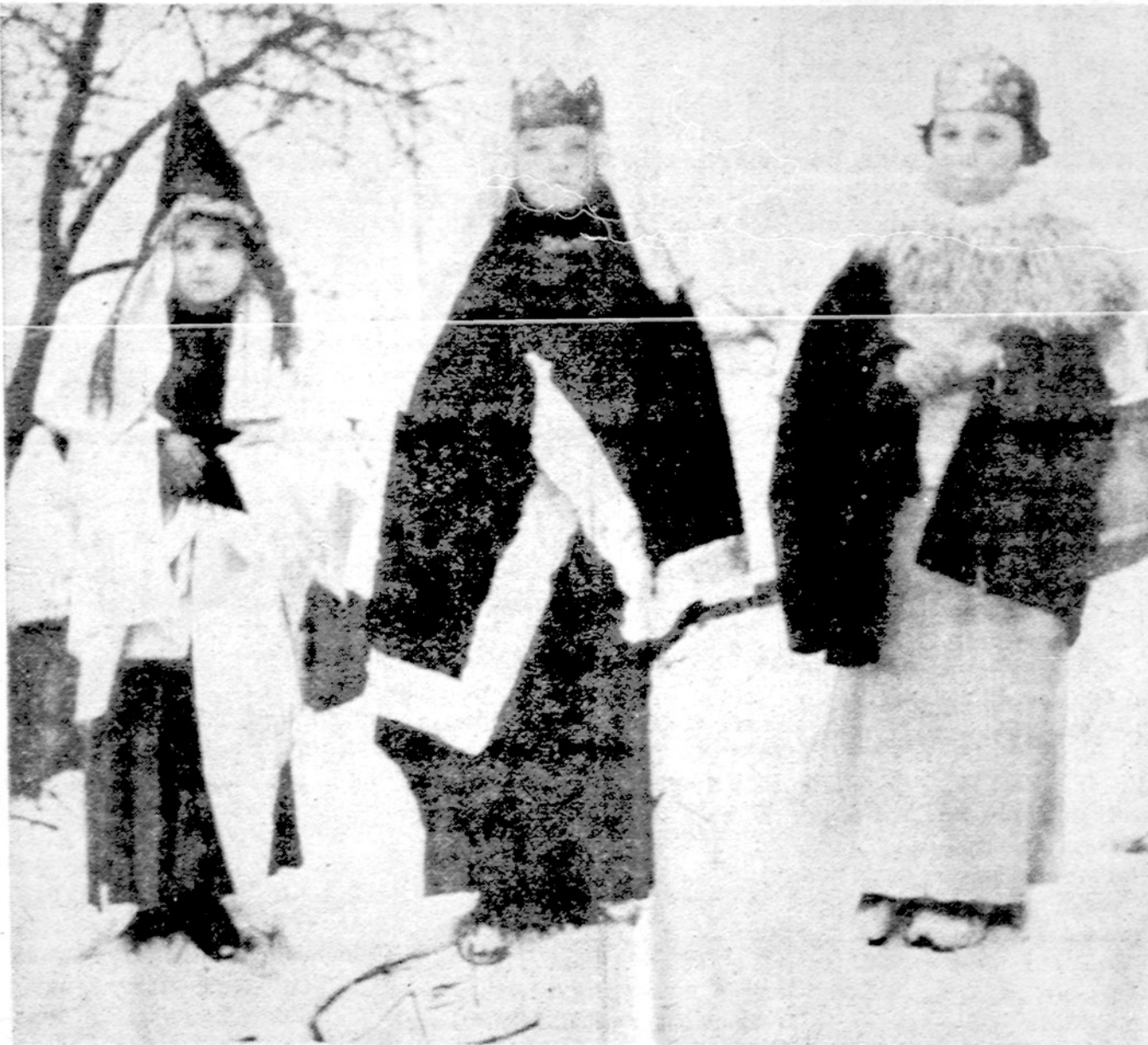
"Trys karaliai" keliauja iš kiemo į kiemą. Raudondvaris.

Vilniaus "Tiesoje" randame žinią, kad šiuo metu trisdešimtyje aukštųjų mokyklų, esančių Sovietijoje, mokosi 347 Lietuvos studentai. Kiekvienais metais tose mokyklose baigia mokslus 80-90 studentų.