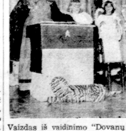
Vaidzas iš vaidinimo "Dovanų karalius" Chicagos Kr. Donelaičio mokyklos eglutės programoje.