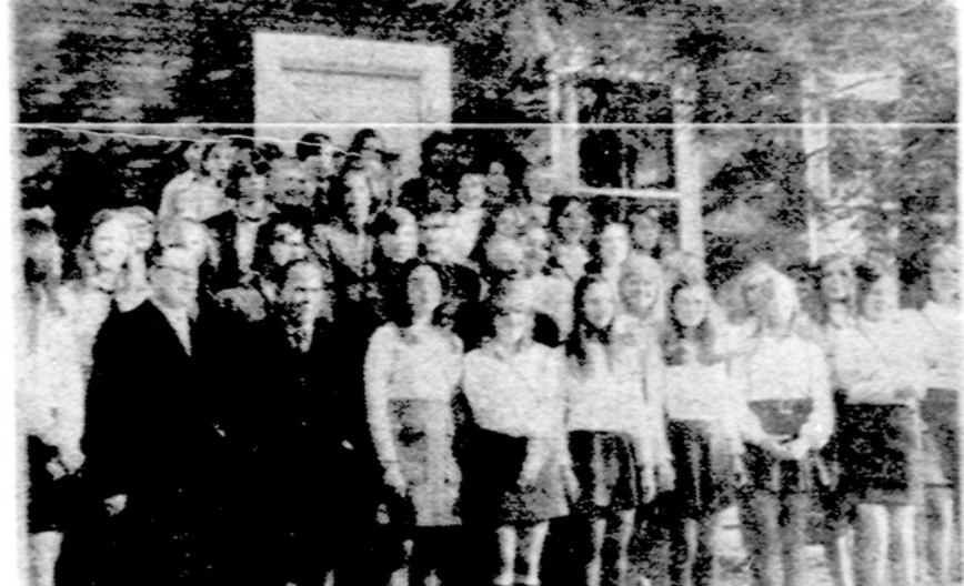
Moksleiviai ateitininkai kartu su paskaitininkais ir vadovybe ideologinių kursų metu, lapkričio 23-26, Putnam, Conn.