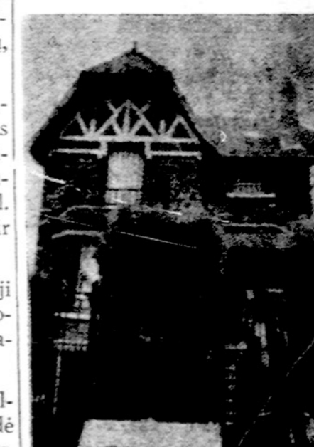
Paryžiaus užmiečio vila, kur Kissingeris vėl susitinka su Hanojaus delegatu Le Duc Tho ir atnaujina nutrukusias taikos derybas.

Hanojus. — Š. Vietnamas skundžiasi, kad Amerikos bombos išaiškino, kad Amerikos bombos nuo 20 paralėlės, Sako, kad bombos krito į Dong Lai, 50 mylių į pietvakarius nuo Hanojaus.