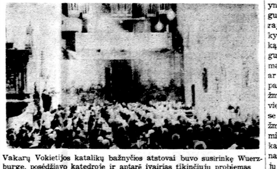
Vakarų Vokietijos katalikų bažnyčios atstovai buvo susirinkę Wuerzburge, posėdžiavo katedroje ir aptarė įvairias tikinčiųjų problemas

Mechanizuotų miestų augimas atėmė didžiausių pakitimų miestų pobūdyje. Dabar miestai auga ir miestus milžinus, kurių geriausias pavyzdys yra miestas, besitęsias nuo Bostono per New Yorką į Philadelphia ir nuo Baltimorės į Washingtoną. Kar-