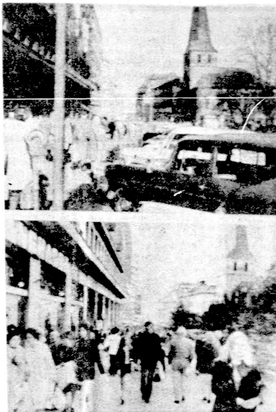
Vis daugiau ir daugiau kraštų įsitikino, kad automobilių susikimšimas miestų centruose gyvenimą daro negalimą, ir centrinės gatvės jau paliekamos tik pėstiems. Viršuje Essen miesto, Vakarų Vokietijoje, prieš kelis metus, ir ta pati vieta šiandien.

Washingtonas. — Šeštadienį posėdžiavo Kongreso abeji rūmai ir patvirtino prezidentinius rinkimus. Vadinasi, dabar jau tikrai žinome, kad Nixonas ir Agnew išrinkti.