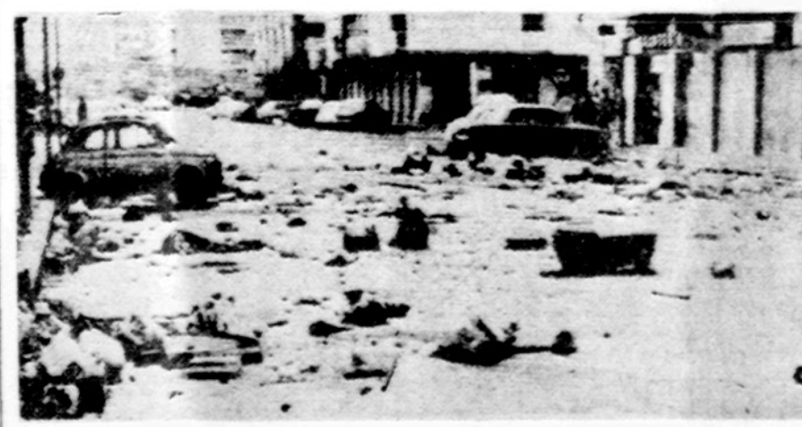
"Naujųjų Metų pamišimas". Taip galima pavadinti Romos gyventojų paprotį N. Metų rytą pro langą į gatvę išmesti viską, kas nereikalinga

SACRAMENTO. — Californijos respublikonai spaudžia gubernatorių Ronald Reagan atsiskaityti savo nutarimo trečią kartą nekandidatuoti į gubernatorių 1974 metams. Kito tokio populiarus ir tinkamo administratoriaus respublikonai neturi ir bijo, kad besivaržydami kandidatai gali suskaldyti partiją ir prarasti labai svarbų postą didžiausioj Amerikos valstijoje.