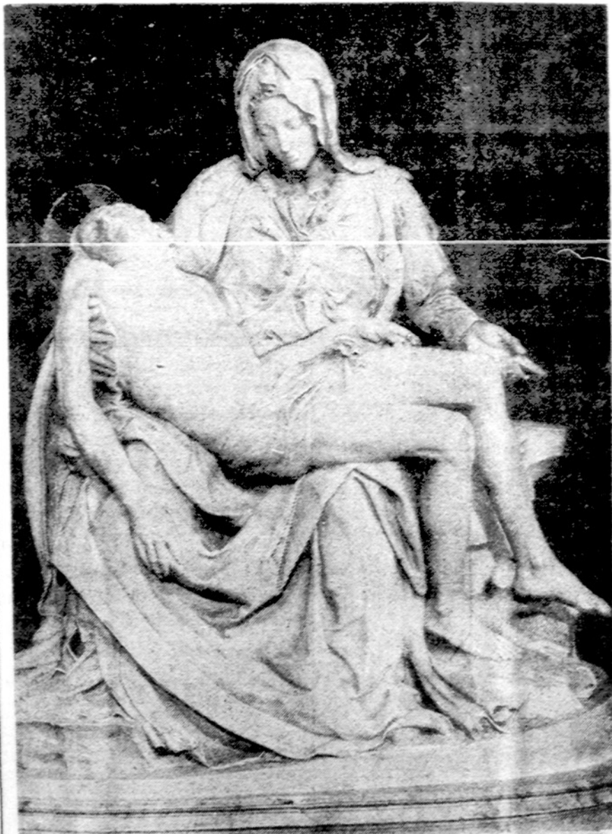
Mykolo Angelo Pietą, praėjusią vasarą pamišėlio ar piktadario smurtai sužalota, menininkų ekspertų pataisyta ir vėl išstatyta Šv. Petro bazilikoje, Vatikane

NEW ORLEANS. — New Orleano šaudytojai ar šaudytojas "dingo". Po dviejų dienų apsupimo, policija nusileido ant Howard Johnson viešbučio stogo, išieškojo visus užkampius, bet šaudytojo nesurado. Pabėgti jis ar jie negalėjo. Policija laiko apsupusi ne tik tą vieną bloką, bet visą miesto centrą, 50 bloką, buvo atskirtas nuo pasaulio. Nušautų žmonių skaičius jau sumažėjo nuo 10 iki 7, o sužeistų buvo 20.