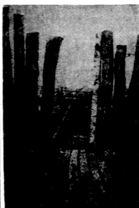
Hitlerio palikimas savo tautai: per vidurį Vokietijos išvesta nepereinama, spygliuotų vielų siena, minų laukai

Italų kalba Eltos biuletenyje 1972 rugpiūtio — rugsėjo mėn. nr. 8—9, tarp kitko, yra sekantieji aprašymai: . Butkaus su šei ma pasitraukimas į Vakarų; Bru talus policijos eilegys su Kalan tos draugu; Rusų antplūdis į Lietuvą; Laisvieji lietuviai ruošiasi ginti Lietuvos interesus Europos Saugumo konferencijoje; Pavergtųjų Europos Tautų seimo plenumo rezoliucijos; Sovietų laivo įgula paprašo azyliaus teisių Graikijoje (jų tarpe vienas lietuvis); Kosygin: vizitas Lietuvoje; Sovietai naudoja gėralų monopoliją Lietuvos dvasiniam pavergimui, rusifikacijai; Italų komunistų delegacija Lietuvoje; Aštuonių jau nuolių teismas Vilniuje; Vlko protestas JT Žmogaus teisių komisijai dėl tikybos ir kitų žmogaus teisių varžymo Lietuvoje; "Sovietskaja Litva" straipsnis, raginantis švelninti tikybos persekiojimo taktiką; Ateistinių spaudinių antplūdis Lietuvoje; Vokietijos episkopato solidarumas su persekiojamais Lietuvos katalikais: — Vokietijos Kardinolas Julius Döpfner, kalbėdamas per Bavarijos radiją, atkreipė dėmesį į sunkią Bažnyčios padėtį Lietuvoje, Ateizmo propagandistų apdovanojimas S. Vavilov ordinaru už ypatingai uoliai kovą prieš tikybą.