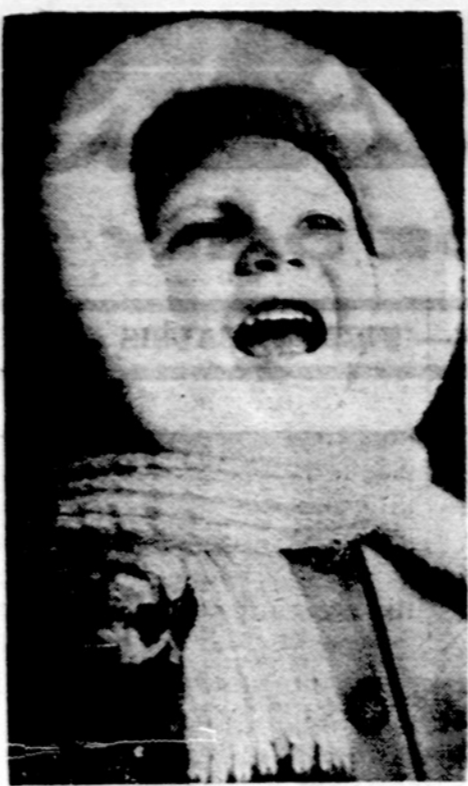
Ziemai atėjus.

1973 m. Pabaltiečių slidinėjimo pirmenybės įvyks šeštadienį, kovo 3 d., Devil's Elbow Skiing Resort, Bethany, Ontario, Kana doje, apie 60 mylių į šiaurę nuo Toronto. Programoje: slalomas ir didysis slalomas įvairiose klasėse. Smulkesnės informacijos bus išsiuntinėta klubams ir paskelbta spaudoje vėliau. Varžybas vykdo latviai.