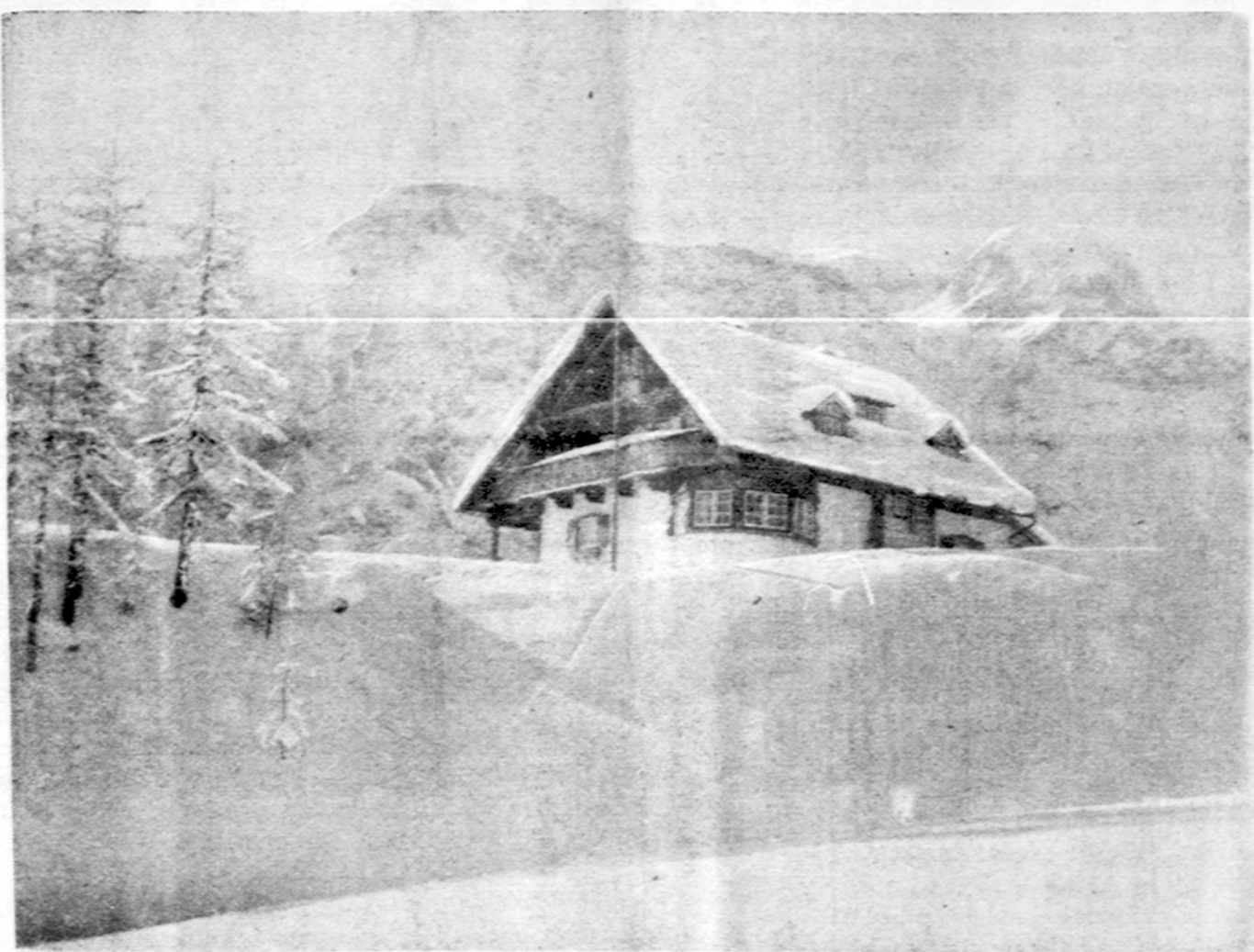
"Rytprūsių namas" Alpe. Taip vadinasi ši nedidelė užiega Austrijos Hochkoenig kalnuose, 1630 metru nuo jūros lygio