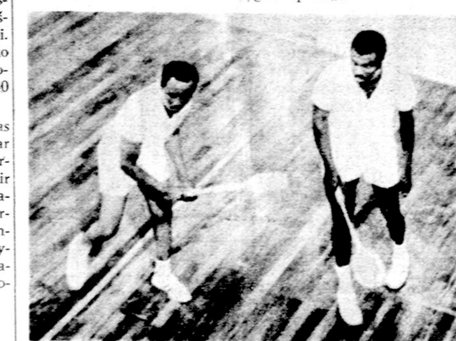
Didžiausias Afrikoje valstybės Nigerijos galva Gowon (kairėje) yra ataklus tenisinkas