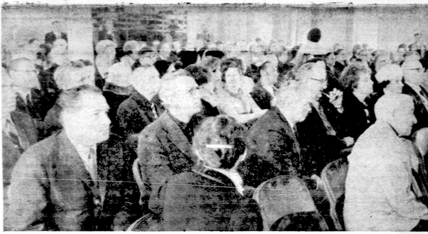
Dalis Cicero LB apylinkės metinio susirinkimo dalyvių sausio 7 d. Cicero parapijos salėje. Platusis aprašymas buvo Drauge sausio 9 d.

Kviečiame taip pat klausytis — Lietuviškų Kultūrinį Valandų angli kalba, iš Seton Hall University radio stoties: (New Jersey WSOL) (89.5 meg. FM) Pirmad., 8:05-9:06