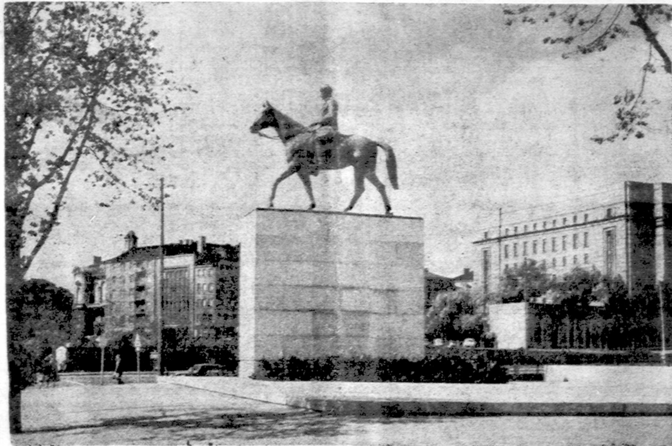
Mannerheimo, suomių didvyrio, paminklas Helsinkyje. Cia sausio 15 vėl buvo atnaujinti Europos Saugumo konferencijos paruošiamosios sesijos darbai.

WASHINGTONAS. — Kongrese yra balsų, kad Amerikos rinkimai turėtų būti paankstinti, ne lapkričio, bet spalio mėnesiais. Tada būtų mažiau laiko priešrinkiminei agitacijai ir būtų geresnis oras balsavimams.