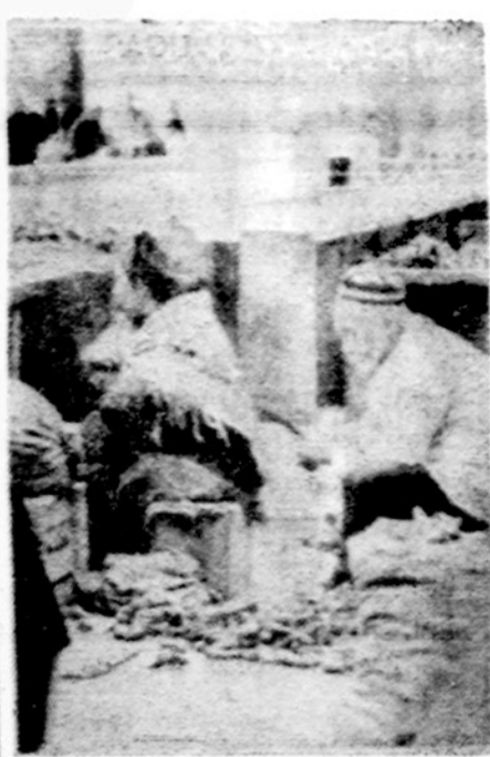
Sovietiniai rusai yra paverę 122 tautas. Čia matome vidurinės Azijos gyventojus, kurie visomis išgalėmis stengiasi laikyti savo tautinių ir religinių papročius

klusomai nuo to, kokių laipsnių Amerika panorės išlaikyti savo pozicijas pietryčių Azijoje pasitraukus iš Vietnamo, pietryčių Aziją laiko savo pačios saugumo erdve. Tai verčia Japoniją perimti JAV vaidmenį pietų Azijoje ir Taiwane. Tai nepriešrauja JAV interesams, nes taip ar kitaip, jie visvien bus užtikrinti. Tas savo užmačius Japonija nori išlaikyti sutarties su JAV rėmuose ir stengiasi, kad jos vaidmuo toje sąjungoje būtų veiksmingesnis nei dabar.