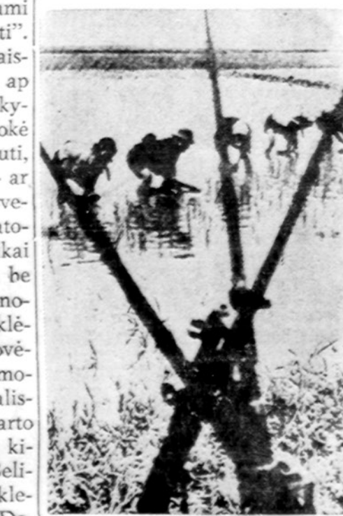
Siaur. Vietname ryžių laukai. Prieky susatyti šautuvai, kad kiekvieno metu galėtų atremti "amerikičių arba jų tarnų" oro puolimus

BATON ROUGE. — Mrs. Hale Boggs, lėktuvo nelaimėje dingusio kongreso žmona, nori būti demokratų nominuota į vyrovietą ir išrinkta į Atstovų rūmus iš Louisianos 2 apygardos.