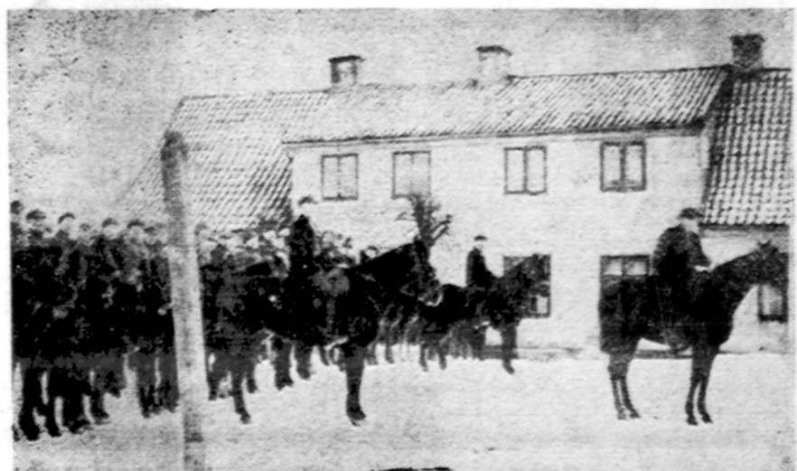
Šiandien sueina lygiai 50 metų. Lietuviai raiteliai, Klaipėdos sukilėliai 1923 sausio 15.