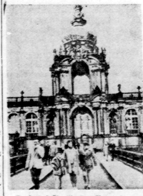
Po ketvirtio šimtmečio metų pertraukos vakarų Berlyno gyventojai gavo leidimą aplankyti savo krašto įjymų miestą, meno centrą Drezdeną Rytų Vokietijoje

BERLYNAS. — Rytų Vokietija ir Ispanija tuo pačiu metu pranešė, kad jos nutarė užmegsti diplomatinius santykius. R. Vokietija bus pirmoji komunisticinė valstybė, kuri turės savo ambasadą Madride.