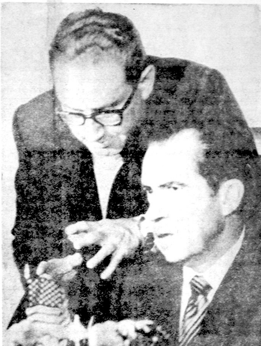
Nixonas ir Kissingeris. Veik visą praėjusį sekmadienį Key Biscayne juodu praleido besitardami apie derybas Paryžiuje