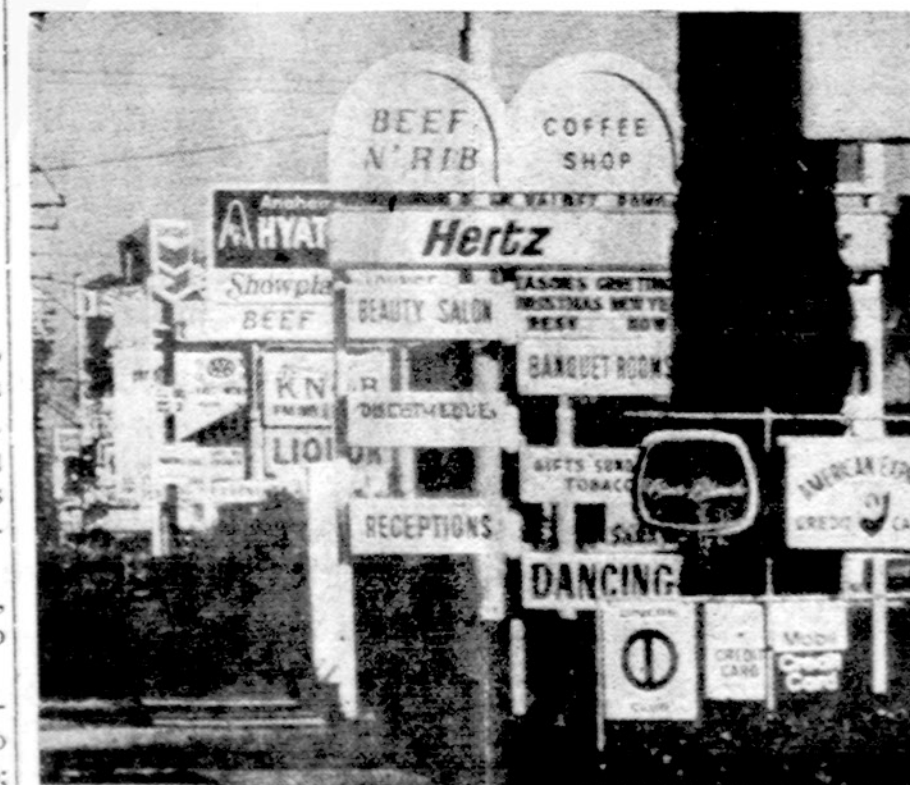
Baisiau negali būti. Toks pirmas įspūdis, įvažiavus į vieną vakarų Amerikos miestą.

Daugiausia saulėta ir šilčiau, temperatūra apie 50 laipsnių.