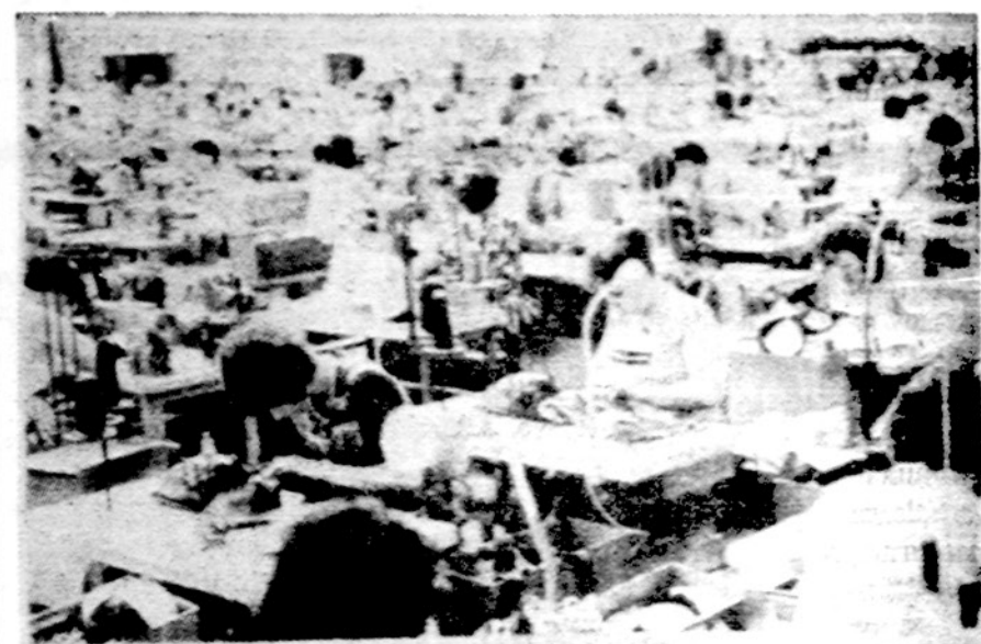
Vakarų Vokietijos pramonininkai savo fabrikuose vis labiau plečia darbininkų dalyvavimo įmonės pelne sistema ir tuo didina produkciją

Šiuo metu apie EEB parlamentą yra daug kalbama. Stipri ir įtakinga nuomonė yra, kad tas parlamentas EEB turi būti