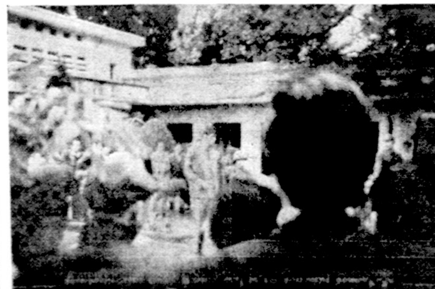
Amerikiečiai karo šolaisvaid, B-52 lakūnai Hanojuje