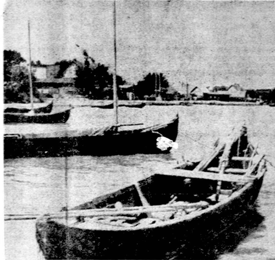
Rasytė. Kuršių Nerijoje, tarp Nidos ir Kranto, Mažosios Lietuvos žvejų uostas ir vasarvietė

BELFASTAS. — Š. Airijos teroristai peršovė kojas penkiems žmonėms, įtardami, kad jie bendradarbiauja su britų kariuomenės vadovybe ir pranešė apie IRA veikimą.