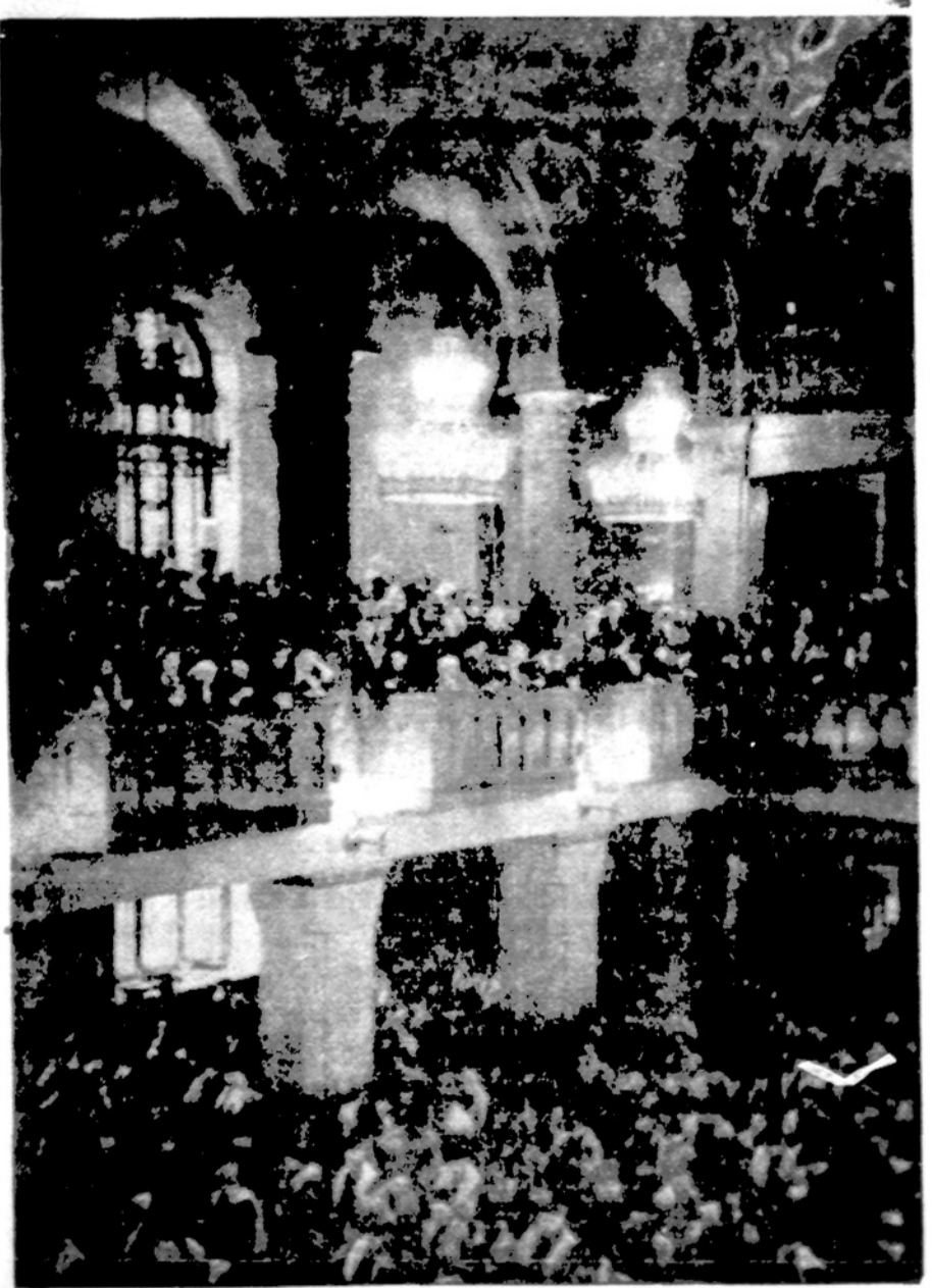
Šią nuotrauką — žydų pamaldas sinagogoje, — paskelbė ir į užsienį išsiuntinėjo patys sovietai propagandiniams sumetimais. Kas gali patik-rinti, ar susirinkusieji yra tikintieji, ar artistai, tikra sinagoga, ar fil- mų studijos dekoracijos?

WASHINGTONAS. — Aukš- čiausiojo teismo pirmininkas Warren Burger sako, kad evan- gelisto Billy Graham siūlymas visose mokyklose skaityti 10 Dievo įsakymų yra nekonsti- tucinis ir negalės būti įvestas be atitinkamo Konstitucijos pa- taisymo.