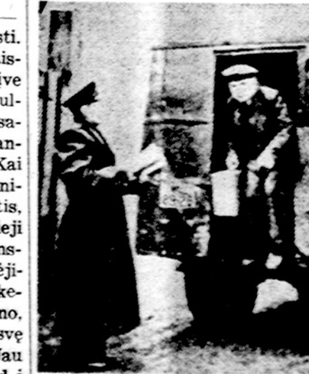
Iš sovietinių tautų „draugystės“... Rusas enkavedistas atveža ukrainietį į koncentracijos stovyklą.