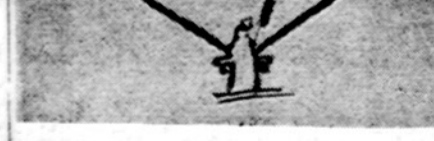
Mokyklos kieme mokiniai įrėngė kvadratinės formos čiūozyklą. Aikštės kampuose padarė suoliukus ir pastatė sniego senius. Suoliukus prisaldė prie ledo, kad vaikai nestumdytų. Vakarais susirinkdavo labai daug žuozėjų. Mokytojas patarė čiū

IV Pažiūrėkit į bet kokią knygą suoliukus ir pastatė sniego senius. Suoliukus prisaldė prie ledo, kad vaikai nestumdytų. Vakarais susirinkdavo labai daug žuozėjų. Mokytojas patarė čiū