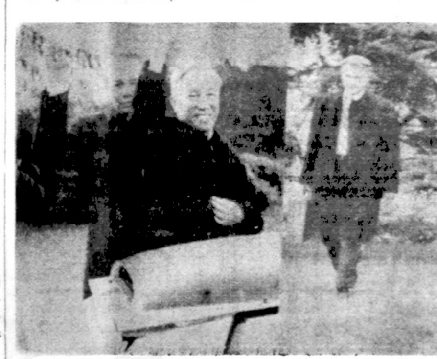
Paryžiuje baigus pastarimus. Kairėje Hanojaus Le Duc Tho ir Xuan Thuy, dešinėje Henry Kissingeris ir jo artimiausieji bendradarbiai.

Gerai žiną sako, jog Kissingeris buvo įgaliotas Hanojui pranešti, kad jei po paliaubų jie mėgintų daryti koki "pasivaikščiojimą" po Pietų Vietnamą, Nixonas nepabijūs vėl atnaujinti Šiaurės Vietnamo bombardavimą.