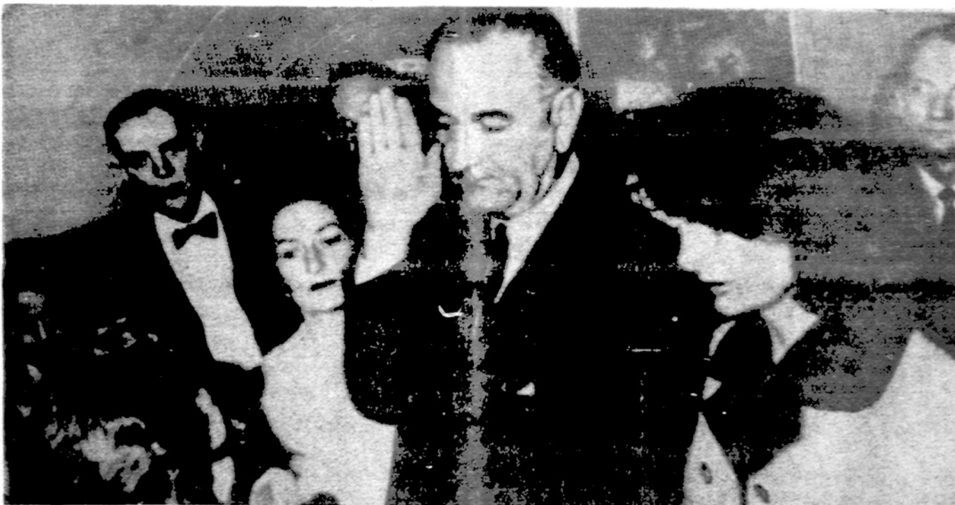
Pirmoji prezidentavimo minutė. Lyndon B. Johnsonas su kiausiais pasauly pareigas perėmė be inauguracijos iškilnių ir parady, valandai praėjus po prez. John F. Kennedžio nužudymo 1963 lapkričio 22. Lėktuve. Dallas aerodrome. Priesaiką priima federalinė teisėja Sarah Hughes. Šalia Johnsono jo žmona ir Kennedžio našlė Jackie.

WASHINGTONAS. — Šią savaitę reikia laukti apšildymui naudojamos alyvos pabrangimo. Kai kurios bendrovės kainą pakels 8 procentais.